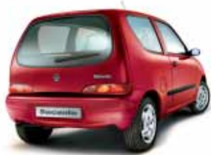
■ 132 Rosso Scilla