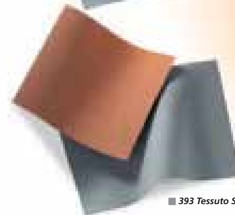
■ 393 Tessuto Squash Arancio