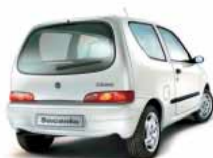
■ 249 Bianco