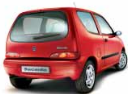
■ 199 Rosso Tiziano Vernice extraserie