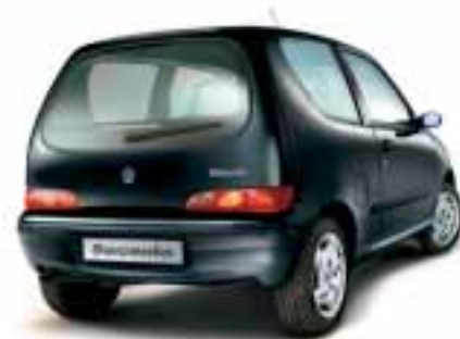
■ 632 Nero