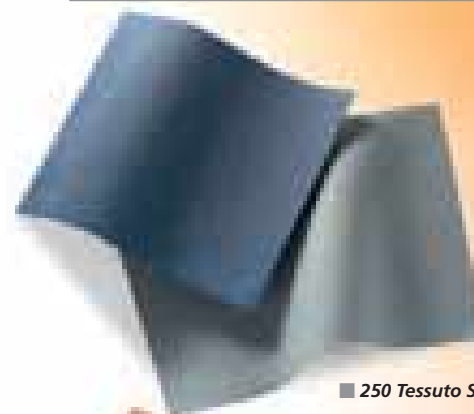
■ 250 Tessuto Squash Blu