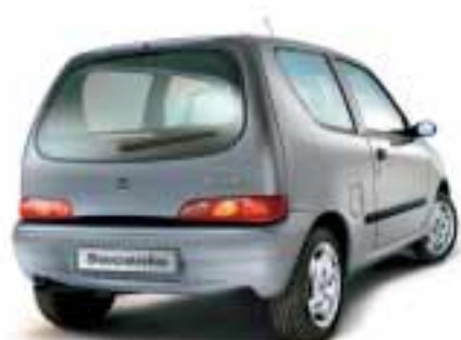
■ 647 Grigio Steel