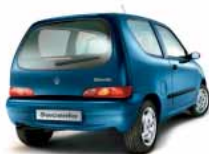
■ 597 Blu Teseo