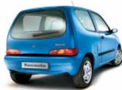
■ 734 Blu Cocktail