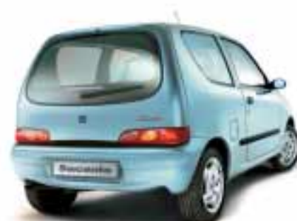
■ 737 Azzurro Frizzante