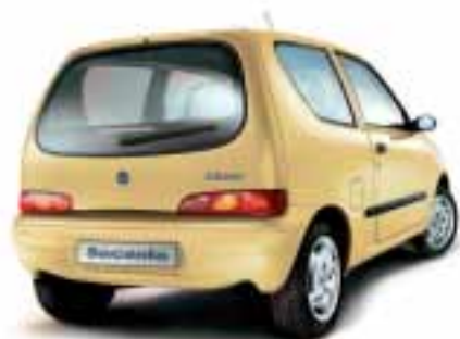
■ 541 Giallo Vanilla