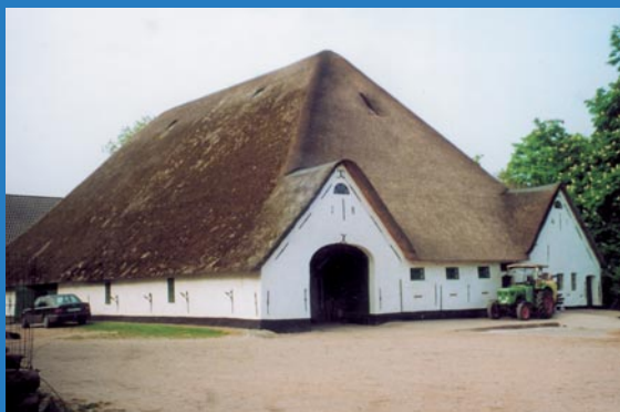
Haubarg auf Hülkenbüll

Während die Gemeinde früher stark landwirtschaftlich geprägt war, hat sich das in den letzten Jahren verändert, und der Strukturwandel hat die landwirtschaftlichen Betriebe stark dezimiert. Heute gibt es nur noch ca. 15 Vollerwerbsbetriebe. Die private Vermietung an Gäste in den Sommermonaten, auch auf den Bauernhöfen, ist eine wichtige Einnahmequelle. An Gewerbebetrieben sind eine Schlosserei mit Fahrradwerkstatt, eine Tischlerei und landwirtschaftliche Lohnunternehmen vorhanden.