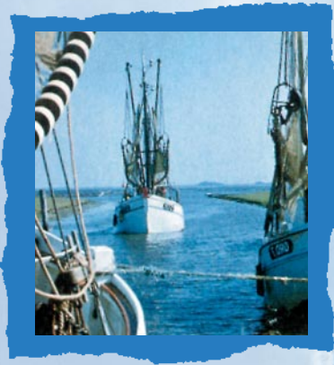
Im Koog an der Tümlauer Bucht

Zusammen mit Tating bildet der Tümlauer-Koog eine Kirchengemeinde und den Feuerlöschverband. Ebenso beteiligt sich der Tümlauer-Koog an den Vereinen in Tating. Eigene Vereine hat der Tümlauer-Koog nur zwei, den Fremdenverkehrsverein, der bedingt durch die gute Vermietung, sich sehr aktiv um das Wohlergehen der Gäste kümmert, und den Manns- und Fruunsboßelverein, der sich bemüht, ein altes Heimatspiel zu erhalten.