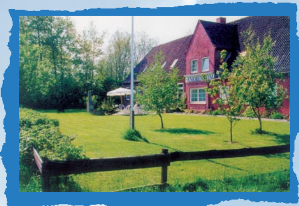
Seniorenheim in Osterhever

Der Kindergarten und sämtliche Schularten sind durch eingerichtete Busverbindungen zu erreichen. Ebenfalls gibt es eine gute ärztliche Versorgung. Die Daseinsvorsorge ist von der Gemeinde vertraglich geregelt.