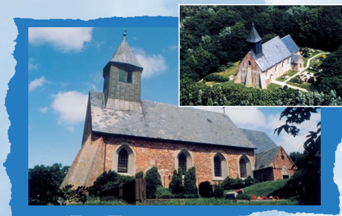
Kirche St. Martin in Osterhever