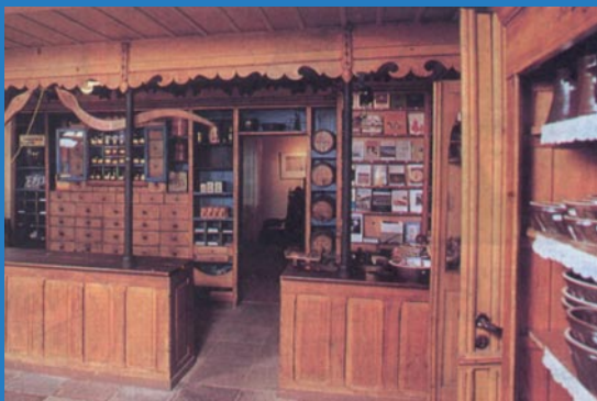
Historischer Kaufmannsladen im Haus Peters in der Gemeinde Tetenbüll

Zur Gemeinde Tetenbüll gehören noch drei weitere Gemeindeteile: Kaltenhörn, Warmhörn und Wasserkoog.