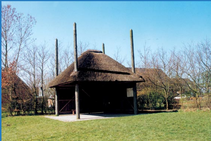
Gemeinde Poppenbüll – Vierrutenhaubarg

Die Ortsbezeichnung Poppenbüll ist nicht erst um das Jahr 1113 mit dem Bau einer Filialkirche (Kapelle) zur Gardinger Pfarrkirche entstanden, sondern ist augenscheinlich älter.