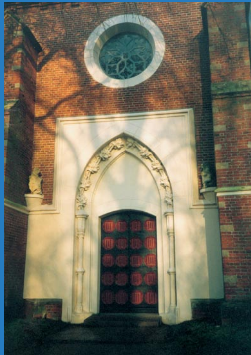
Portal der Kirche

Schulisch ist Kotzenbüll nach Tönning ausgerichtet; für die Kleinen stehen die Kindergärten in Tönning zur Verfügung.