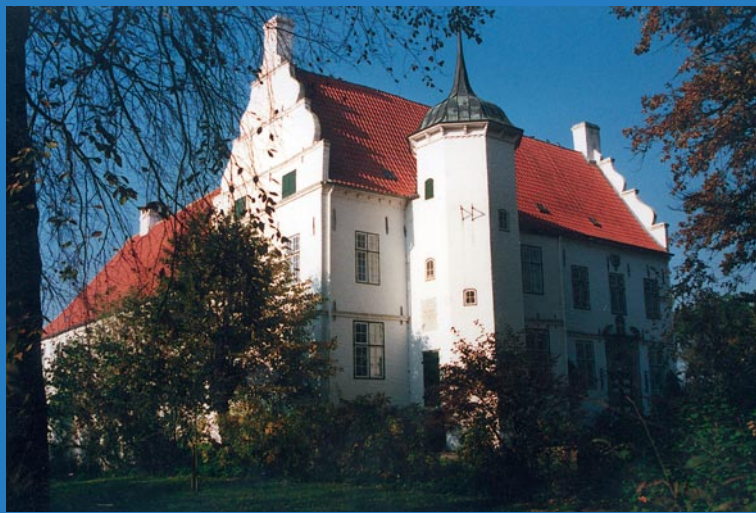
Historisches Herrenhaus Hoyerswort

Die intakte Natur, das in der Gemeinde gelegene Naturschutzgebiet mit einem vielfältigen Vogelaufkommen und der gute Ausbau des Wirtschaftswegenetzes führen dazu, dass der Fremdenverkehr auch in diesem Ort an Bedeutung gewinnt.