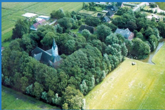
Luftaufnahme mit St. Nikolai-Kirche in Kotzenbüll

Als sehenswert ist die Nicolaikirche zu bezeichnen, die in diesem Jahr ihr 500jähriges Bestehen gefeiert hat. Allerdings ist die Wissenschaft sich darüber einig, dass bereits vorher in Kotzenbüll eine Kapelle bestanden haben muß, und zwar bereits zur Zeit von Waldemar I (König von Dänemark) in der Zeit um 1298.