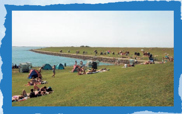
Badestrand in der Gemeinde Vollerwiek

Der Fremdenverkehr spielt in der Gemeinde Vollerwiek eine große Rolle. Von daher wurde bereits im Jahre 1968 der Fremdenverkehrsverein gegründet, der auf ehrenamtlicher Basis arbeitet. Der grüne Badestrand wurde mit Toiletten und Duschen versehen, um den Gästen den Aufenthalt so angenehm wie möglich zu gestalten. Der Ausbau von Parkplätzen, der Bau eines Kiosks und die Vermietung von Strandkörben sowie die Einrichtung einer DLRG-Wachstation haben zu einer Attraktivitätssteigerung dieser Badestelle geführt.