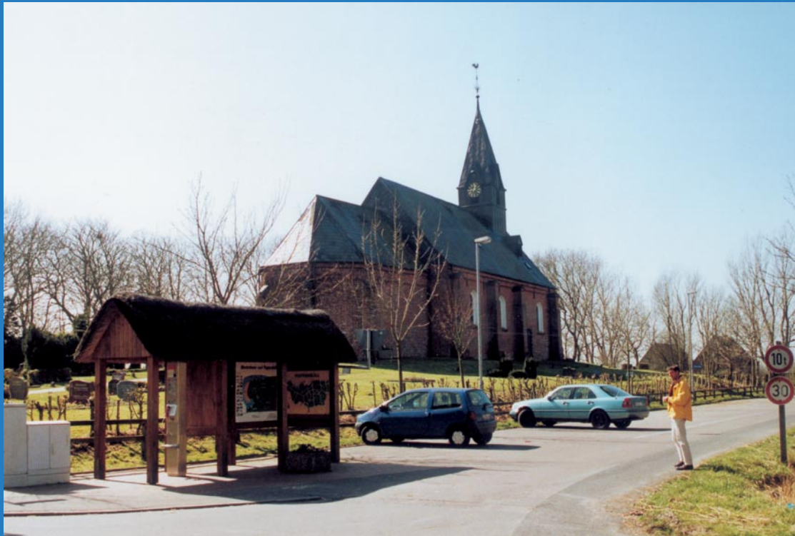
Kirche Gemeinde Poppenbüll

Die ärztliche Versorgung und Einrichtungen der Daseinsvorsorge werden im ländlichen Zentralort Garding vorgehalten.