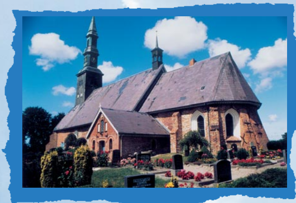
Tating, St. Magnus

Tating und Tümlauer-Koog bilden eine Kirchengemeinde. Die schulpflichtigen Kinder besuchen die Schulen in St. Peter-Ording, für die Kleinen steht der Kindergarten in St. Peter-Ording zur Verfügung. In St. Peter-Ording sind auch eine gute ärztliche Versorgung sowie eine Sozialstation vorhanden.