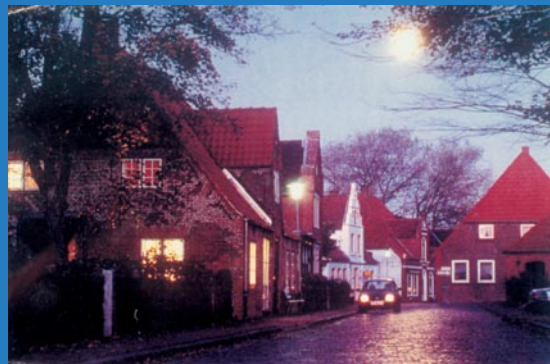
Abendstimmung in der Dorfstraße

Dies ist ein kleiner Überblick über die amtsangehörige Gemeinde Tetenbüll und alle Einwohnerinnen und Einwohner wollen mithelfen, dass wir zumindest diese so erhalten und wenn möglich ausbauen.