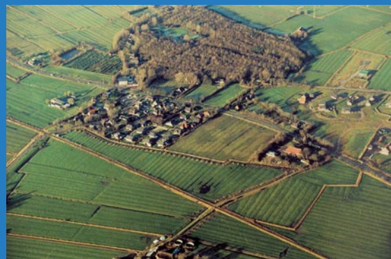
Neubaugebiet der Gemeinde Kspl.Garding

Nachdem im Ortsteil Sandwehle in den letzten Jahren ein ca. 1,5 ha großes Grundstück als Bebauungsgebiet ausgewiesen wurde, plant die Gemeinde nunmehr eine Erweiterung des Bebauungsgebietes.