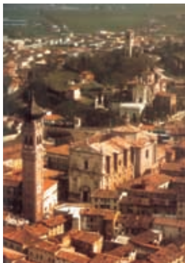
In copertina: Veduta Aerea di Carpenedolo (da "Carpenedolo Nuova Storia" di Spada e Zilioli)

GRUPPO MEDIA ® INIZIATIVE EDITORIALI E COMUNICAZIONE