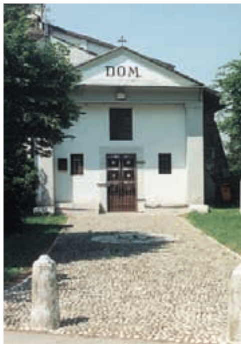
Chiesetta di San Pietro

Se arrivando a Carpenedolo chiedeste della chiesetta di San Pietro ad un passante, questi si darebbe una grattatina sulla testa pensieroso e, dopo un attimo di esitazione, probabilmente vi risponderrebbe che forse avete sbagliato paese. La chiesetta è infatti comunemente conosciuta come chiesetta di S. Gottardo,