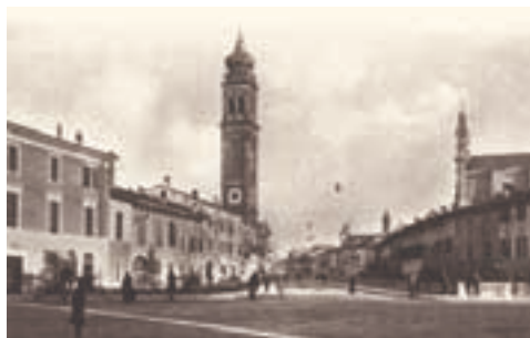
La Piazza Maggiore nel 1946 (da "Carpenedolo Nuova Storia" di Spada e Zilioli)