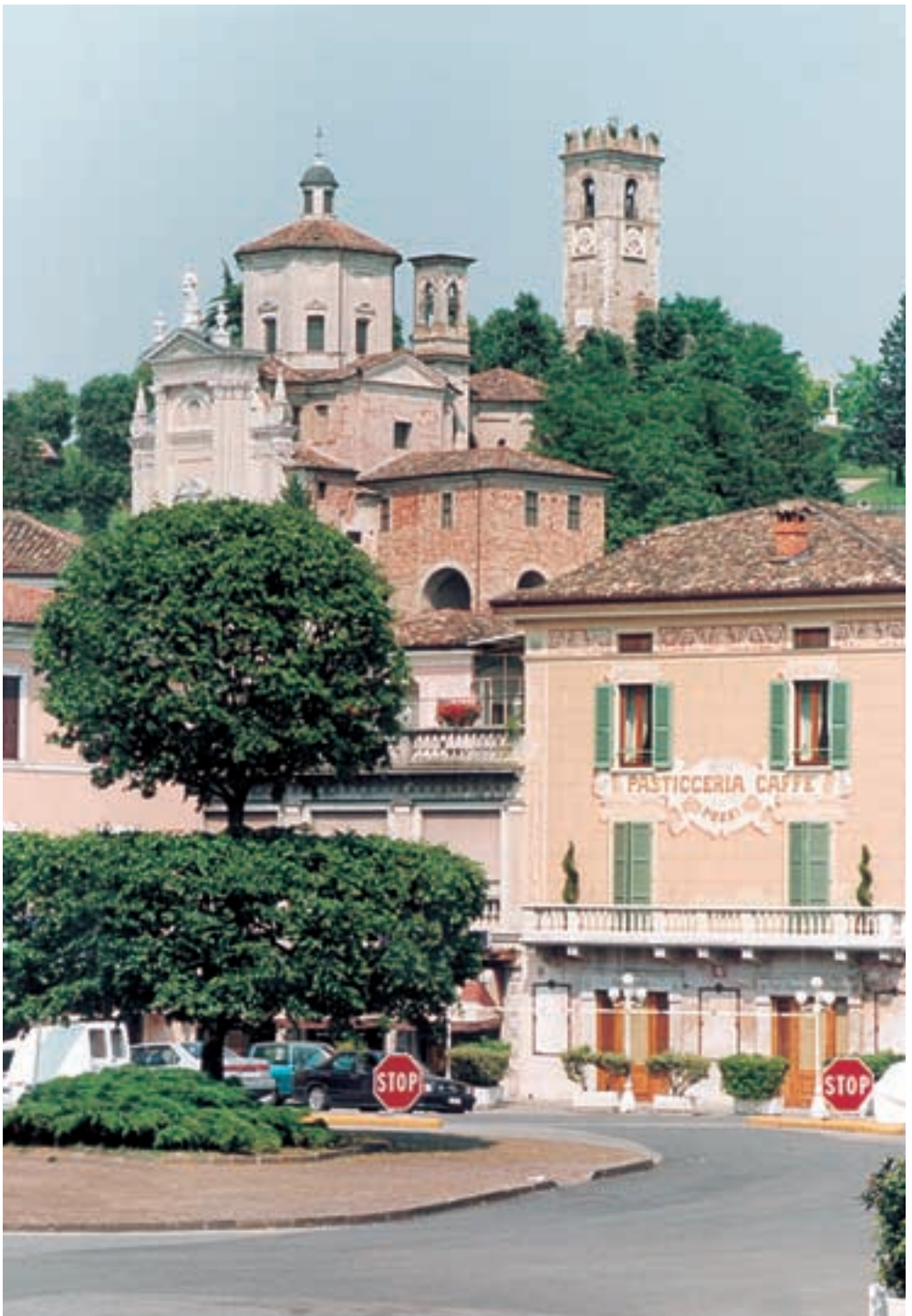
Il Santuario e La Torre Civica