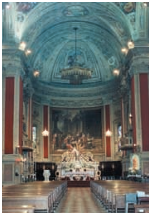
Interno della Chiesa di San Giovanni Battista