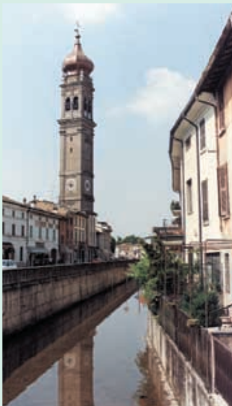
La Fossa Magna