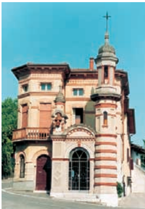
Chiesetta di Sant'Antonio

All'interno vi sono numerosi affreschi: Il passaggio delle chiavi della Chiesa da Gesù a S. Pietro (ignaro che S. Gottardo era pronto a sostituirlo nel cuore dei carpenedolesi!). Gli affreschi di S. Antonio da Padova, di S. Bernardino, della Vergine Maria, di S. Giovanni, di S. Pietro, di S. Antonio Abate. Inoltre l'affresco della Fuga in Egitto del 1474, che si scoprì all'epoca del ritrovamento della lapide, dipinto per il 500°