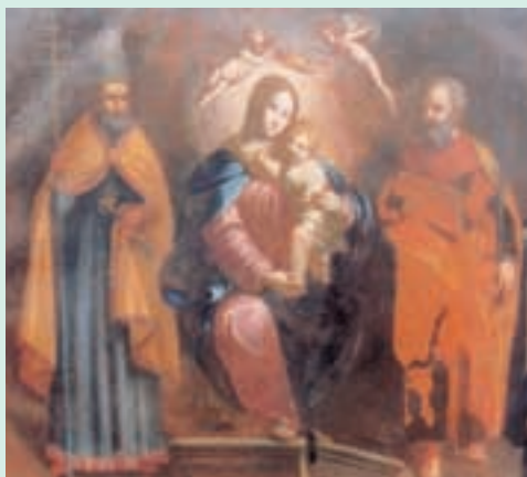
Pala dell'altare della Chiesa di San Pietro (da "Carpenedolo Nuova Storia" di Spada e Zilioli)

L'Ufficio relazioni per il pubblico dà informazioni sui