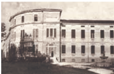
Il Palazzo Scolastico Comunale (da "Carpenedolo Nuova Storia" di Spada e Zilioli)