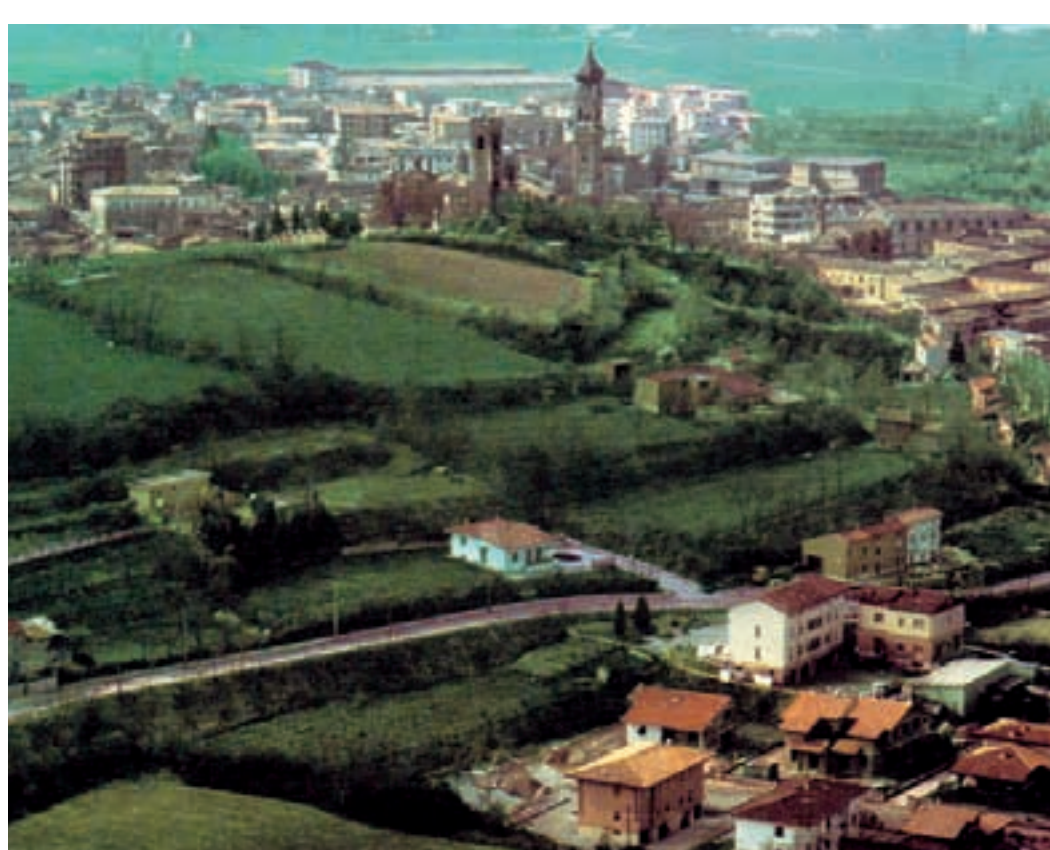
panoramica di Carpenedolo (da "Carpenedolo Nuova Storia" di Spada e Zilioli)

Nel progettare i giorni della Fiera, l'Amministrazione Comunale ed il Comitato Fiera, hanno voluto dare nuovamente risalto a "Sapore & Sapere", finestra aperta sulle tradizioni enogastronomiche della terra carpenedolese e di quelle zone d'Italia che hanno scelto la "piazzetta" della cittadina fieristica del paese dei Carpini per farsi cono-