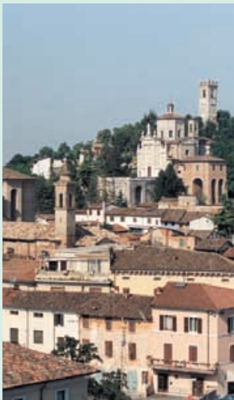
Panorama di Carpenedolo

Che sia definito il procedimento delle pubblicazioni