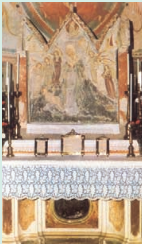
Altare con Affresco della Chiesa di Pieve (da "Carpenedolo Nuova Storia" di Spada e Zilioli)