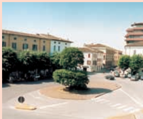
Piazza Europa