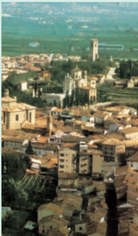
Vista aerea di Carpenedolo (da "Carpenedolo Nuova Storia" di Spada e Zilioli)

Iscrizione, cambio di residenza, smarrimento, cessazione, morte.