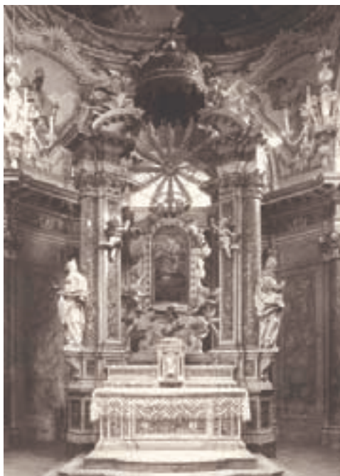
Altare Maggiore del Santuario del Castello (da "Carpenedolo Nuova Storia" di Spada e Zilioli)