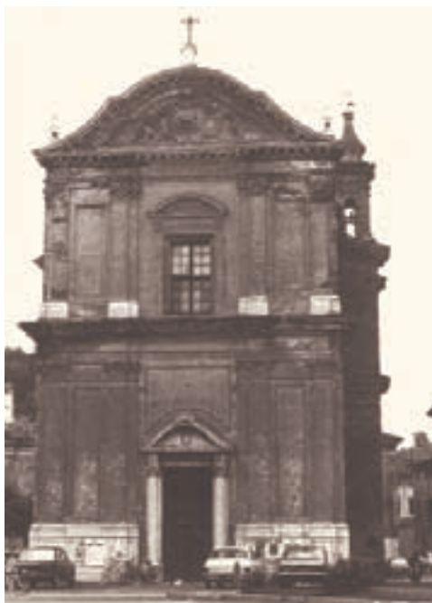
Chiesa di San Rocco (da "Carpenedolo Nuova Storia" di Spada e Zilioli)