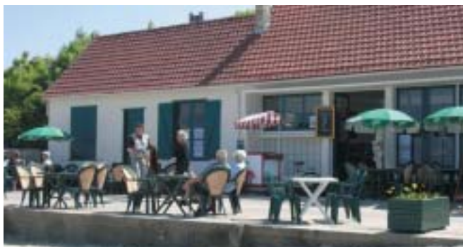
La Buvette de la Plage