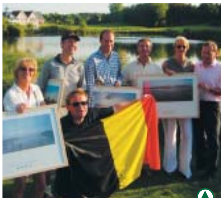
Les vainqueurs de la Course au Drapeau

Un exemple de manifestation qui montre la place que prend aujourd'hui le Golf de Belle Dune dans l'espace européen de la région grand Nord.