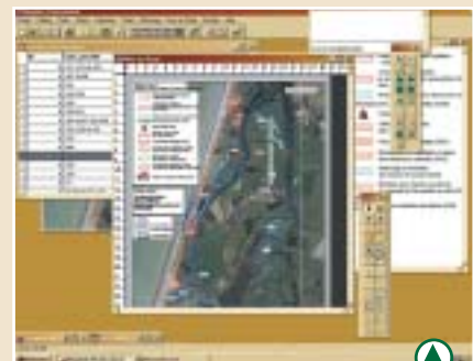
Le SIG, un nouvel outil informatique

Le Syndicat Mixte pour l'Aménagement de la Côte Picarde a décidé de s'équiper d'un *Système d'Information Géographique. Ce système permet d'unifier de nombreuses données (cartes, données terrain, cadastre,...) dans un système spatial géoréférencé. Dans un premier temps, il a servi à établir un diagnostic précis du territoire. Puis, dans un second temps, il permettra d'optimiser le suivi des 4 500 ha de milieux naturels gérés en partenariat avec le Conservatoire du Littoral.