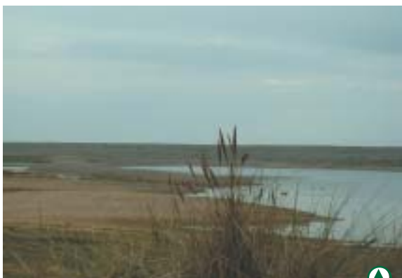
Le Hâble d'Ault

Pour pallier cette évolution et conserver la biodiversité de la réserve, des travaux de restauration ont été nécessaires. Ils ont consisté à enlever tous les végétaux autres que pionniers sur les îlots composés essentiellement de galets grâce à un extirpateur (les méthodes de fauche traditionnelle ne pouvant s'appliquer sur ce type de substrat).