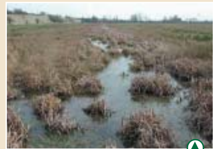
Le marais de Blanquetaque Beauvisage

Ils sont exécutés par l'entreprise SA REVET et ont démarré au mois d'octobre grâce au soutien financier du Conseil général, du Conseil Régional, du FEDER et de la SANEF.