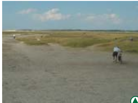
La pointe de Routhiauville

Si des actions importantes de restauration et d'entretien des milieux, où persistent de vastes dépressions humides originales, ont déjà été entreprises localement, la plus grande partie du complexe dunaire de l'Authie n'a jusqu'ici pas fait l'objet d'autant d'attention. Par ailleurs, disposer aujourd'hui d'un parcours de découverte et de parkings intégrés au paysage, certes de qualité, mais ne répondant pas aux problématiques actuelles du droit d'accès pour tous à la