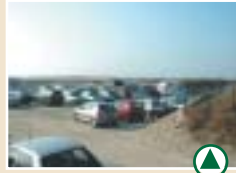
L'actuel parking de la Maye

Les études préalables à l'Opération Grand Site National préconisent d'une part le recul du parking de la Maye sur une parcelle située en arrière du trait de côte, et d'autre part, la