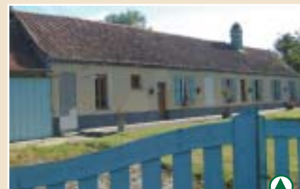
Une ancienne ferme typique