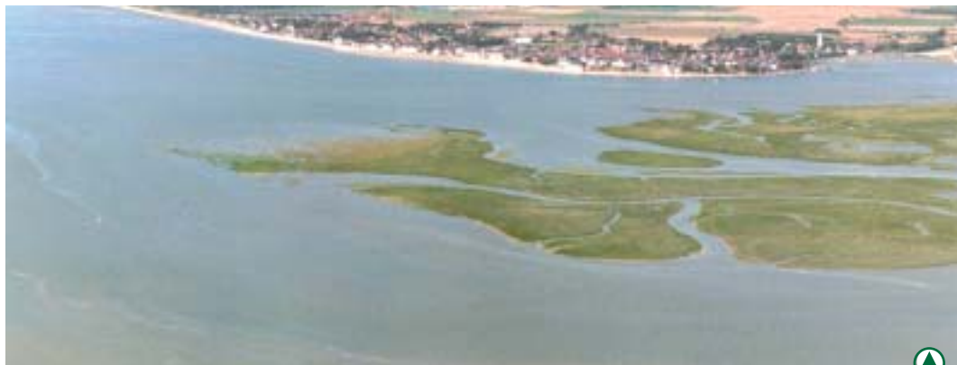
Entre terre et mer...

L'un des enjeux primordiaux du développement passe par une mise en commun des concepts et compétences entre les communes côtières et les communes rétro littorales. Rien n'est irrémédiable et les problèmes constatés pourront toujours trouver des solutions positives. L'Opération Grand Site National va nous offrir ce cadre de travail en englobant plus d'une trentaine de communes.