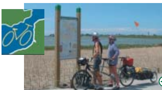
L'Europe à vélo

Le 15 mai 2005, le Syndicat Mixte pour l'Aménagement de la Côte Picarde organisera avec de nombreux partenaires, la première Fête du vélo de la Baie de Somme, dans un objectif de promotion des liaisons cyclistes et du Train-Vélo.