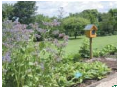
Agrandissement du Jardin des cinq sens réalisé grâce aux fonds européens

Le programme Interreg II (1999) a permis notamment aux Jardins de Valloires la création du jardin anglais Michelham. Le projet Interreg III vise à valoriser et rendre accessible à tous, les espaces naturels transmanche à travers des aménagements appropriés. On y développe une sensibilisation au respect de l'environnement.