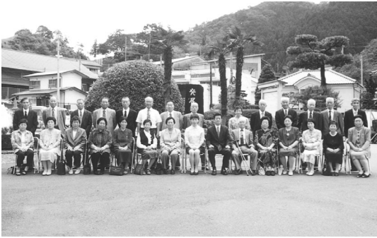
金婚式を迎えられたみなさん

九月一日、高知新聞社主催による「第47回金婚夫婦祝福式典」が須崎市で行われました。本町では、二十六組の方々が金婚式を迎えられ、お二人で力を合わせ苦楽を共に歩んでこられた五十年間の祝福を受けられました。台風十六号通過の直後で大変よい天気にも恵まれ、バス