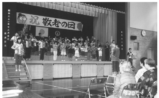
地域を挙げての祝福(四万川会場)