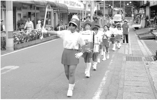
可愛く元気なパレードです

長からは、「運動会前の忙しいときありがとう。運動会には応援に行くからね」とお礼の挨拶がありました。