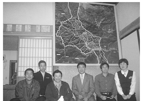
苦勞を重ね完成した小字図

菅住宅などが多く建築され、人の出入りが頻繁になっていきます。そこで、この地で暮らす住民同士が一体となれるよう、部落に脈々と受け継がれていた小字を調査することになりました。