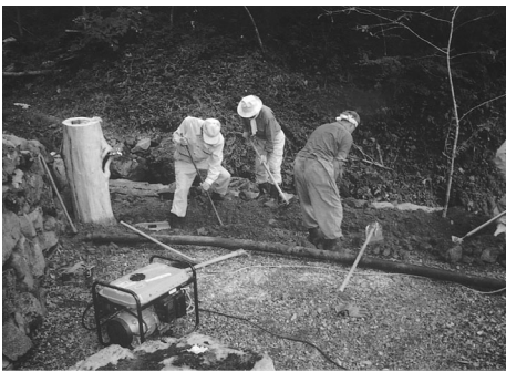
心の癒しとなる公園づくり

しかし、子安地藏尊周辺の敷地が狭く危険な箇所があるというところが問題点である他、国道四四〇号が改良され旧道を通らなくなったために子安地藏尊の場所が分かりづらいつつあることも、この事業で何とかできないかとの話し合いが行われました。