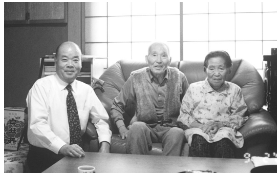
夫婦健康でいつまでもお元気で