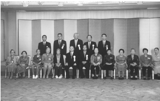
もうひとつの金婚式に参加のみなさん

九月八日、高知新聞創刊百周年、高知放送開局五十周年記念行事として、過去の戦争でご主人を亡くされた女性の労をねぎらう「もっひとつの金婚式」が高知市で行われました。梶原町からも四名の方が出席され「周囲の方々への支えがあったからこ