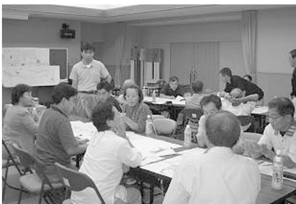
貴重なご意見、ご提言をいただきました

設計は、太郎川公園の「雲の上のホテル・レストラン」を設計した東京在住の隈研吾氏が、建築設計の傍ら慶応義塾大学の教授として勤務されており、その中で学生とともに研究しているサステイナブル生命建築(環境に配慮した建物)における研究開発の一環として総合庁舎を設計したいとの提案があり、埴原町が推進している環境の取り組みに合致するもので、慶応義