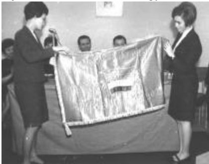
Szegedi Egyetem, 1968. március 23.