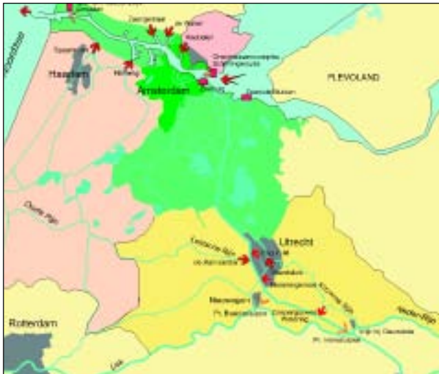
Gebied van de Amsterdam-Rijnkanaal-Noordzeekanaal-Amstel-Vechtboezem.

Zoals in elk poldergebied lozen de polders in Amstelland hun water op de boezem: het afwateringssysteem van rivieren, vaarten en kanalen. Dit systeem brengt het water