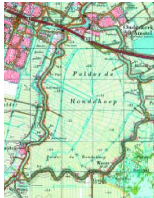
De huidige situatie. Een ongewijzigd kavelpatroon door de eeuwen heen.