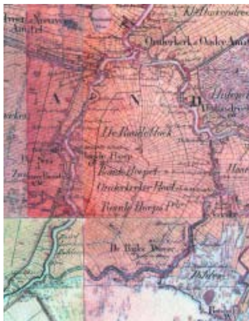
Kavelpatroon omstreeks 1850.

Cultuurhistorische waarden zoals de waaierverkaveling worden niet aangetast door inundatie. De stroomsnelheid van het ingelaten water zal laag zijn. Eventuele oevererosie is makkelijk te herstellen. Wat betreft monumentale bebouwing zal er enige schade kunnen ontstaan, maar die zal beperkt zijn door de hogere ligging van die gebouwen.