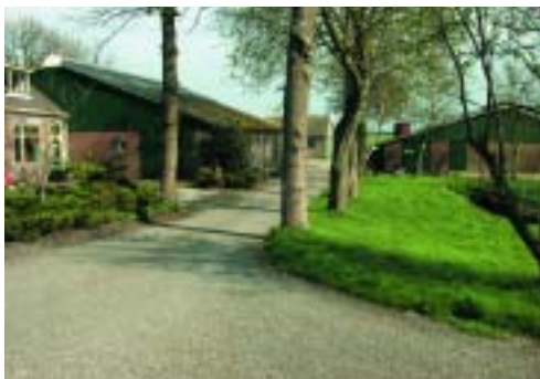
Boerderij tegen de dijk van De Ronde Hoep.

Wat betreft landschaps- en natuurwaarden scoort De Ronde Hoep hoog. De polder is het grootste open gebied (veenweidelandschap) in zuidelijk Noord-Holland. Met aan de zuidkant van de A9 een agrarische functie, en aan de noordzijde boven de A9 stedelijk gebied. Het reservaatgebied in het midden zal uitgroeien van 45 naar 170 ha. De polder is van belang voor doortrekkende en overwinterende ganzen, zwanen, eenden, steltlopers en andere weidevogels. Het is een vis- en amfibieerijk gebied.