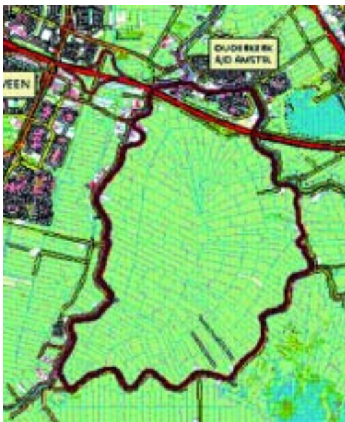
De polder De Ronde Hoep. De polder omvat landelijk stedelijk gebied ten zuiden van de snelweg A9 en stedelijk gebied ten noorden van de A9. Totaal 1266 ha.

Indien van tevoren beschermende maatregelen worden genomen (aarden kade rond de bebouwing, damwanden of mobiele keringen) is het aantal getroffen inwoners nihil, maar zijn de inrichtingskosten hoger. Ook voor Wilnis Veldzijde (70 inwoners) zijn de maatregelen voor gecontroleerde inlaat en beschermende maatregelen voor bebouwing aanzienlijk hoger.