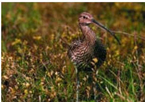
De wulp; een kritische soort die in De Ronde Hoep z'n plaats vindt.

De schade voor de landbouw is verwerkt in de cijfers voor de overstromingsschade. Deze zijn belangrijk onderdeel van het rapport. Rekening is gehouden met zowel boerderijen als de productiegrond. De gevolgen van korte inundaties zijn relatief beperkt. Nadelen worden groter naar mate inundatie meer in het groeiseizoen plaatsvindt. Flink aandachtspunt blijft de schade die kan ontstaan als gierkelders onder de boerderijen onderlopen en vermestende stoffen in het water terecht komen en zich over de omgeving verspreiden. Ook de verspreiding dieselolie uit opslagtanks kan grote gevolgen hebben. Over deze zaken zijn echter geen ervaringscijfers beschikbaar. Het rapport geeft vooral kwalitatieve beschrijvingen van natuur en cultuurhistorie.