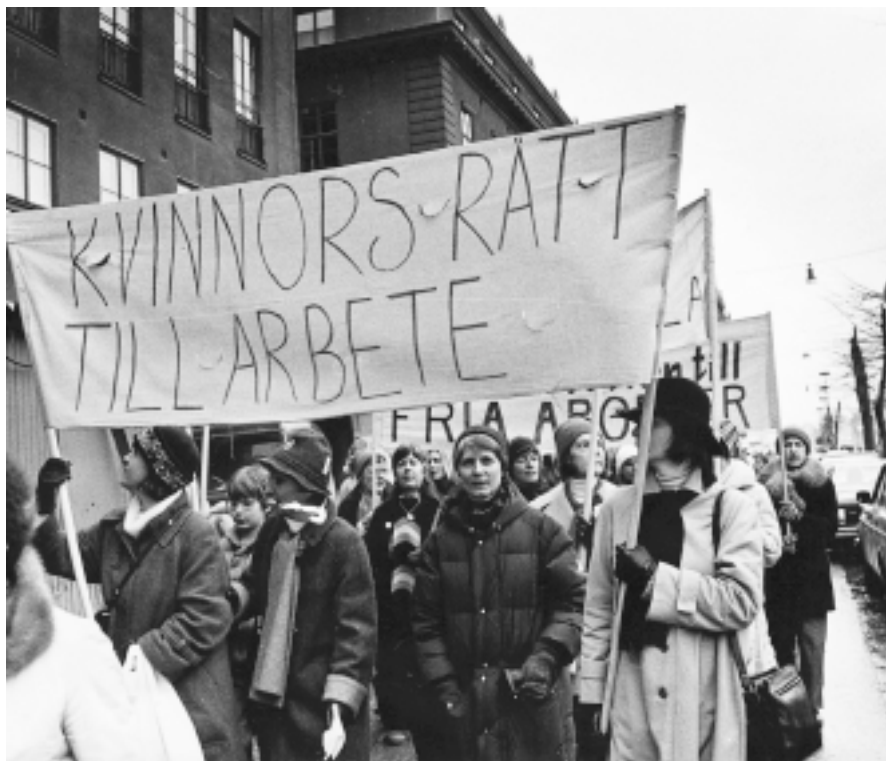
Rätten till arbete och till ekonomiskt oberoende är en central del av en feministisk politik.

Ett metodiskt arbete krävs för att synliggöra och motverka de patriarkala strategier som befäster mäns makt i samhället över kvinnor. Det finns egentligen ingen fråga där de kvinnopolitiska aspekterna kan lämnas åt sidan. Ekonomisk politik, socialpolitik, familjepolitik, arbetsmarknadspolitik, integrationspolitik, flyktingpolitik, folkhälsopolitik, kulturpolitik, handelspolitik, miljöpolitik, freds- och säkerhetspolitik, allt måste belysas och behandlas ur ett feministiskt kvinnopolitiskt perspektiv, det vill säga ett könsmaktperspektiv.