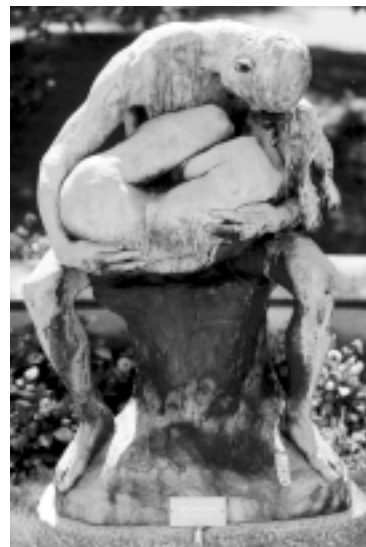
Inte bara klassamhället utan också köns-maktrelationerna måste ideologiseras, ges en acceptabel form och innebörd. Så omvandlas den härskande mannen till den beskyddande mannen och den undertryckta kvinnan till den värnlösa kvinnan, som i denna skulptur av Gustav Vigeland.

Jämställdhetsarbete ska bedrivas feministiskt. Då först blir det någon me-