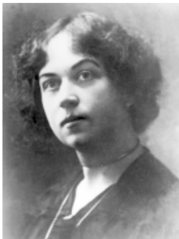
Aleksandra Kollontaj (1872–1952) rysk revolutionär politiker, författare och diplomat; Sovjetunionens ambassadör i Stockholm 1930–45.

Aleksandra Kollontaj vidareutvecklade dessa tankegångar. Hon menade att den arbetsplikt för både kvinnor och män som infördes i Sovjetunionen 1921 i grunden skulle förändra förhållandet mellan könen. Men det var inte tillräckligt. Ytterligare en viktig förutsättning var organiseringen av hemarbetet och barnuppfostran i det socialistiska samhället. Kollontaj tog fasta på kvinnorna ”som bärare av det kommande släktet”. Moderskapet var därför en angelägenhet för kollektivet och staten.