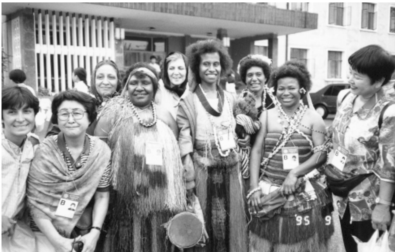
Några av delegaterna på FN:s kvinnokonferens i Peking 1995. Konferensen slog fast att "kvinnors rättigheter är universella och odelbara".