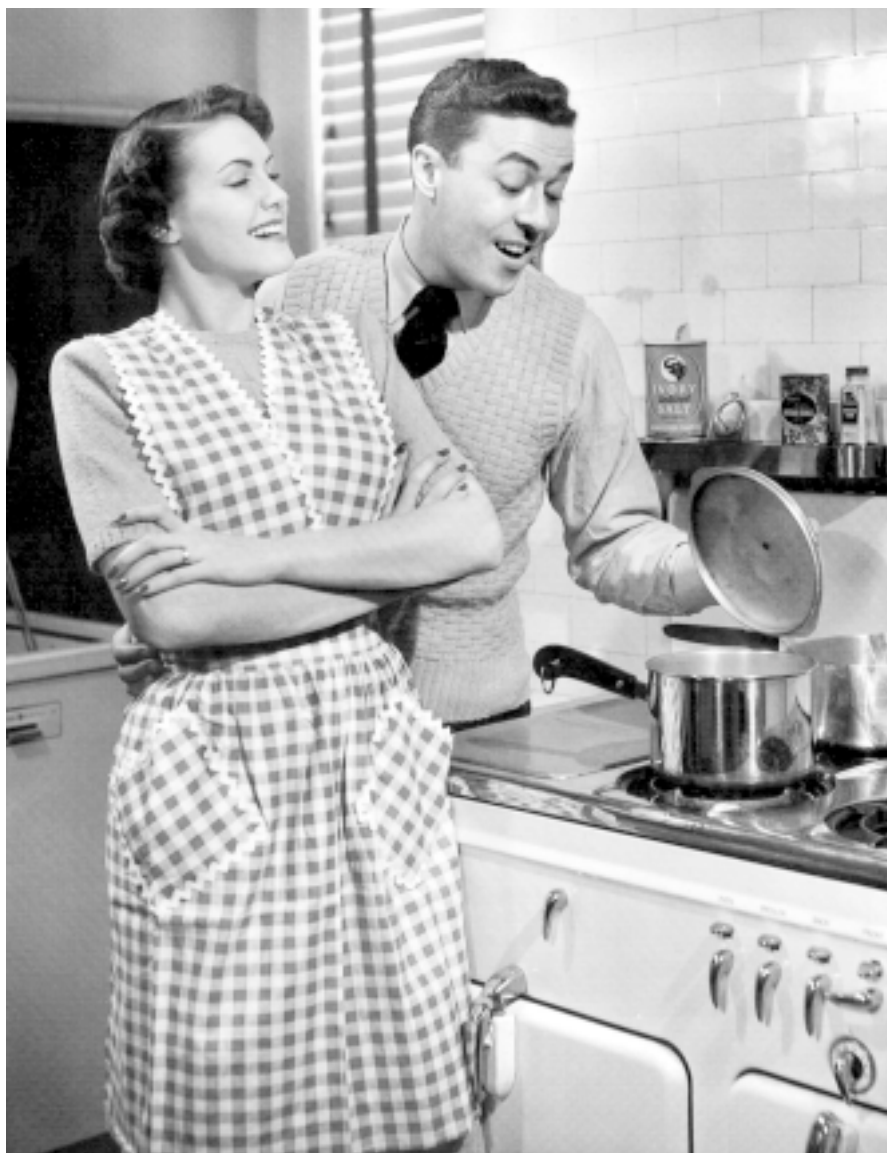
Könsroller eller maktrelationer?