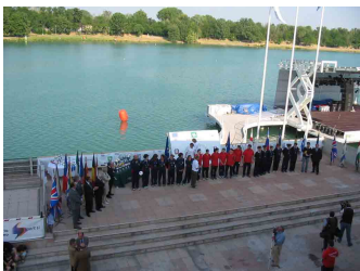
Veduta dall'alto delle premiazioni all'IdroparkFila

Brandirali e dai membri dell'ISF, si sono svolte esibizioni e gare di nuoto, canottaggio, corsa e bicicletta. La festa dello sport si è quindi conclusa con il passaggio di consegna dei Giochi e il buffet per autorità e atleti presso la Lega Navale.