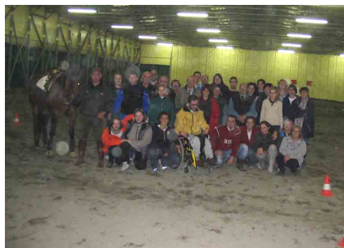
Gli istruttori, i ragazzi e i volontari dell'Aver

Aveva ragione Shakespeare quando diceva "Vi sono più cose in cielo e in terra, Orazio, di quante se ne sognano nella vostra filosofia".