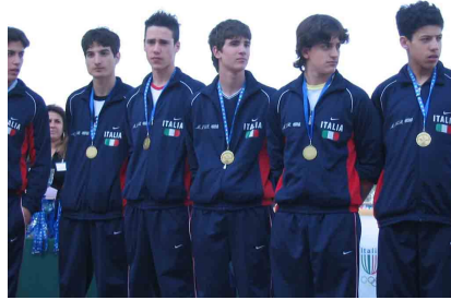
L'oro alla nazionale italiana maschile di nuoto