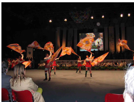
La spettacolare esibizione degli sbandieratori