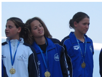
La nazionale femminile israeliana di nuoto