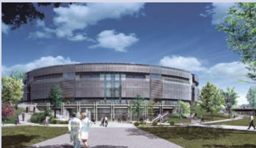
Na granicy Gdańska i Sopotu