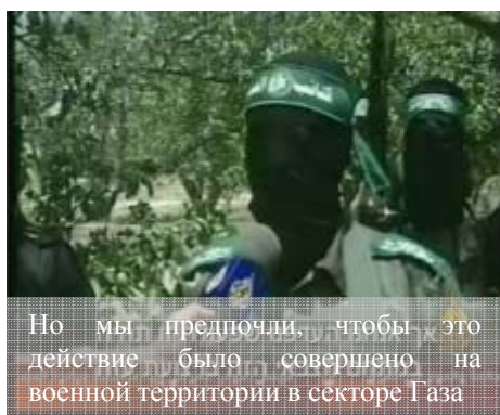
Представитель "Батальонов мучеников Эль-Акса" восхваляет проведение теракта (телевидение "Аль-Джазира", 25 июня)