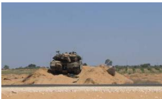
Пострадавший в результате обстрела танк сил ЦАХАЛа