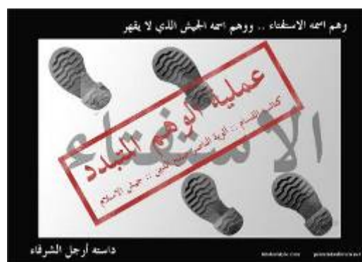
Плакат под заголовком "Рассеявшаяся (израильская) иллюзия", опубликованный на интернет-сайте ХАМАСа сразу же после теракта