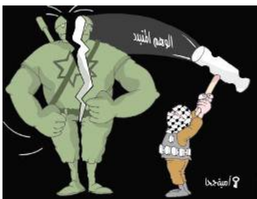
Карикатура Омайи Джоха, опубликованная на интернет-сайте ХАМАСа сразу же после теракта. На картинке изображен палестинец (с кафией на голове и с зарядом взрывчатки на поясе), разбивающий взрезбги израильского великана.