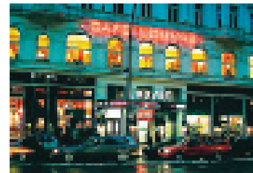
Café Louvre har gamla anor. Här hängde Kafka och Einstein.