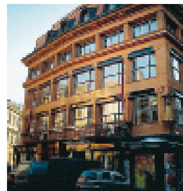
Dum u Cerne Matky Bozi är världens första kubistiska hus.