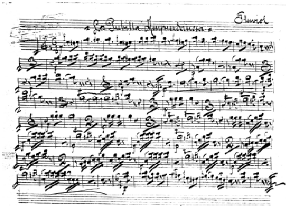
Particel·la de "La pubilla empordanesa" autògrafa del seu autor. No porta data, però el segell la localitza a Peralada. És, doncs, anterior a 1910 i, possiblement, fins i tot a 1905.