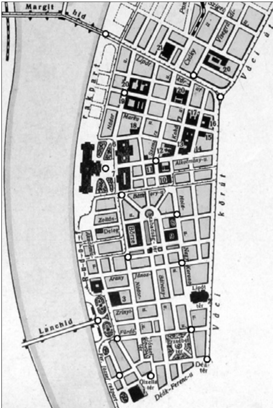
A rendőr őrszemek elhelyezkedése a főváros pénzügyi központjában, az V. kerületben, 1904.