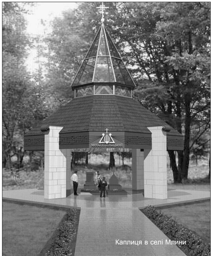
Каплиця в селі Млини