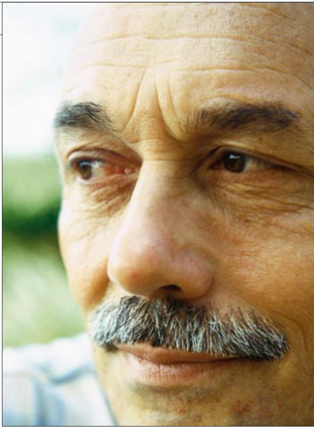
'De GroenLinks-stemmer heeft geen idee wat er achter de schermen speelt.'

In 1986 verkocht Siebelt zijn beveiligingsbedrijf voor een flinke bom duiten en ging hij zich volledig richten op het detectivewerk. Hij adviseerde multinationals die werden geplaagd door gewelddadige aanslagen van links-extremistische groepen. En ontdekte meer kuiperijen. Bij de kerken, bij de vakbeweging. "Ondernemingsraden van grote bedrijven werden misbruikt door linkse partijen om gevoelige informatie te vergaren. De gegevens werden doorgespeeld naar actiegroepen, die er vervolgens hun voor-