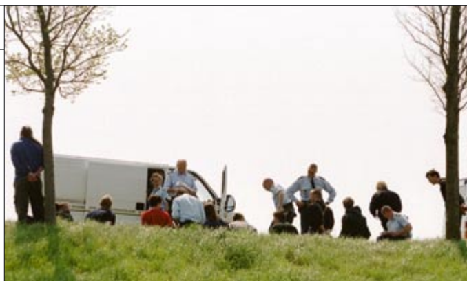
Onkruid-activisten op weg naar Borssele worden gearresteerd, 9 mei 2001