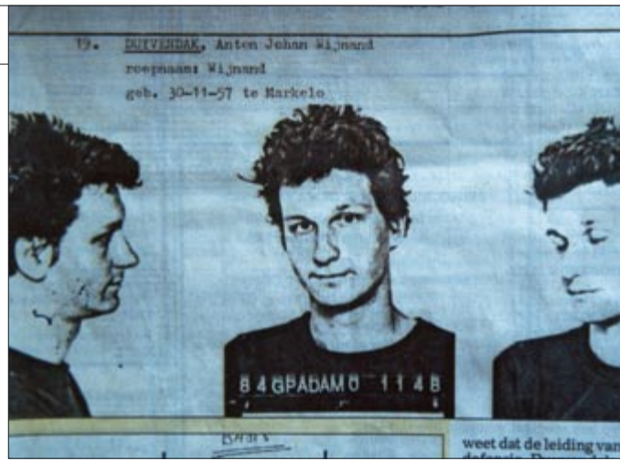
Politiefoto's van Tweede-Kamerlid van GroenLinks Wijnand Duyvendak