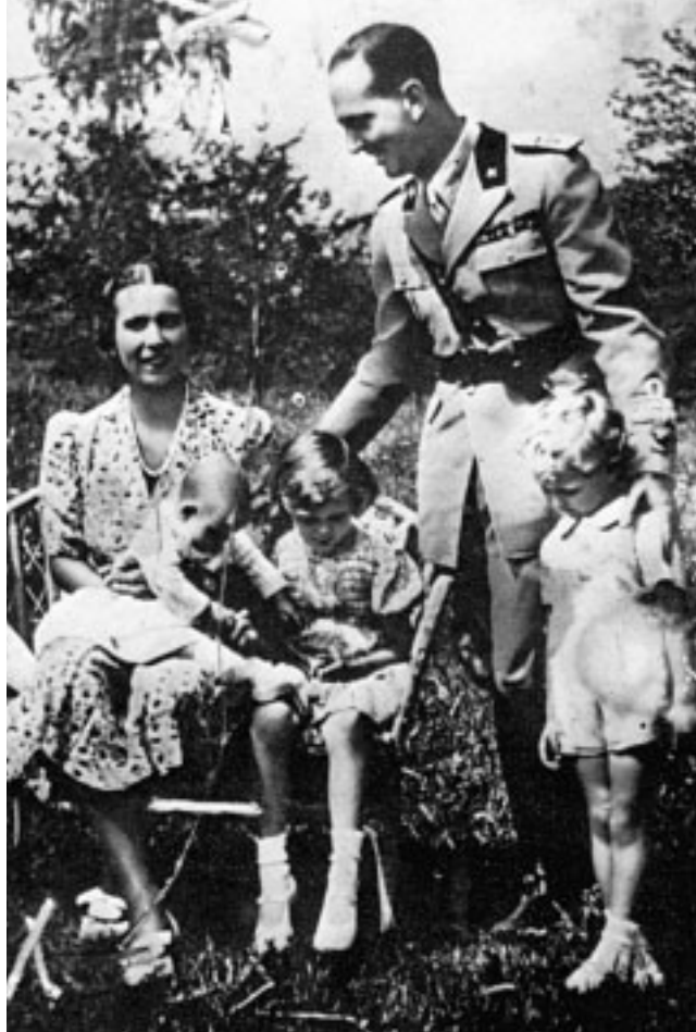
12. Umberto di Savoia con la moglie Maria Jose, in posa con i figli nei giardini del Quirinale. Sta per iniziare la campagna elettorale per la scelta tra Repubblica e monarchia. Il principe ci tiene molto ad apparire come un buon padre e un buon marito. Insomma, anche lui "tiene famiglia" ma vuole che la cosa sia ben documentata.