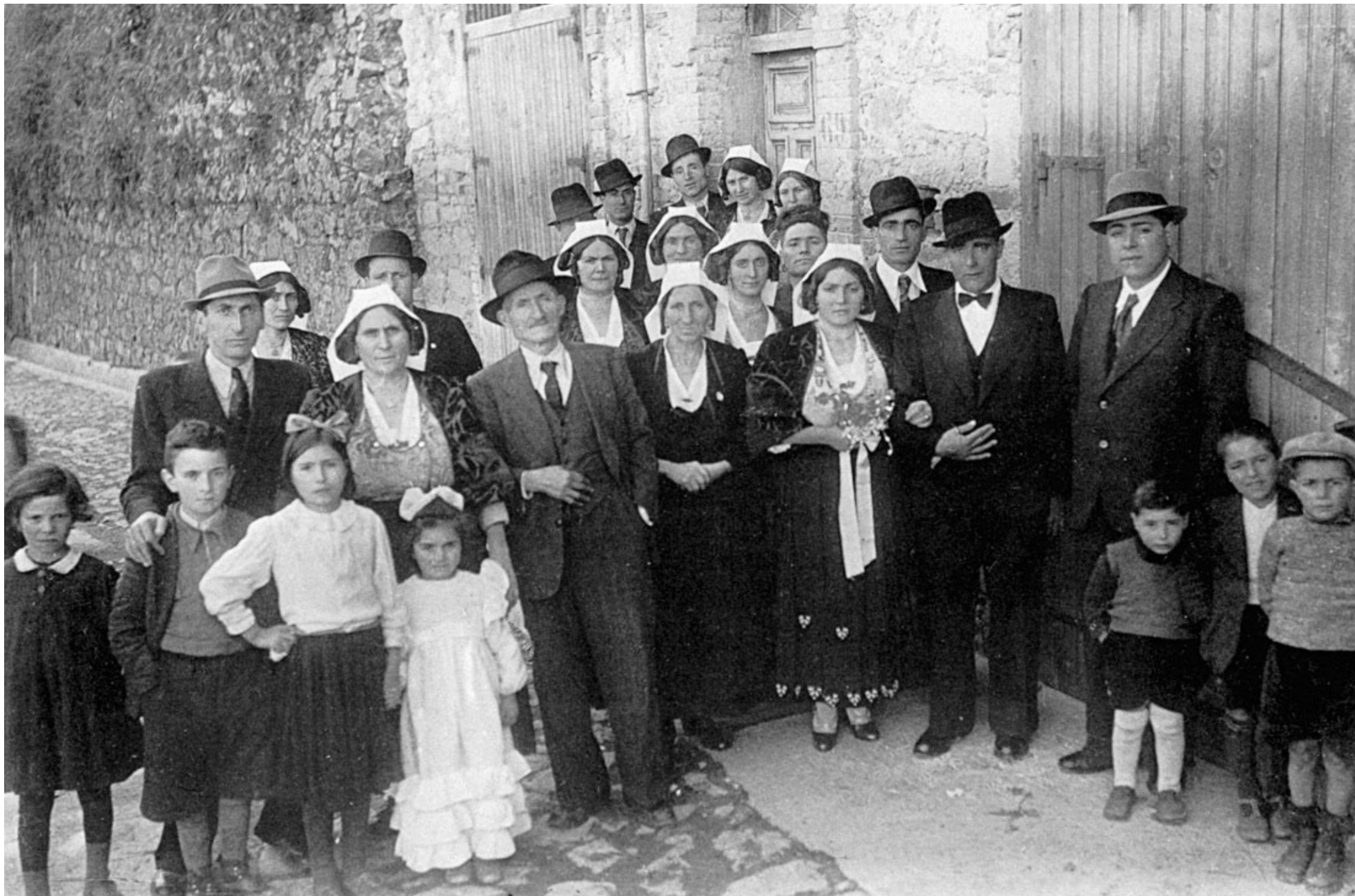
20. La splendida fotografia di un matrimonio, ripresa da Saverio Marra, un grande fotografo di San Giovanni in Fiore, in Calabria, nel 1940. La sposa è quella con il mazzolino di fiori (anzi di confetti) in mano. Alla sua destra i genitori.