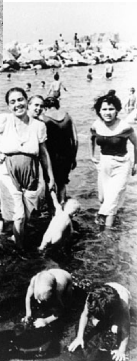
19. Madri e figli al mare a Napoli. La foto venne scattata, nel 1948, dal grande fotografo dell'agenzia "Magnum" Kim Seymour.