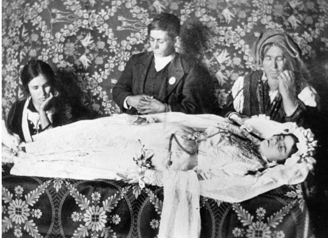
14. Ed ecco una foto terribile recuperata in Calabria dagli operatori di una équipe di ricerche etnografiche. Siamo nel 1920. Una delle figlie è deceduta e i congiunti la vegliano in casa, dopo averla rivestita con l'abito e i gioielli della comunione e sistemata su un catafalco.