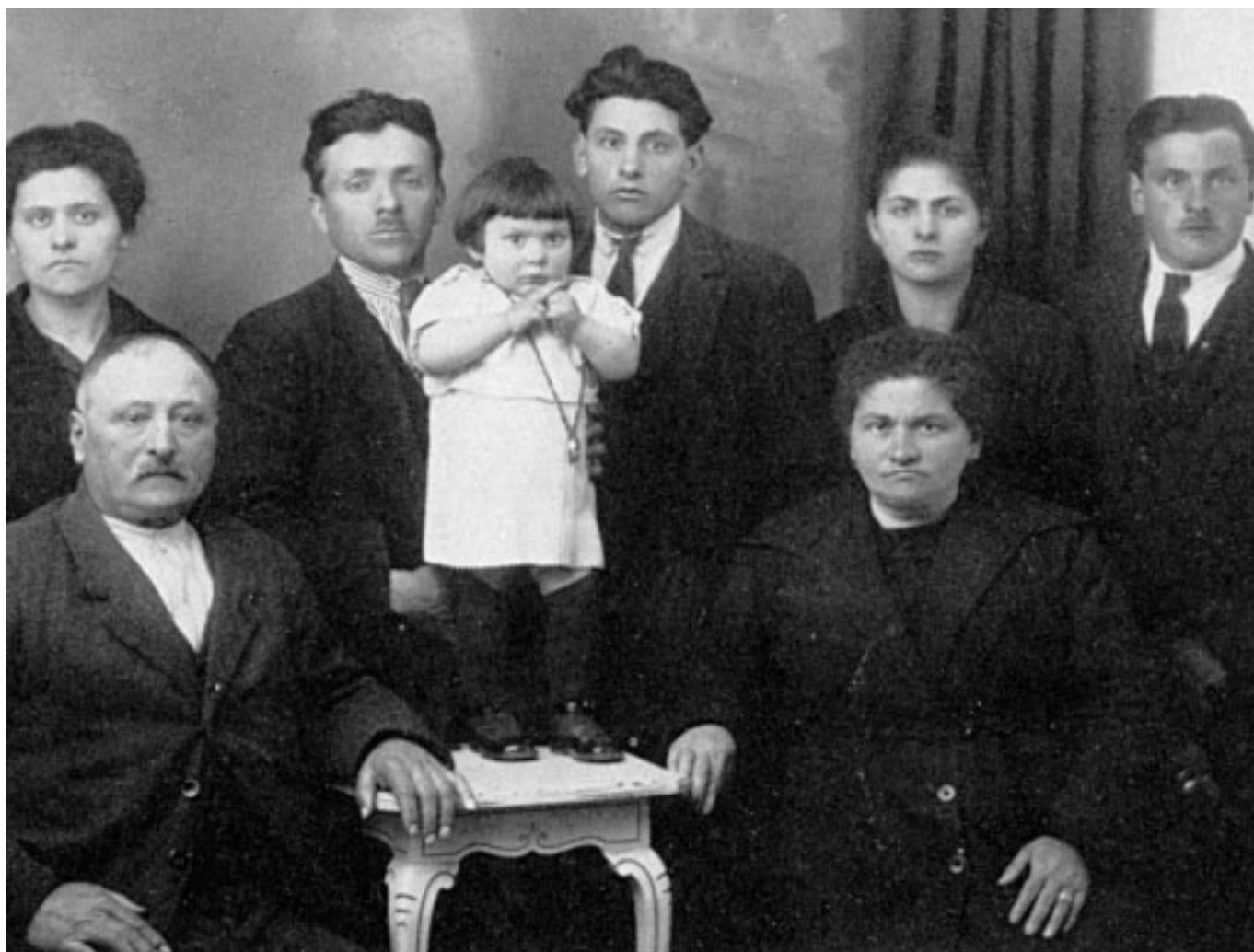
17. Fotografia di tutta la famiglia al completo. Siamo nel 1930 circa. Lo studio di ripresa è quello di un fotografo professionista. La famiglia è di modeste condizioni sociali. La bambina sul tavolinetto è davvero spaventata dalla macchina fotografica e dalla situazione. L'operatore è ignoto e anche la famiglia non ha un cognome.