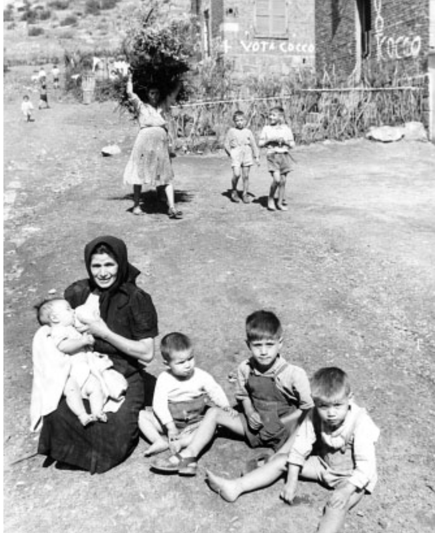
18. Siamo a Carbonia nel 1956 circa. Una madre con i figli ripresa al sole mentre allatta l'ultimo nato.