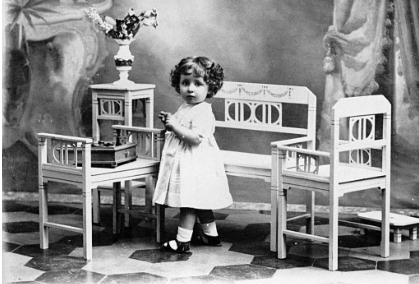
7. Bambina ignota e fotografo ignoto. Siamo, probabilmente, negli anni '30. La creatura è stata messa in posa in uno studio bene attrezzato. C'è lo sfondo pittorico di buon livello, il vaso con i fiori falsi e soprattutto le sedie per arredare e far sedere i clienti. Sullo sgabello è stato posato un qualcosa: forse un carillon per tenere tranquilla la bimba che appare ben vestita e pettinata alla perfezione.