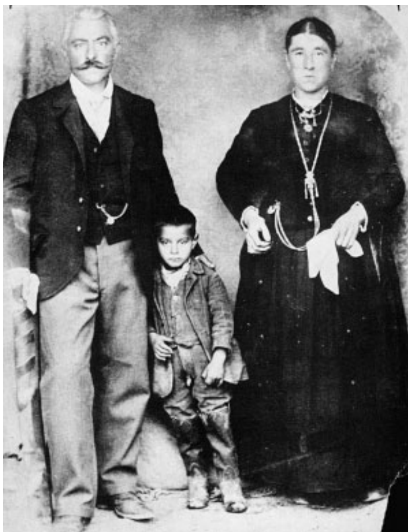
8. Questa è una fotografia davvero straordinaria. Madre e padre, gente di campagna, ma piuttosto ricca, si sono messi in posa con il loro figlio. Non si tratta di una "posa" per ricordo, ma per una precisa documentazione legale. Forse per una eredità. Il povero bambino, infatti, è stato costretto a farsi ritrarre con il microscopico sesso fuori dai pantaloni. Tutto per dimostrare che è un maschio. Insomma, il figlio maschio della famiglia. Oggi, la cosa pare assurda e provoca il riso, ma allora non c'era proprio niente da ridere. La foto dovrebbe risalire agli inizi del '900.