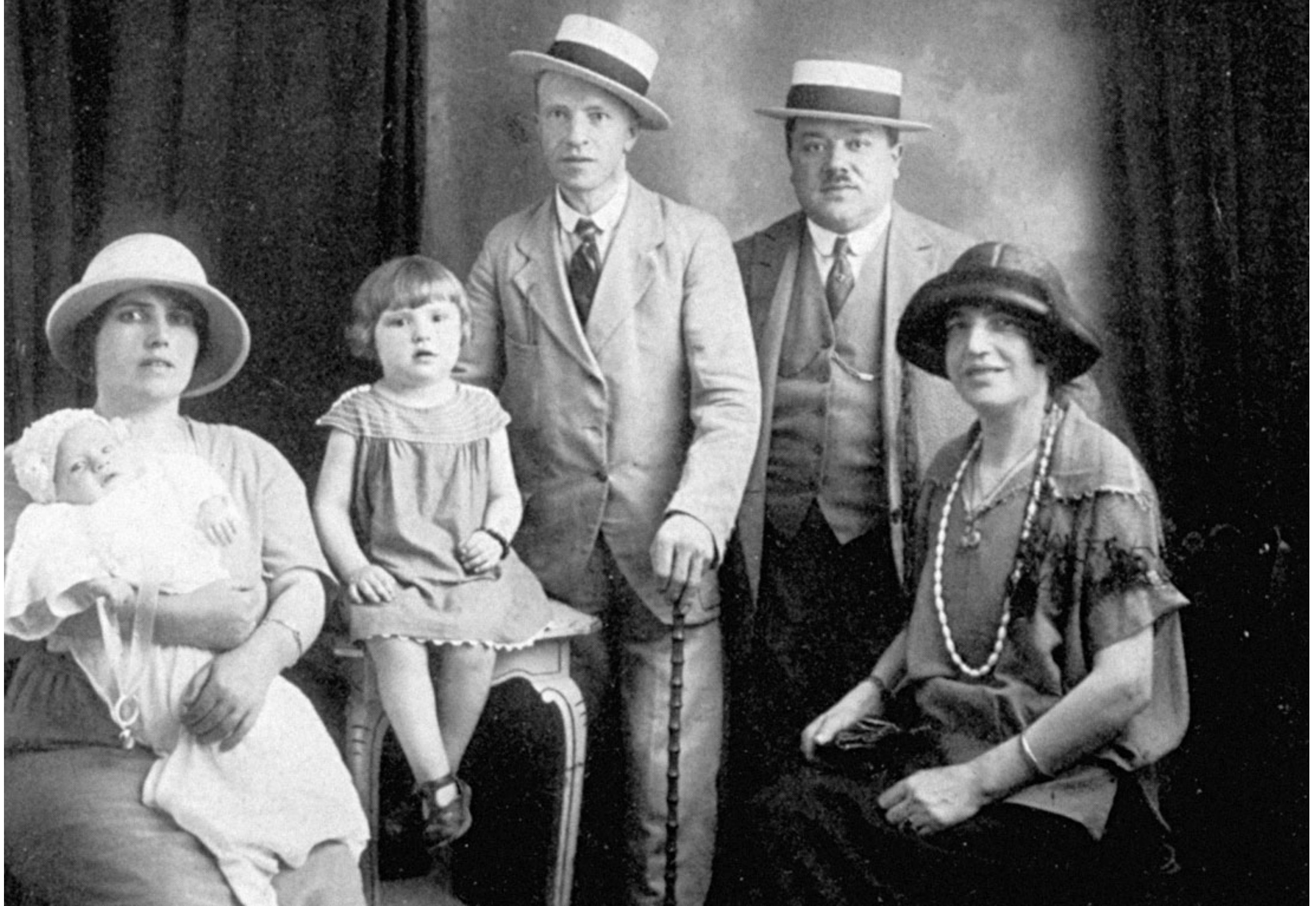
11. Famiglia benestante nello studio di un fotografo professionista. Siamo nel 1930 circa. I due genitori sono all'estrema destra. Al centro il figlio e all'estrema sinistra la moglie dello stesso figlio con una creatura in braccio. Insomma tre generazioni riunite insieme.