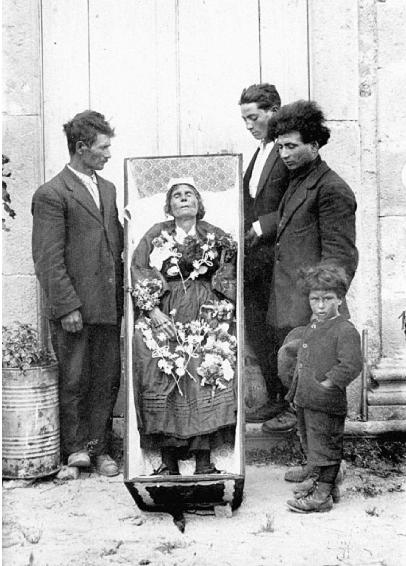
21. Saverio Marra fu uno straordinario fotografo calabrese che operò tra San Giovanni in Fiore e Castelsilano dal 1914 al 1946. Il fondo Marra comprende duemila eccezionali fotografie di tradizioni e usi popolari. A Marra, nel 1984, venne dedicata a Roma, a Palazzo Braschi, una grande mostra curata da Francesco Faeta. Ecco una delle più conosciute foto di Marra: è una contadina appena deceduta e ripresa nella cassa da morto che è quadrata come quelle di tutti i poveri. I familiari intorno, hanno i capelli spettinati in segno di lutto. Le foto di Saverio Marra sono la precisa e inequivocabile testimonianza di antichissimi riti e tradizioni popolari. La foto è stata scattata nel 1930.