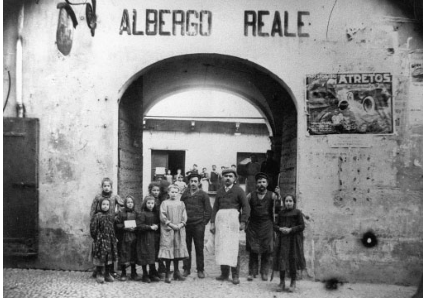
5. Qui siamo a Revello nel 1925. Il proprietario dell'albergo Reale (prima categoria, 10 camere) al centro, si è messo in posa con i figli e un aiutante. Sullo sfondo, il personale in posa. Uno regge un cartello non identificabile. Anche una delle bambine a sinistra ha in mano un foglio con scritto qualcosa.