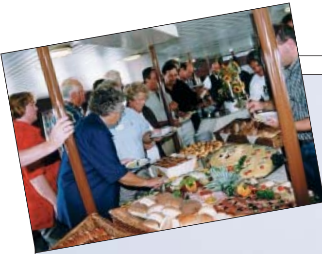
Lunch aan boord van de 'Stortemelk'.