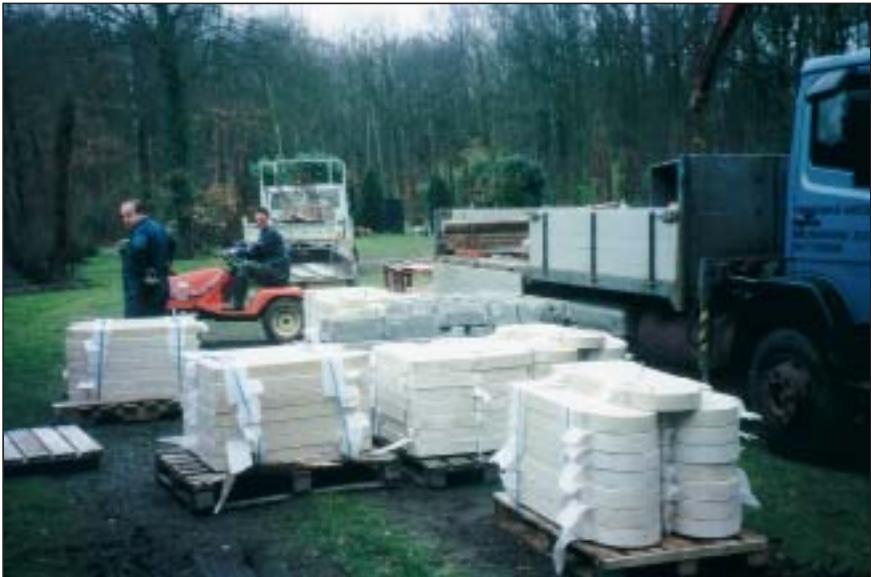
Aflevering van de nieuwe grafstenen op het ereveld Orry-la-Ville.

Onder grote belangstelling vond op 25 mei een korte plechtigheid plaats op het Nederlandse ereveld bij Orry-la-Ville. Aanleiding hiervoor was de voltooiing van de renovatiewerkzaamheden. In het kader hiervan werden 113 grafstenen vervangen door nieuwe exemplaren en werden het ereportaal, de toegangspoort en de bankjes in bijpassende kleuren overgeschilderd. De verwijsborden langs de weg werden evenals de vlaggenmasten op het ereveld, vernieuwd. Ook werd de kleine sokkel onder het standbeeld van 'de vallende man' vervangen door een groter, proportioneel beter passend, exemplaar. Op plantkundig gebied vond eveneens een aantal aanpassingen plaats. Bij de plechtigheid was de prefect van het departement l'Oise, de heer A. Gehin, aanwezig en ook diverse andere autoriteiten waaronder de Nederlandse ambassadeur, mr. C.R. van Beuge, en de burgemeester van Orry-la-Ville. Daarnaast waren er oud-strijders met een vaandelwacht, nabestaanden en belangstellenden terwijl een militaire kapel de muzikale ondersteuning verzorgde. De Oorlogsgravenstichting werd vertegenwoordigd door haar vice-president, de heer H.I. Tros,