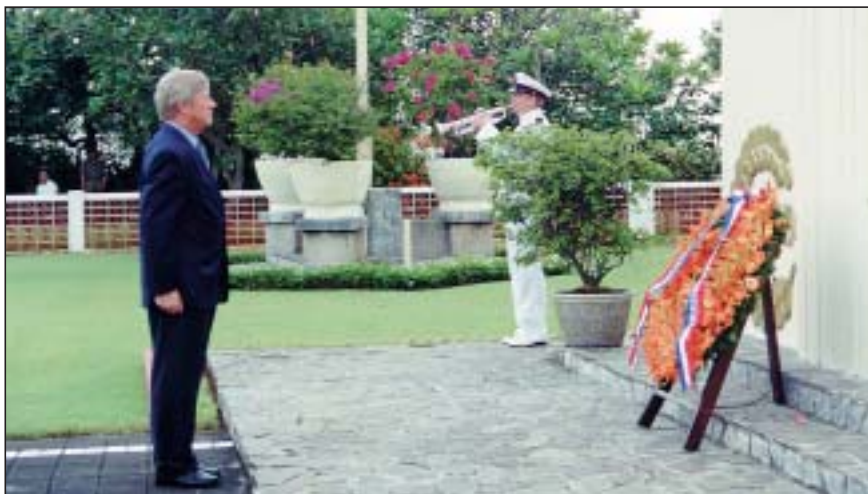
Kranslegging door de Nederlandse Ambassadeur op het ereveld Ancol (4 mei 1999).