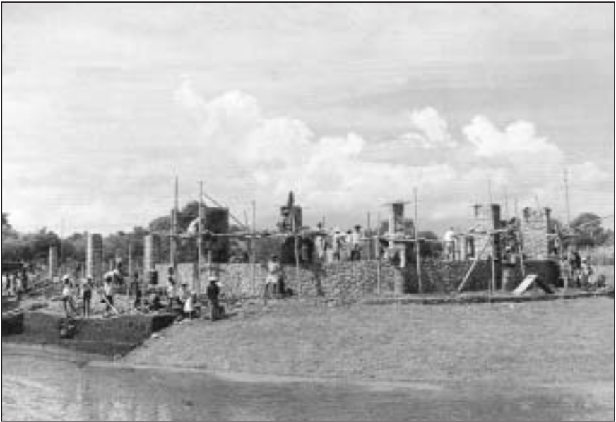
De aanleg van het gedeelte waar later het vrouwenmonument zou worden geplaatst.