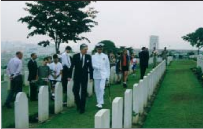
Kranji War Cemetery (5 mei 1999).