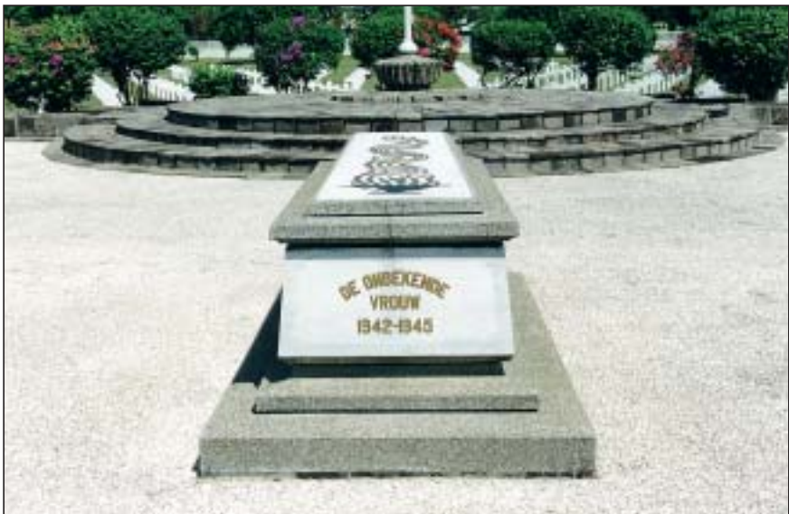
De tombe voor de Onbekende Vrouw en het vlaggenmonument.

Rondom het platform is een breed voetpad dat met de tophoek van het ereveld verbonden is door een zuilengalerij met twee voetpaden. Aan het begin daarvan ligt een gedenkplaat met de tekst: “Ter eerbiedige nagedachtenis aan de