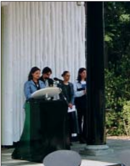
Declamaties door leerlingen van de Koninklijke Scholengemeenschap Apeldoorn.

Niemand naast me, voor of achter vrijheid is met niemand iets te maken hebben. Ja toch? Niet dan?"