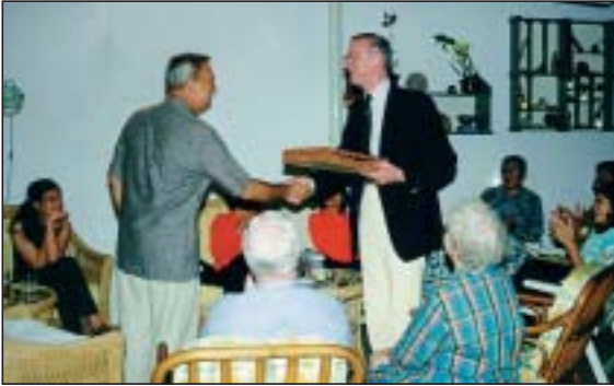
In aanwezigheid van de kantoormedewerkers overhandigt de directeur Indonesië een afscheids- cadeau aan de presi- dent.

opgeveegd en worden de vijvers en grachten regelmatig schoongemaakt en ontdaan van snel groeiende waterplanten. Met name op de erevelden Ancol en Kalibanteng is dat, vanwege de lengte van de grachten, een langdurig karwei. Al deze routine werkzaamheden zijn erop gericht om het ereveld op elke willekeurige dag in een zo goed mogelijke staat van onderhoud te hebben.