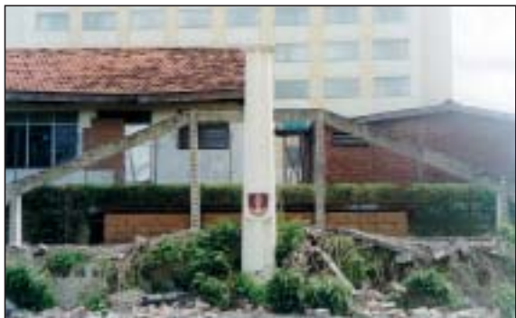
De ravage bij het monument van de 7 December Divisie.

Op 9 december woedde boven Jakarta een onweersbui gepaard met hevige windstoten. De windstoten waren zo heftig dat de begroeide roostermuur achter het monument voor de 7 December Divisie spontaan uit zijn betonnen sponning werd geblazen. De ravage was aanzienlijk. Inmiddels is de schade weer hersteld.