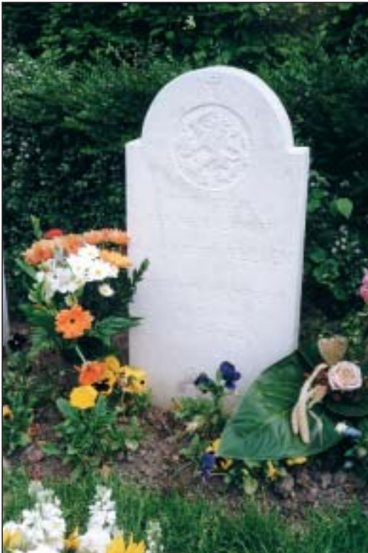
De nieuwe steen op het graf van A.J. van der Velden.

Nadat op 12 april zijn stoffelijke resten weer waren begraven heeft de stichting op zijn graf een nieuwe steen geplaatst met zijn personalia. Dat de nabestaanden van dit slachtoffer na bijna zestig jaar in de gelegenheid konden worden gesteld om bloemen op het graf van hun dierbare te plaatsen, geeft onze stichting grote voldoening.