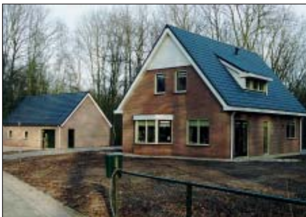
De nieuwe dienstwoning en werk-schuur bij het militair ereveld Grebbeberg.

De bouw van de nieuwe werkplaats en dienstwoning bij het militair ereveld Grebbeberg is voorspoedig verlopen.