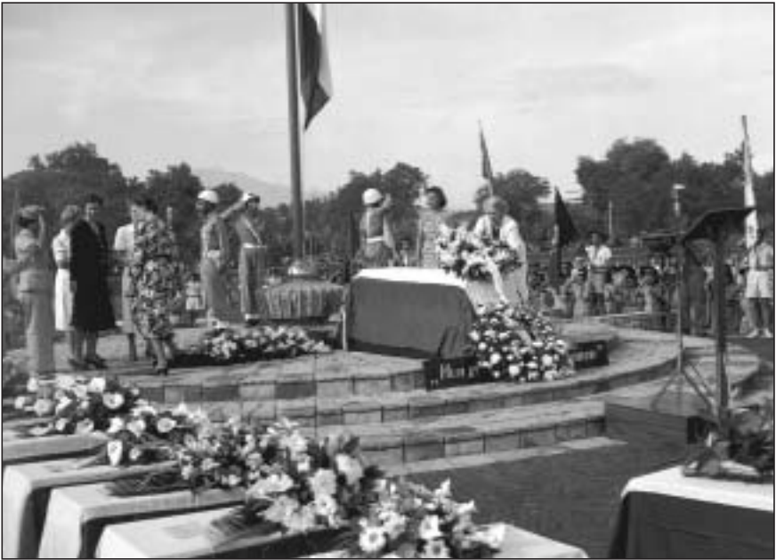
De openingsceremonie van het ereveld Kalibanteng op 22 april 1949.