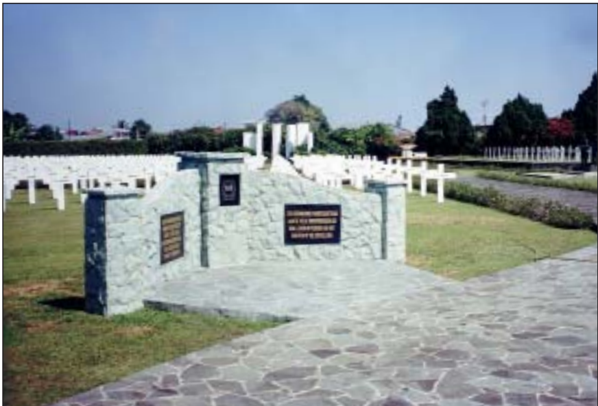
Het monument voor de oorlogsslachtoffers zonder graf op het ereveld Pandu te Bandung.

De jaarlijkse herdenking onder auspiciën van de Oorlogsgravenstichting wordt gehouden op 4 mei. Aanvang 14.00 uur. Voorafgaande aan deze plechtigheid vindt om 11.30 uur een oecumenische dienst plaats in de kapel.