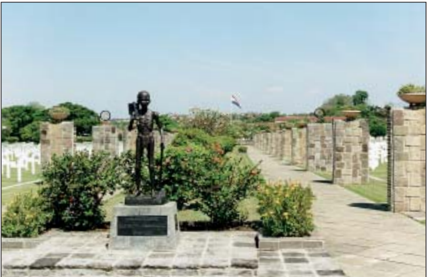
Het monument voor de Jongenskampen