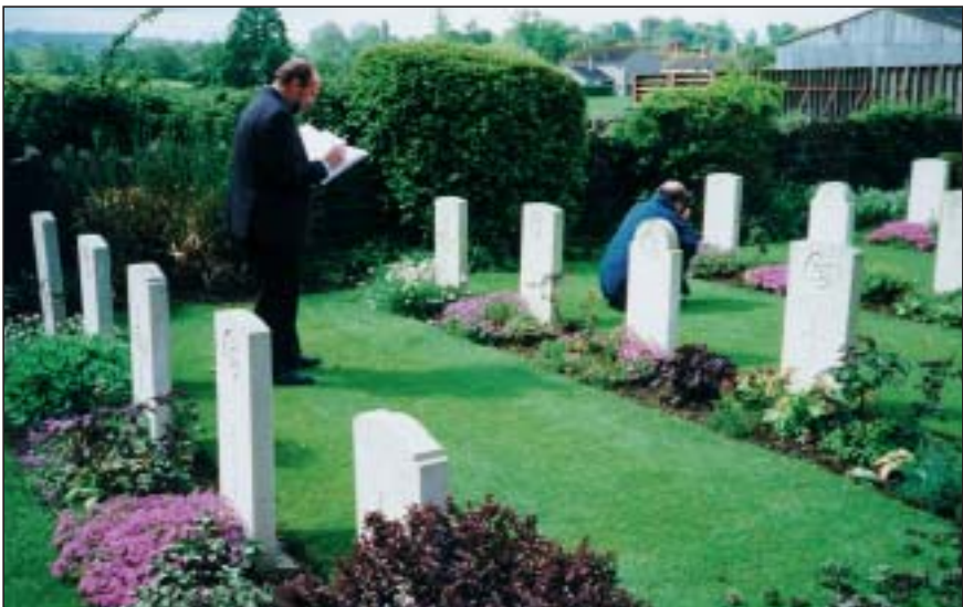
Inspectie van de Nederlandse graven in Yeovilton (Somerset).

Evenals in 1998 werd ook in 1999 een inspectie uitgevoerd van graven van Nederlandse oorlogsslachtoffers en personen van andere nationaliteiten die onder Nederlandse vlag zijn gesneuveld en begraven liggen in het Verenigd