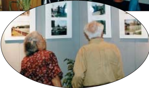
De informatiestand van de Oorlogsgravenstichting op de Pasar Malam Besar.