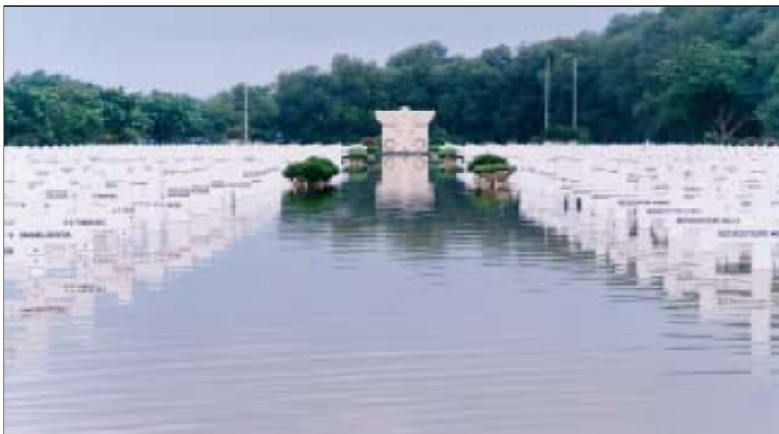
Watersnood op het ereveld Ancol.

Tijdens de Kerst kwamen grote delen van Jakarta onder water te liggen. Het ereveld Ancol had hier bijzonder veel last van, temeer daar grote hoeveelheden water van het opgehoogde terrein van Ancol Dreamland naar het ereveld werden geperst. Uiteindelijk werd op het ereveld een waterhoogte gemeten van ca. 62 cm! De schade hierdoor bleek achteraf gelukkig mee te vallen. De bestaande waterkering zal echter zo spoedig mogelijk worden verbeterd.