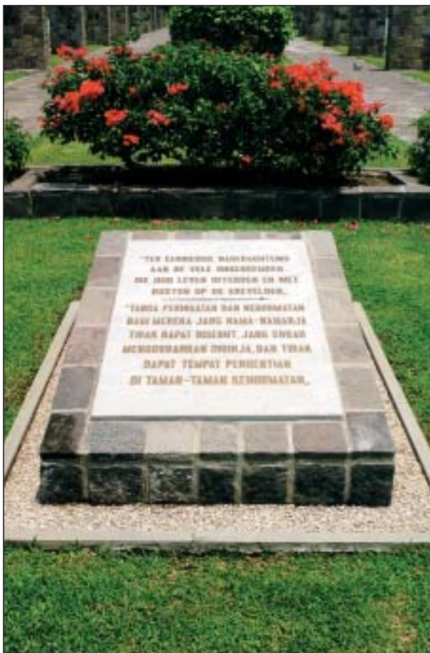
Monument voor de oorlogsslachtoffers zonder graf.

Op 22 april 1949 werd Kalibanteng onder grote belangstelling ingewijd. Bij deze gelegenheid werden tevens de stoffelijke resten van 40 oorlogsslachtoffers herbegraven. De kisten, bedekt met de Nederlandse vlag en voorzien van bloemen, waren gerangschikt in een halve cirkel om de kist met de stoffelijke resten van een onbekende vrouw. De herbegrafenis werd uitgevoerd door militairen van het garnizoen te Semarang, terwijl muzikanten van het Koninklijk Nederlands Indisch Leger (KNIL) de muzikale omlijsting verzorgden.