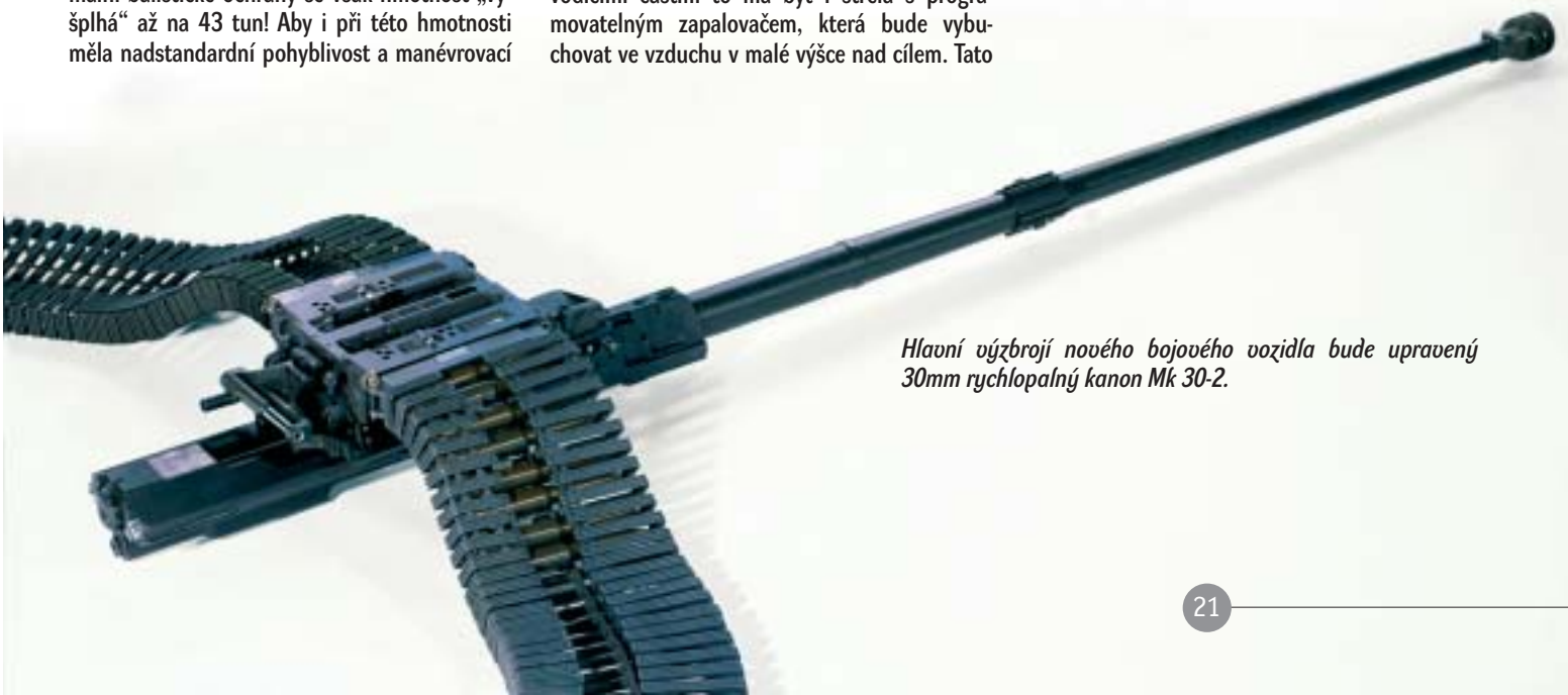
Hlavní výzbrojí nového bojového vozidla bude upravený 30 mm rychlopalný kanon Mk 30-2.

Michal ZDOBINSKÝ