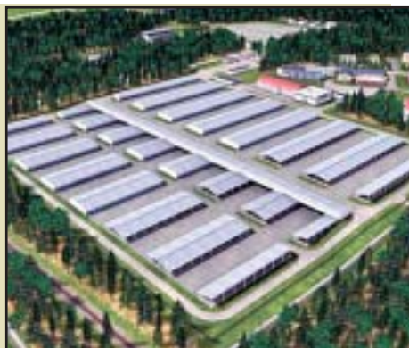
Bechyň – Konečná podoba stálého parku techniky. Bude vybaven výdejnou provozních hmot a maziv, technickou ošetrovnou vozidel a dílnami.