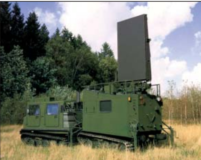
Nejvíce uživatelů si za nosič systému ARTHUR vybralo švédské obojživelné terénní vozidlo Bv206. Systém lze přepravovat nejen v letounu C-130, ale i v podvěsu pod vrtulníkem CH-47 CHINOOK.