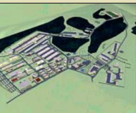
Jince – Plán výstavby dělostřelecké základny