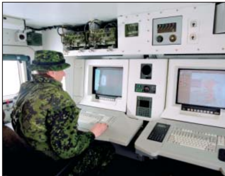
Pracoviště operátora uvnitř klimatizované skříně. K obsluze postačí i jeden voják. Několik síťově propojených systémů ARTHUR dokáže pokrýt plochu až 2000 km 2 .

systém i jeden člověk. Informace z radiolokátoru jsou automaticky předávány na příslušné velitelské stanoviště. Přesnost určení postavení střílejícího protivníka závisí především na tom, kolikrát a pod jakým úhlem je letící střela radiolokátorem zachycena. V této souvislosti například zahraniční odborný tisk cituje vyjádření norských obsluh, které při cvičení údajně určovaly v souřadnicích postavení minometů s přesností na 8 a 12 m.