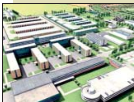
Žatec – V rekonstruovaných budovách ve tvaru „U“ budou sídlit dva prapory a pro třetí bude za nimi postavena nová budova.