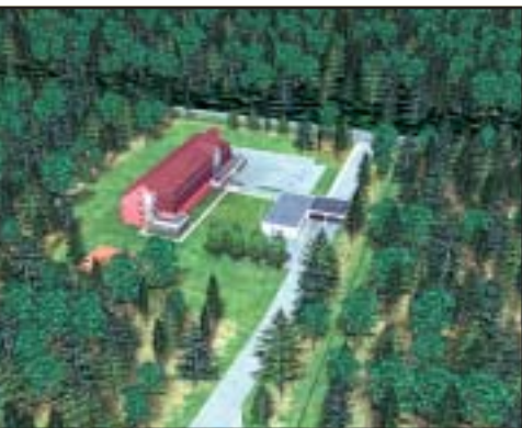
Bechyň – Hlavní vstup na základnu se ubytovnou se 120 lůžky