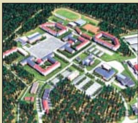
Bechyň – Celkový pohled na služební zónu