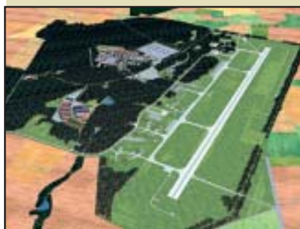
Bechyně – Rozsah základny podle zpracované vize