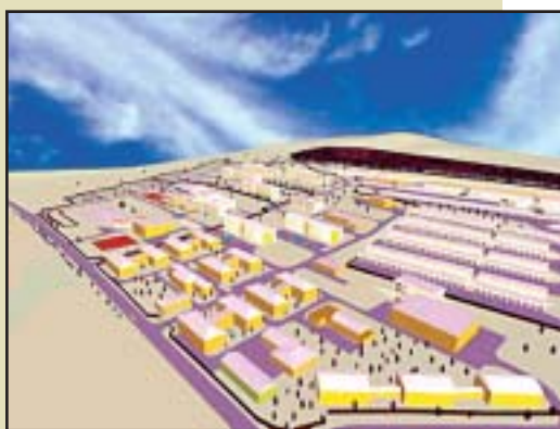
Jince – Předpokládaná podoba základny

kapacitu kuchyňského bloku, aby stačil pro celou brigádu, vybudovat parkoviště a počítá se také s postavením manipulační plochy pro vrtulníky, která bude sloužit jen ve výjimečných případech. „Posádková ošetrovna zatím zůstane ve stávajícím objektu,“ upřesňuje Dienstbier. Po přesunu třetího praporu bude nutné rozšířit i park techniky. „Ten podle propočtů objemově zastavovací studie svojí kapacitou postačuje pouze části 4. brigády rychlého nasazení, a tak bude rozšířen,“ představuje nám další záměry Jaroslav Dienstbier. Modernizace se dočká i učebně-výcviková základna.