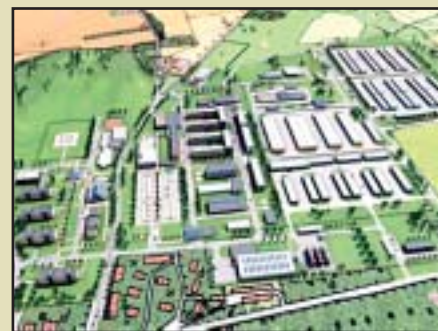
Žatec – Celkový pohled na základnu