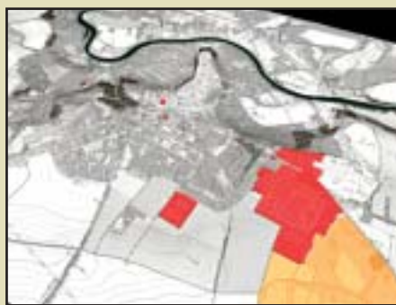
Žatec – Rozsah a umístění základny a užívaných objektů podle zpracované objemové zastavovací studie

Do roku 2010 by měla být dokončena rekonstrukce čtyř objektů, ve kterých budou sídlit dva prapory. K budovám budou dostavěna ještě nová křídla tak, aby vždy dvě z budov uzavřela do tvaru „U“. Výstavba sídla třetího praporu začne v roce 2010. Bude třeba také rozšířit