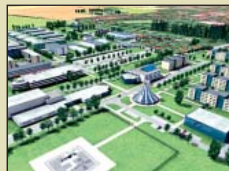
Žatec – Veřejná zóna by podle návrhu objemové zastavovací studie měla nabídnout nová sportoviště, víceúčelovou halu, kulturní dům, ubytovny i středisko duchovní služby.