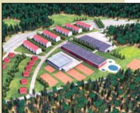
Bechyň – Veřejná zóna vznikne až ve druhé etapě. Její rozsah zatím nebyl schválen. Podle studie by měla nabízet ubytování pro 700 osob, obchodní, kulturní a společenské centrum a středisko sportu, tělovýchovy a rehabilitace.