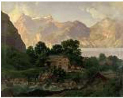
1557 O.I. FREY Schweizer Schule um 1870