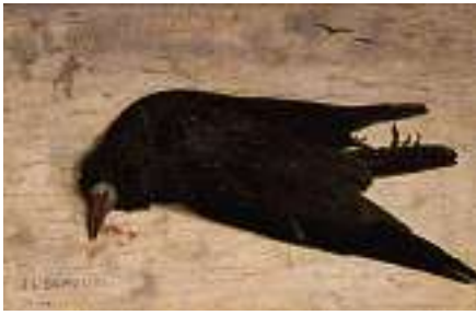
1567 JEAN-LEON GEROME Vesoul 1824-1904 Paris