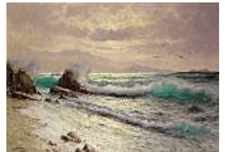
1738 GUIDO ODIERNA Italienische Schule um 1900

Strandlandschaft auf Capri Links unten signiert und bezeichnet Capri Öl auf Lwd., 100 x 140 cm