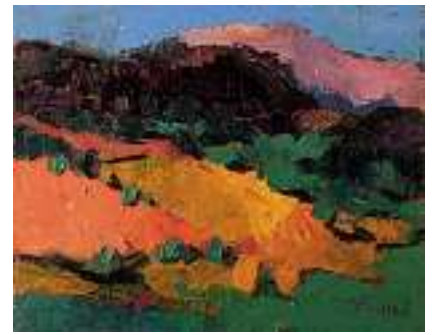
1675 GERNOT KISSEL Geb. 1939 in Worms Landschaft Rechts unten signiert. Öl auf Lwd., 80 x 100 cm CHF 1 200 / 1 500.– EUR 775 / 970.–