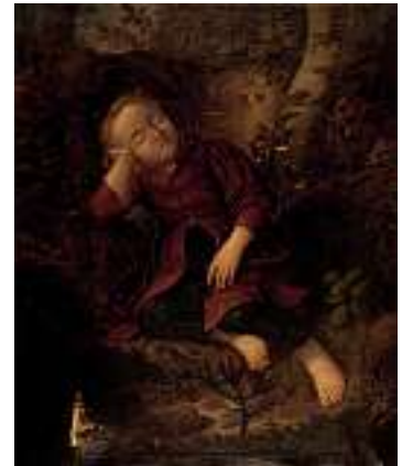
1480* DEUTSCHE SCHULE 1. H. 19. JH. Im Freien schlafender Junge Öl auf Lwd., 95 x 76 cm CHF 1 500 / 1 800.– EUR 1 000 / 1 200.– Leinwanddefekte und Pigmentverluste.