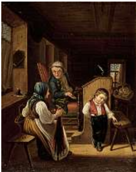
1482 DEUTSCHE SCHULE 19. JH. Beim Dorfschullehrer Öl auf Lwd., 52,5 x 42 cm