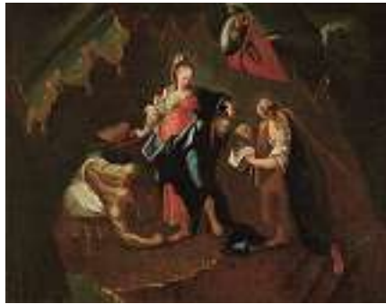
1643 ITALIENISCHE SCHULE 18. JH. Judith übergibt ihrer Magd das Haupt des Holofernes Öl auf Lwd., 71 x 91 cm CHF 800 / 1 200.– EUR 515 / 775.–