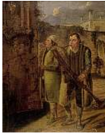
1733 NEAPOLITANISCHE SCHULE 19. JH. Strassenmusikanten unter Madonnenbild Öl auf Lwd., 27 x 21 cm