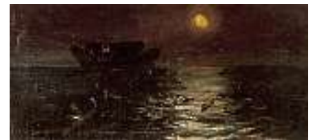
1599 HENRI-JOSEPH HARPIGNIES Valenciennes 1819-1916 St. Privé

Ruderboot am Ufer Links unten signiert. Öl auf Karton, 26,5 x 34,5 cm CHF 400 / 600.– EUR 260 / 385.–