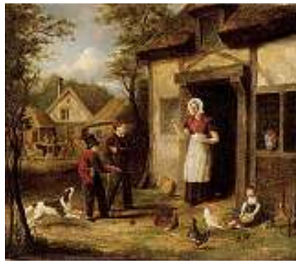
1503* ENGLISCHE SCHULE 19. JH. Die Rückkehr des jungen Missetäters Öl auf Lwd., 30 x 35 cm CHF 1 000 / 1 200.– EUR 645 / 775.–