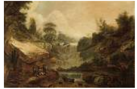
1910 ZÜRCHER KLEINMEISTER UM 1800 “Wasserfall bey Erlenbach im Canton Zürich” Öl auf Karton, 42 x 62,5 cm CHF 1 200 / 1 500.– EUR 775 / 970.–