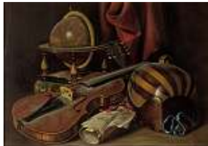
1561 G. C. GARZELLI Italienische Schule 20. Jh.

Herbstliche Baumlandschaft Rechts unten signiert und datiert 24. Öl auf Lwd., 81 x 56 cm CHF 600 / 800.– EUR 385 / 515.–