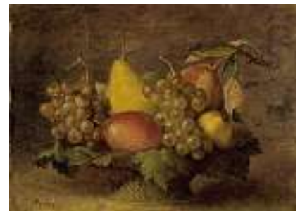
1564 A. GENTIL Französische Schule 19./20. Jh.

Stilleben mit Instrumenten Rechts unten signiert. Öl auf Lwd., 48 x 68 cm CHF 300 / 400.– EUR 195 / 260.–