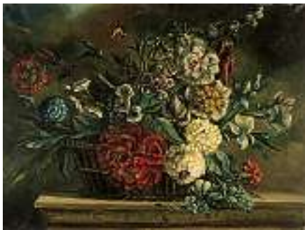
1538 Art der FRANZÖSISCHEN SCHULE 17. JH. Blumenkorb auf Steinsims Öl auf Lwd., 47 x 63 cm

Rechts unten signiert "G. Courbet". Öl auf Lwd. (quadiert), 20,5 x 30 cm CHF 600 / 800.– EUR 385 / 515.–