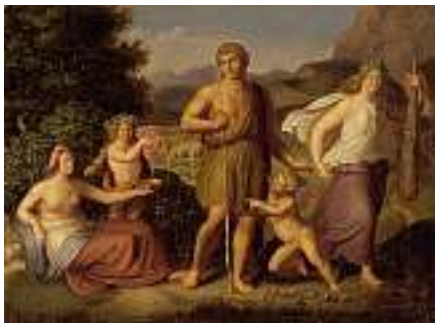
1481 DEUTSCHE SCHULE UM 1820 Herkules am Scheideweg Öl auf Lwd., 36 x 49 cm