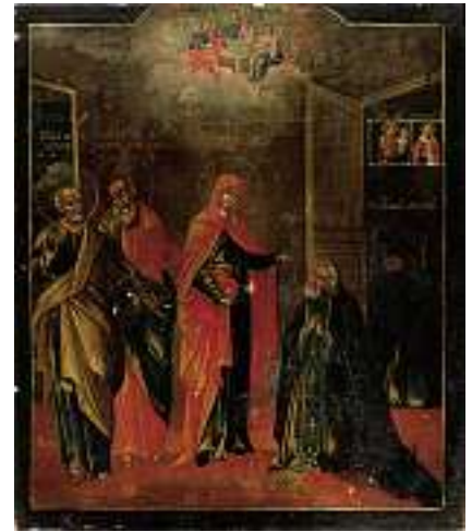
1790 RUSSISCHE SCHULE 19. JH. Muttergottes mit zwei Begleitern und zwei Bittstellern Tempera auf Holz, 26 x 22,5 cm