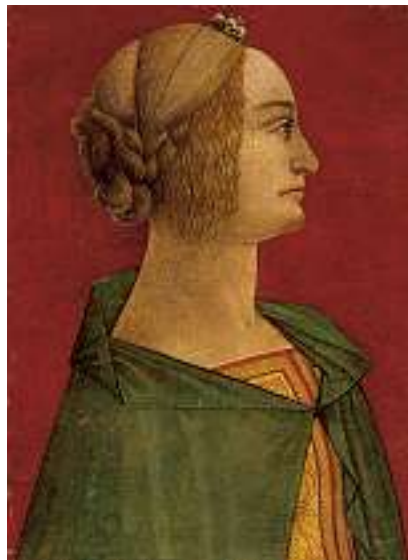
1636 Art der ITALIENISCHEN SCHULE 15. JH. Porträt einer Frau im Profil Tempera (?) auf Holz, 35 x 25 cm CHF 1 200 / 1 500.- EUR 775 / 970.-