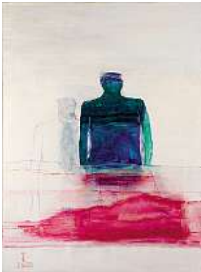
1706 MORIO MATSUI Geb. in Toyohashi (Japan) lebt auf Korsika Personnage Links unten signiert und datiert 8.4.1972 Öl auf Lwd., 130 x 97 cm CHF 1 000 / 1 500.– EUR 645 / 970.–

Provenienz: Galerie Neupert, Zürich (Stempel auf Chassis).