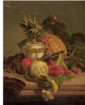
1517 EUROPÄISCHE SCHULE 19. JH. Früchtestillleben mit Ananas, Zitrone und Himbeeren Öl auf Lwd., 50 x 40 cm CHF 700 / 900.– EUR 450 / 580.–