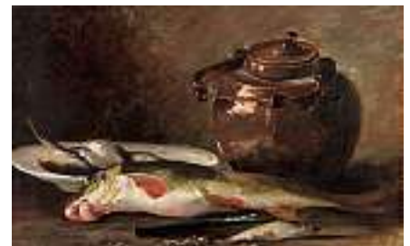
1546 FRANZÖSISCHE SCHULE 19. JH. Stilleben mit Fischen und Kupferkessel

Öl auf Karton, 21 x 27 cm CHF 300 / 400.– EUR 195 / 260.–