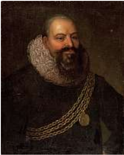
1820 SCHWEIZER SCHULE 17. JH. Porträt eines Ratsherren

Öl auf Lwd., 74 x 60 cm CHF 1 600 / 1 800.– EUR 1 050 / 1 150.–