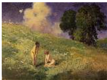
1486 DEUTSCHE SCHULE UM 1900 Zwei Frauenakte auf Blumenwiese

Öl auf Lwd., 60 x 80 cm CHF 500 / 600.– EUR 325 / 385.–