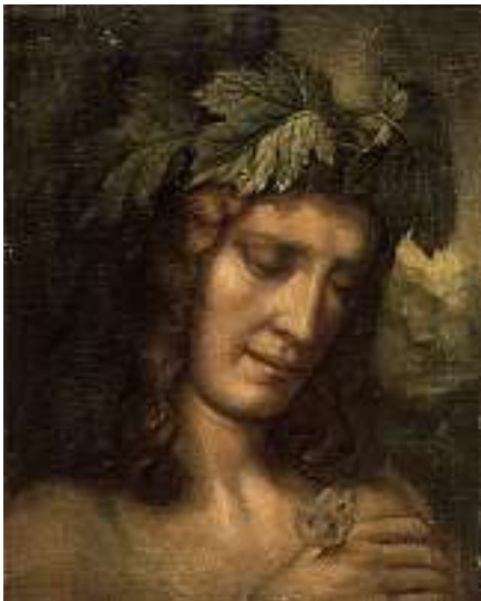
1875* HENRY CLEMENS VAN DE VELDE Antwerpen 1863-1957 Zürich

Bacchus mit Schmetterling Links oben signiert. Öl auf Holz, 38 x 30 cm