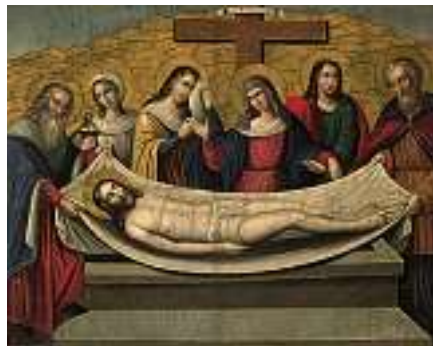
1484 DEUTSCHE SCHULE 19. JH. Grablegung Christi

Öl auf Lwd., 47 x 59,5 cm, ungerahmt CHF 500 / 700.– EUR 325 / 450.–