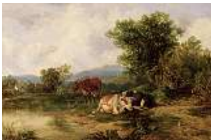
1501 ENGLISCHE SCHULE 19. JH. Landschaft mit Kühen Öl auf Lwd., 61 x 91,5 cm CHF 1 800 / 2 000.– EUR 1 150 / 1 300.–