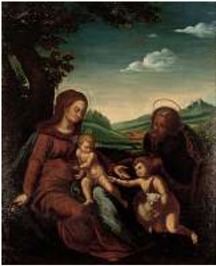
1641 ITALIENISCHE SCHULE 17./18. JH. Heilige Familie mit Johannesknaben im Freien Öl auf Lwd. auf Karton aufgezogen, 78,5 x 63 cm CHF 1 500 / 1 800.– EUR 970 / 1 150.–