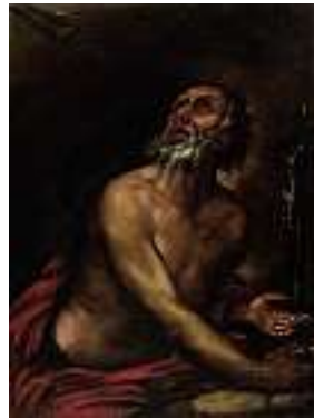
1514 EUROPÄISCHE SCHULE 18. JH. Der Heilige Hieronymus Öl auf Lwd. auf Holz aufgezogen, 35 x 26 cm