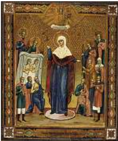
1785 RUSSISCHE SCHULE 19. JH. Muttergottes der Hilfe Tempera auf Holz, 31 x 26 cm