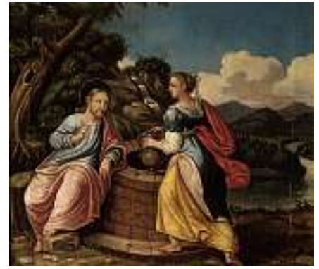
1825* SCHWEIZER SCHULE 18. JH. Jesus und die Samariterin

Öl auf Lwd., 38 x 43 cm CHF 800 / 1 200.– EUR 515 / 775.–