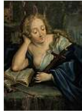
1479 DEUTSCHE SCHULE 18./19. JH. Reuige Magdalena Öl auf Holz, 28,5 x 20,5 cm CHF 500 / 700.– EUR 325 / 450.–