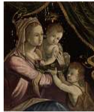
1469 DEUTSCHE SCHULE 17. JH. Maria, Jesus und Johanneskind Öl auf Holz, 29 x 24,5 cm CHF 450 / 550.– EUR 290 / 355.–