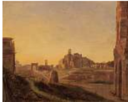
1459 Art des CAMILLE COROT Paris 1796-1875 Ville-d'Avray