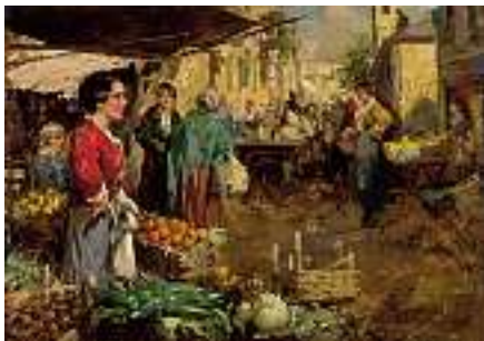
1652 ITALIENISCHE SCHULE 20. JH. Markttag in der Kleinstadt Rechts unten unleserlich signiert. Öl auf Lwd. auf Pavatex geklebt, 48 x 68 cm CHF 600 / 800.– EUR 385 / 515.–