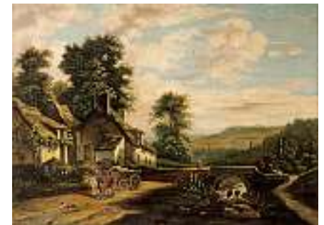
1518 EUROPÄISCHE SCHULE 19. JH. Gegenstücke: Bauerngehöft am Fluss Öl auf Lwd., je 53,5 x 73 cm CHF 1 200 / 1 500.– EUR 775 / 970.–