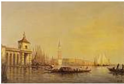
1649 ITALIENISCHE SCHULE UM 1900 Venezianische Vedute Rechts unten unleserlich signiert. Öl auf Lwd., 54 x 81 cm CHF 1 200 / 1 500.– EUR 775 / 970.–