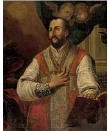
1826 SCHWEIZER SCHULE 18. JH. Vision eines Priesters

Öl auf Lwd., 26 x 36 cm CHF 1 000 / 1 200.– EUR 645 / 775.–