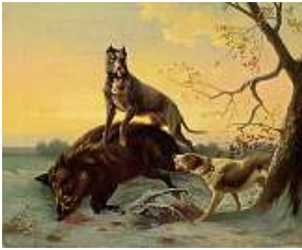
1455 P. CHATEOUS Europäische Schule Ende 19. Jh.