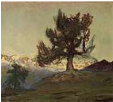
1863 F.H. THOMMEN Schweizer Schule 20. Jh.

Arve vor Bergkulisse Rechts unten signiert. Öl auf Lwd., 35 x 40,5 cm