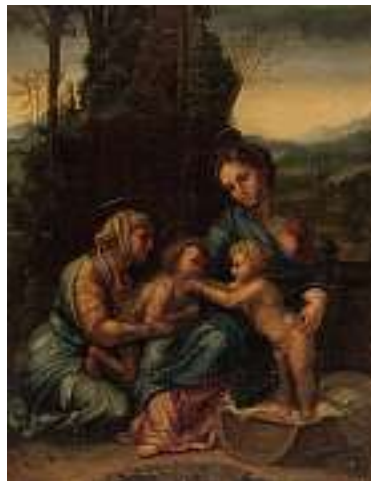
1637 Kopie nach ITALIENISCHER SCHULE 15. JH. Maria, Jesus, Elisabeth und Johanneskind in Landschaft Öl auf Lwd., 40,5 x 32,5 cm, ungerahmt CHF 600 / 800.- EUR 385 / 515.-