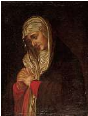
1473* DEUTSCHE SCHULE 18. JH. Mater Dolorosa Öl auf Lwd., 76 x 59 cm CHF 500 / 700.– EUR 325 / 450.–