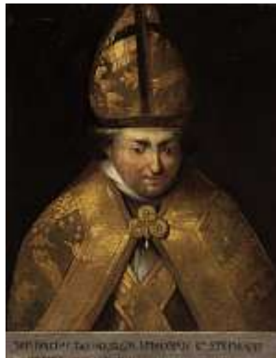
1533* FLÄMISCHE SCHULE 18. JH. Porträt Bonifaz Tapparel, Bischof von St. Stephan in Breda Unten mit Inschrift "Bonifacius Tapparellus Episcopus St. Stephani Brediae ..." Öl auf Lwd., 72 x 56 cm