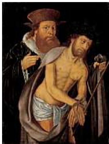
1468 Art der DEUTSCHEN SCHULE 16. JH. Ecce Homo Öl auf Holz, 33 x 25 cm CHF 700 / 900.– EUR 450 / 580.–