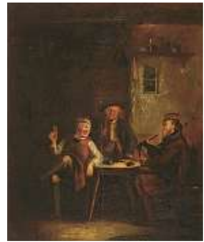
1506 ENGLISCHE SCHULE 19. JH. Fröhliche Runde im Pub Öl auf Holz, 40 x 33 cm CHF 800 / 1 200.– EUR 515 / 775.–