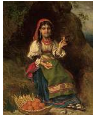
1647 ITALIENISCHE SCHULE 19. JH. Die junge Orangenverkäuferin Links unten unleserlich signiert. Öl auf Lwd., 41 x 32,5 cm CHF 1 500 / 1 800.– EUR 970 / 1 150.–