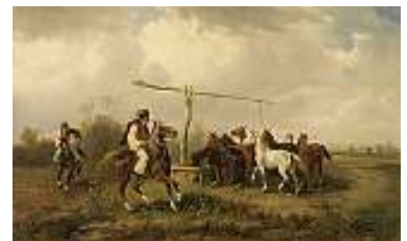
1873 UNGARISCHE SCHULE 19. JH. Pusztalandschaft: Reiter treiben die Pferdeherde an die Tränke

Links unten signiert "Riche" Gegenstück zu der vorangegangenen Katalog-Nummer Öl auf Lwd., 42 x 68,5 cm