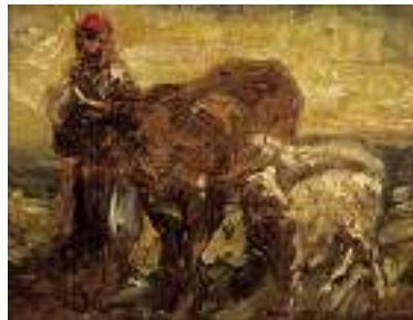
1542 FRANZÖSISCHE SCHULE 19. JH. Hirtin mit Vieh

Öl auf Lwd. auf Karton aufgezogen, 15,5 x 25,5 cm CHF 400 / 600.– EUR 260 / 385.–