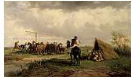
1872 UNGARISCHE SCHULE 19. JH. Pusztalandschaft: Rastende Reiter mit Pferdeherde am Ziehbrunnen

Rechts unten signiert "Riche". Gegenstück zu der nachfolgenden Katalog-Nummer Öl auf Lwd., 42 x 68,5 cm