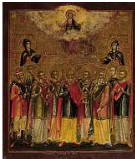
1789 RUSSISCHE SCHULE 19. JH. Heiligenversammlung