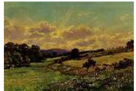
1658 MIKS JOZA Geb. 1901? Landschaft bei Kosice in der Slovakia Rechts unten signiert. Öl auf Lwd., 70 x 100 cm CHF 600 / 800.– EUR 385 / 515.–