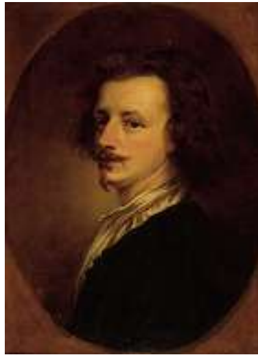
1504 ENGLISCHE SCHULE 19. JH. Künstlerporträt Öl auf Lwd., 65 x 48,5 cm CHF 800 / 1 000.– EUR 515 / 645.–