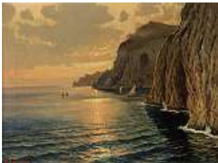
1650 ITALIENISCHE SCHULE 20. JH. Capri Links unten unleserlich signiert. Öl auf Lwd., 30 x 40 cm CHF 500 / 700.– EUR 325 / 450.–