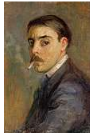
1648 ITALIENISCHE SCHULE UM 1890 Porträt eines Mannes mit Zigarette Rechts oben datiert 92. Öl auf Holz, 26 x 17,5 cm CHF 600 / 800.– EUR 385 / 515.–