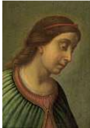
1513 Art der EUROPÄISCHEN SCHULE 17. JH. Brustbild einer Heiligen Öl auf Holz, 29 x 21,5 cm