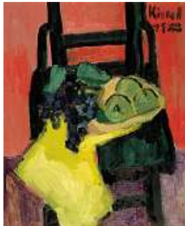
1673 GERNOT KISSEL Geb. 1939 in Worms Früchte auf grünem Stuhl Rechts oben signiert und datiert 1988. Öl auf Lwd., 80 x 65 cm CHF 800 / 1 000.– EUR 515 / 645.–