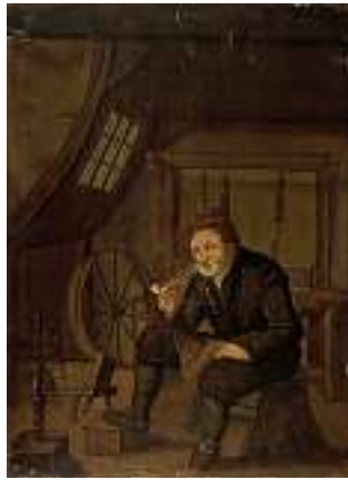
1475 DEUTSCHE SCHULE 18. JH. Gegenstücke: Das Weberehepaar Öl auf Holz, je 37 x 27 cm CHF 800 / 1 200.– EUR 515 / 775.–