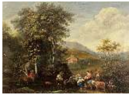
1532* Art der FLÄMISCHEN SCHULE 17. JH. Landschaft mit Bauern und Vieh im Vordergrund Öl auf Holz, 15 x 21 cm