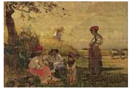
1544 FRANZÖSISCHE SCHULE 19. JH. Die Rast der Erntehelfer

Links unten unleserlich signiert. Öl auf Lwd., 38 x 55 cm CHF 1 500 / 1 800.– EUR 970 / 1 150.–