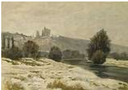
1500 J. EISELT Winterlandschaft Öl auf Lwd. auf Karton aufgezogen, LM 31 x 45,5 cm CHF 400 / 600.– EUR 260 / 385.–