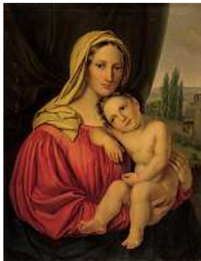
1485 DEUTSCHE SCHULE 19. JH. Madonna mit Kind

Öl auf Lwd., 85 x 65 cm CHF 1 200 / 1 500.– EUR 775 / 970.–