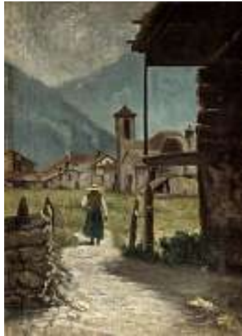
1644 ITALIENISCHE SCHULE ENDE 19. JH. Oberitalienisches Dorf Rechts unten unleserlich signiert. Öl auf Lwd., 69 x 50,5 cm, ungerahmt CHF 600 / 800.– EUR 385 / 515.–