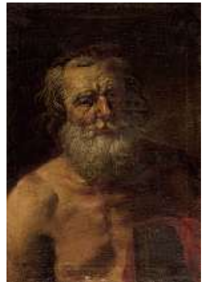
1640 ITALIENISCHE SCHULE 17. JH. Mann mit Buch Öl auf Lwd., 55 x 38,5 cm, ungerahmt CHF 1 200 / 1 500.- EUR 775 / 970.-