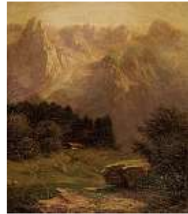
1535* OTTO FORSTER Österreichische Schule 19. Jh. Rohrmoos im bayrischen Allgäu Verso handschriftlicher Zettel mit Angaben zu Künstler und Ort. Öl auf Lwd., 28 x 24 cm

Provenienz: Auktion Burkhart Luzern, Auktion 25, 1988, Kat.-Nr. 1152.