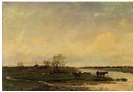
1540 FRANZÖSISCHE SCHULE 19. JH. Weite Flusslandschaft mit Kühen

Links unten unleserlich signiert. Öl auf Lwd., 38 x 55 cm CHF 1 500 / 1 800.– EUR 970 / 1 150.–