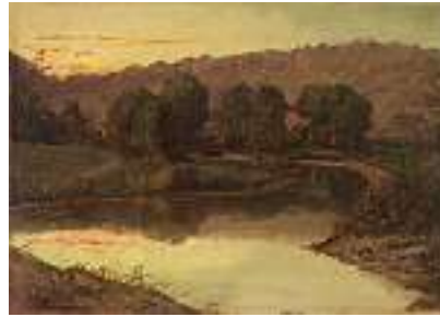
1681 FRANCOIS XAVIER KRUGLER Französische Schule 19./20. Jh. Abendrot am Fluss Rechts unten signiert. Öl auf Lwd., 29 x 29 cm CHF 300 / 400.– EUR 195 / 260.–