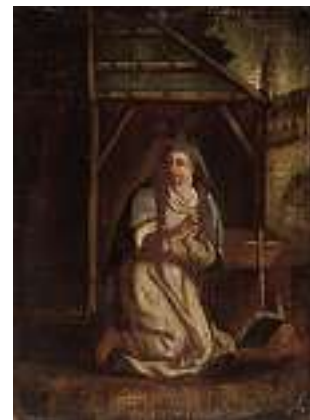
1470 DEUTSCHE SCHULE 18. JH. Reuige Maria Magdalena Öl auf Holz, 26 x 18,5 cm CHF 500 / 600.– EUR 325 / 385.–