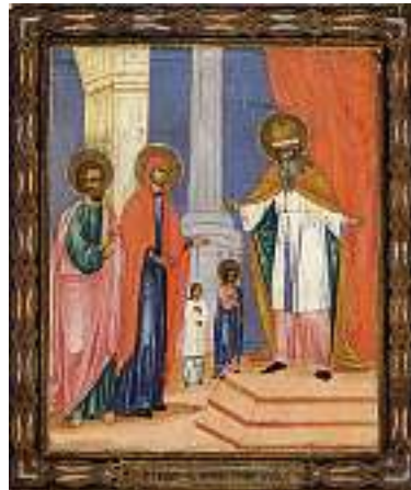
1788 RUSSISCHE SCHULE 19. JH. Tempelgang Mariae