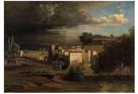
1646 ITALIENISCHE SCHULE 19. JH. Landstädtchen mit heraufziehendem Gewitter Öl auf Lwd., 38 x 55 cm CHF 1 200 / 1 500.– EUR 775 / 970.–