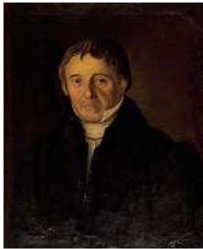
1831 SCHWEIZER SCHULE UM 1810 Porträt eines Mannes Öl auf Lwd., 60 x 49,5 cm CHF 500 / 700.– EUR 325 / 450.–