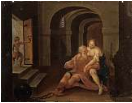
1472 DEUTSCHE SCHULE 18. JH. “Caritas Romana” Öl auf Weissblech, 21 x 27 cm CHF 1 000 / 1 200.– EUR 645 / 775.–