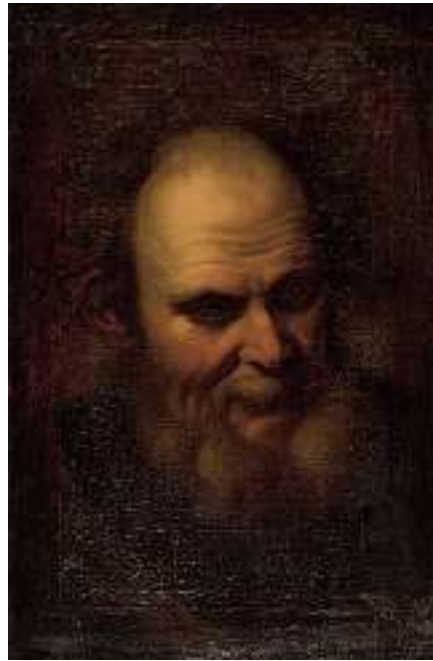
1876 VENEZIANISCHE SCHULE 18. JH. Bärtiger Männerkopf