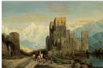
1541 FRANZÖSISCHE SCHULE 19. JH. Vornehme Jagdgesellschaft vor mittelalterlicher Burg Öl auf Lwd., 41 x 60 cm