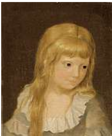
1539 FRANZÖSISCHE SCHULE UM 1790 Porträt eines blonden Mädchens

Öl auf Lwd., 35 x 55 cm CHF 500 / 700.– EUR 325 / 450.–