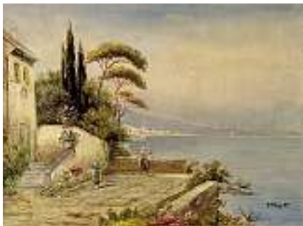
1866 P. TORETTI Italienische Schule um 1930

Nach dem Gemälde in den Uffizien, Florenz.