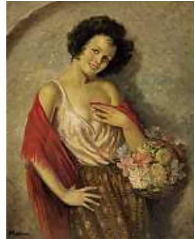
1737 OBSTNER Europäische Schule 20. Jh.

Blumenmädchen Links unten signiert. Öl auf Lwd., 90 x 70 cm