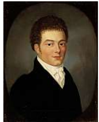
1835* SCHWEIZER SCHULE UM 1830 Porträt eines Herrn aus der Familie Godet Öl auf Lwd., 38 x 29 cm (gemaltes Oval) CHF 600 / 800.– EUR 385 / 515.–