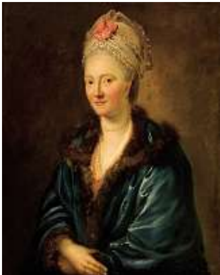
1829 SCHWEIZER SCHULE UM 1780 Porträt einer Dame aus der Familie von Gonzenbach Öl auf Lwd., 81 x 65 cm CHF 1 500 / 1 800.– EUR 970 / 1 150.–