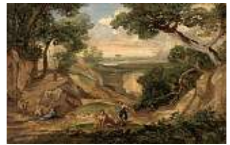
1545 FRANZÖSISCHE SCHULE 19. JH. Heroische Landschaft

Öl auf Lwd. auf Karton aufgezogen, 15,5 x 25,5 cm CHF 400 / 600.– EUR 260 / 385.–