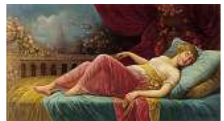
1566 F. GERARD Französische Schule 20. Jh.

Porträt einer jungen Frau Verso signiert, nummeriert und datiert N° 290 1834. Öl auf Lwd., 59 x 43 cm CHF 1 200 / 1 500.– EUR 775 / 970.–