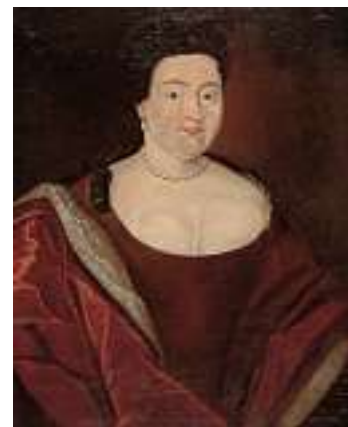
1471 DEUTSCHE SCHULE 18. JH. Porträt Johanna Charlotte Amalia von Möllendorf-von Ponickau (gest. 1737) Verso handschriftlicher Zettel mit Angaben zur Person. Öl auf Lwd., 76,5 x 61 cm CHF 1 800 / 2 500.– EUR 1 150 / 1 600.–