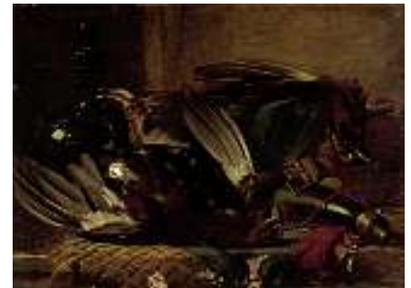
1507* ENGLISCHE SCHULE 19. JH. Jagdstillleben mit erlegten Moorschneehühnern Öl auf Lwd., 35,5 x 48,5 cm CHF 1200 / 1 500.– EUR 780 / 1 000.– Leinwanddefekt und Pigmentverluste.