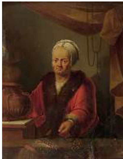
1709 Art des FRANS VAN MIERIS D.Ä. Leiden 1635-1681 Leiden Alte Frau hinter Brüstung Öl auf Holz, 23 x 18 cm CHF 800 / 1 200.– EUR 515 / 775.–

Das Original befindet sich im Staatlichen Lindenau-Museum in Berlin. Verso unvollendete Studie Cafészene. Zum Bild gehört ein 1933 datiertes Attest (Durchschlag) signiert von Sigismund Righini, welches das Werk als "... eine interessante ernst zu nehmende Arbeit" bezeichnet.