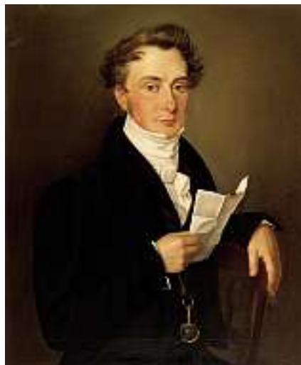
1832 SCHWEIZER SCHULE UM 1830 Porträt eines Mannes mit Brief in der Hand Öl auf Lwd., 74 x 62 cm CHF 800 / 1 200.– EUR 515 / 775.–