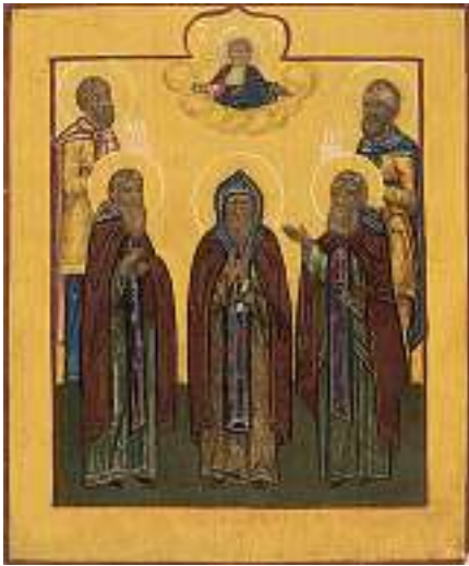
1784* RUSSISCHE SCHULE 19. JH. Fünf Heilige mit Pantokrator Tempera auf Holz, 31 x 26 cm