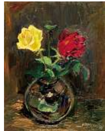
1712 HANS-RUDOLF MEYER Geb. 1913 in Zollikon "Rosen" Rechts unten signiert und datiert 49. Öl auf Karton, 36 x 28,5 cm CHF 300 / 400.– EUR 195 / 260.–

Provenienz: Auktion Galerie Fischer Luzern, Kat.-Nr. 2233.