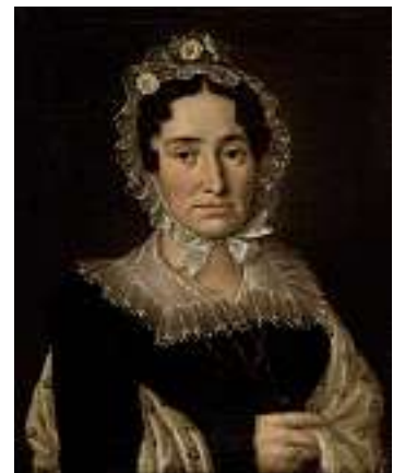
1836* SCHWEIZER SCHULE UM 1840 Porträt einer Frau Öl auf Lwd., 55 x 45 cm CHF 400 / 500.– EUR 260 / 325.–