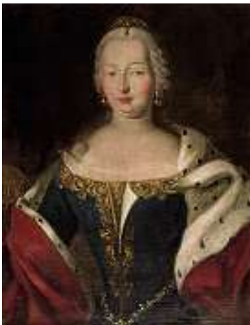
1474 DEUTSCHE SCHULE 18. JH. Porträt einer Königin Öl auf Lwd., 82 x 63 cm CHF 800 / 1 200.– EUR 515 / 775.–