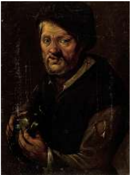
1642 ITALIENISCHE SCHULE 18. JH. Alter Mann mit Mütze und Krug Öl auf Lwd., 60 x 44 cm, ungerahmt CHF 1 500 / 1 800.– EUR 970 / 1 150.–