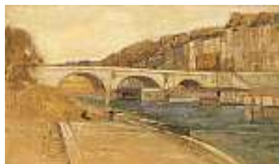
1543 FRANZÖSISCHE SCHULE 19. JH. Städtchen am Fluss

Öl auf Lwd., 38 x 30 cm CHF 1 000 / 1 200.– EUR 645 / 775.–