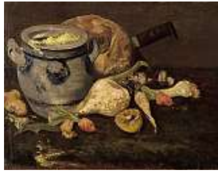
1458 JOSEPH CORNU Französische Schule um 1900