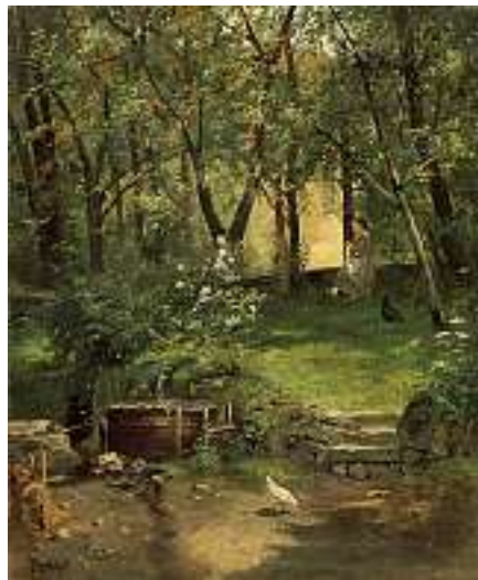
1597 HACKSTUHL Deutsche Schule 19. Jh.

Blumenstraus in Tonvase Rechts unten signiert. Öl auf Karton marouflé, 42 x 29 cm CHF 600 / 800.– EUR 385 / 515.–