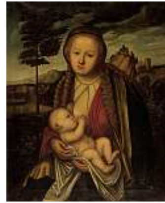
1461 Kopie nach LUCAS CRANACH D. Ä. Kronach 1472-1553 Weimar