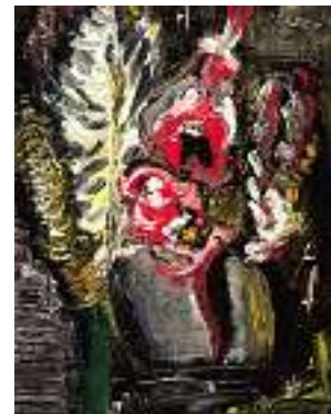
1678 LECH KLEKOT Geb. 1953 in Tschenschav “Tote Blume” Rechts oben signiert. Öl auf Lwd., 50 x 38 cm CHF 500 / 800.– EUR 325 / 515.–