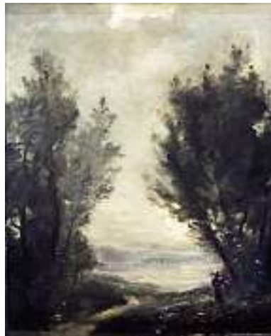
1868 In der Art des PAUL DESIRE TROUILLEBERT Paris 1829-1900 Paris

Provenienz: Villa Diodati, Auktion Christie's, 30. September - 1. Oktober Kat.-Nr. 148