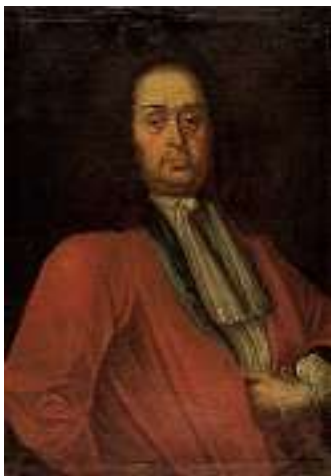
1635 INNERSCHWEIZER SCHULE 18. JH. Porträt eines Herrn Rechts unten bezeichnet und datiert Aet 61 17??. Öl auf Lwd., 84 x 59,5 cm CHF 600 / 800.- EUR 385 / 515.-