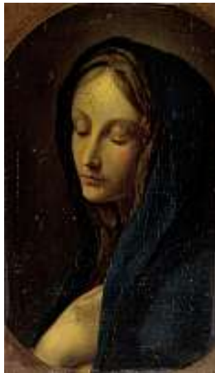
1645 ITALIENISCHE SCHULE 19. JH. Madonna Öl auf Holz, 32 x 19 cm CHF 600 / 800.– EUR 385 / 515.–