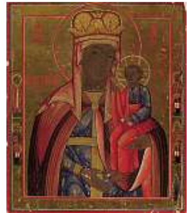
1791 RUSSISCHE SCHULE 19. JH. Muttergottes