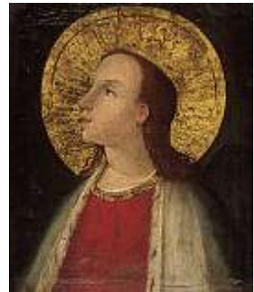
1639 ITALOFLÄMISCHE SCHULE 17. JH. Kreuzigung mit Engeln Öl auf Holz, 66 x 50 cm CHF 1 200 / 1 500.- EUR 775 / 970.-