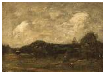
1505 ENGLISCHE SCHULE 19. JH. Landschaft mit bewölktem Himmel Rechts unten unleserlich signiert. Öl auf Lwd., 38,5 x 56 cm CHF 1 500 / 1 800.– EUR 970 / 1 150.–