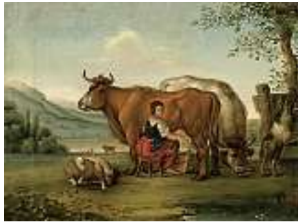
1823* SCHWEIZER SCHULE 18. JH. Hirtin melkend auf der Weide

Links oben mit Familienwappen. Verso bezeichnet. Öl auf Lwd., 72 x 58,5 cm CHF 500 / 700.– EUR 325 / 450.–