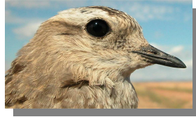
Chorlito carambolo. Otoño. Diseño de la cabeza: izquierda adulto (mm-cc); derecha 1º año (24-IX).