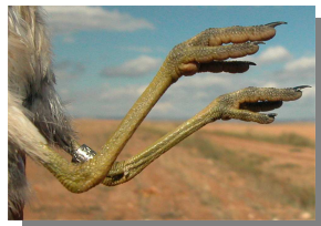
Chorlito carambolo. Otoño. Diseño de las patas: izquierda adulto (mm-cc); derecha 1º año (24-IX).