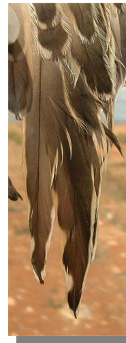
Chorlito carambolo. Otoño. Diseño de terciarias: izquierda adulto (mm-cc); derecha 1º año (24-IX).