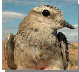
Chorlito carambolo. Otoño. Diseño de la cabeza: izquierda adulto (mm-cc); derecha 1º año (24-IX).