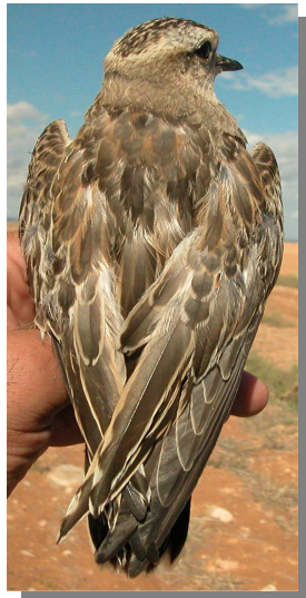
Chorlito carambolo. Otoño. Diseño del dorso: izquierda adulto (mm-cc); derecha 1º año (24-IX).