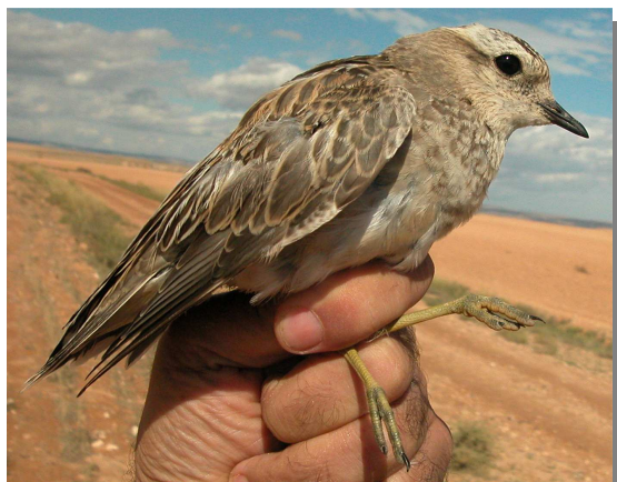
Chorlito carambolo. 1º año. 24 de septiembre.