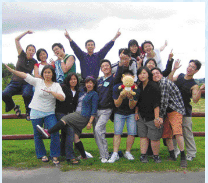
2005年來自加拿大的短宣隊