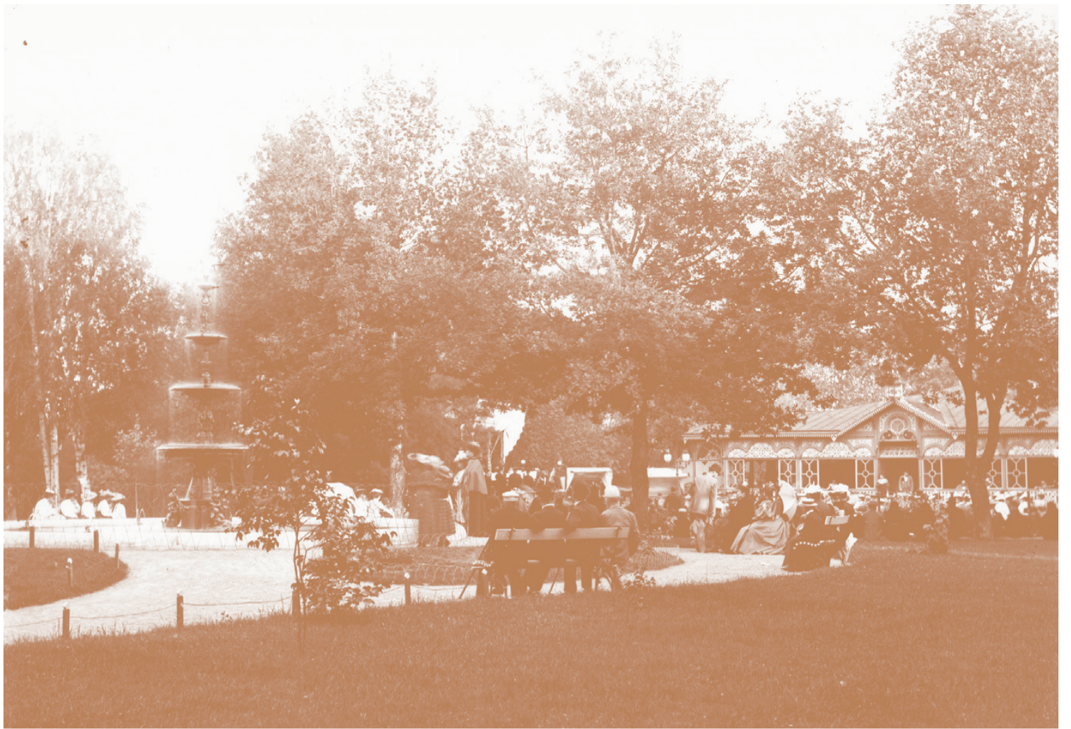
STADSTRÄDGÅRDEN. Sommaren 1959 brändes nöjesetablissemang i Stadsträdgården ner till grunden. En natt som många karlstadsbor minns.

2. En frustration över Waerns världsrekord. Såväl författaren som pyromanen stod bland publiken