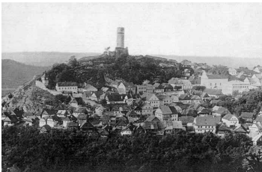
Pohled na Štramberk, rok 1892