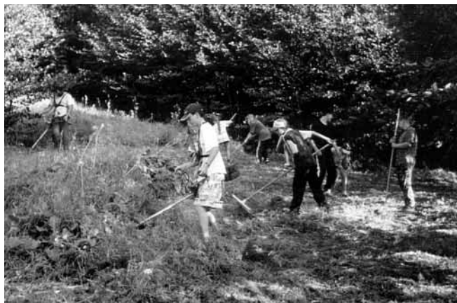
Vstavačová louka rok 1999