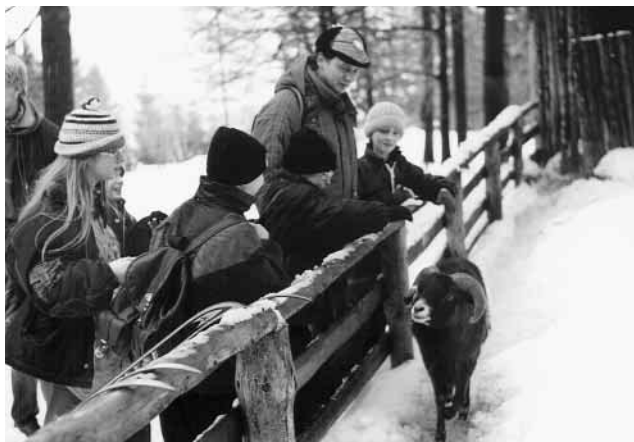
Mladí ochránci přírody — výšlap na Ondřejník