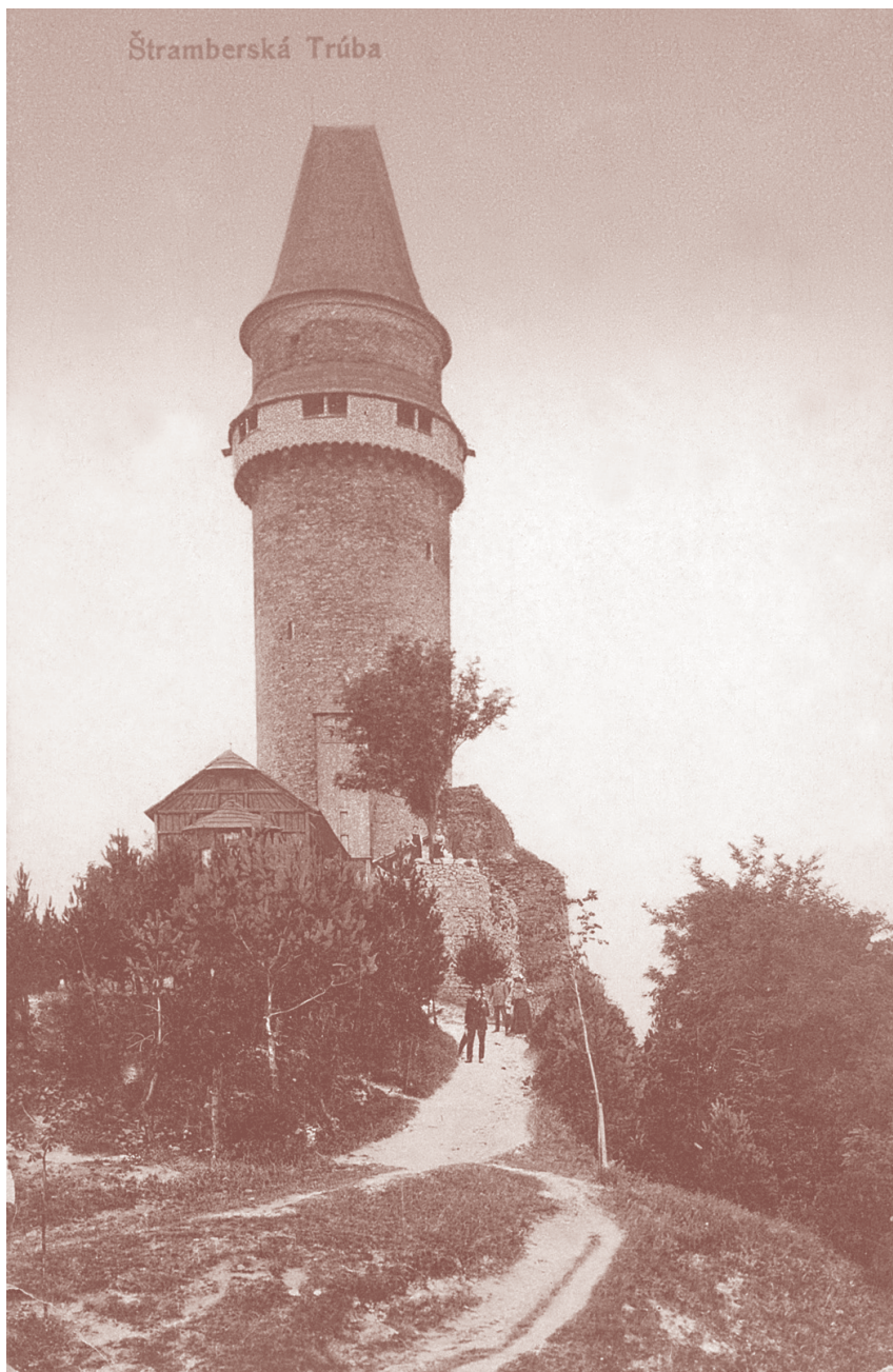
Dobová pohlednice z roku 1910