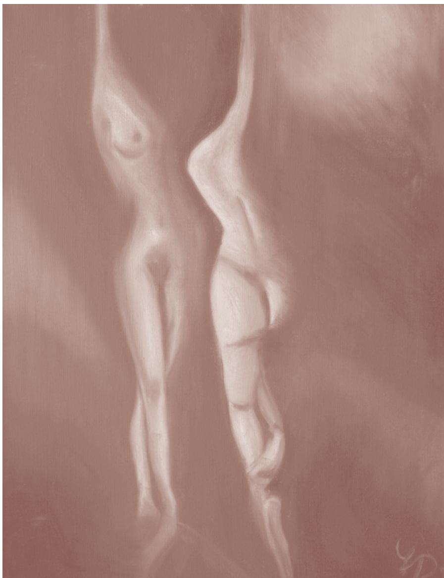
Lenka Dobiášová: Volavky olej na plátně, 1994