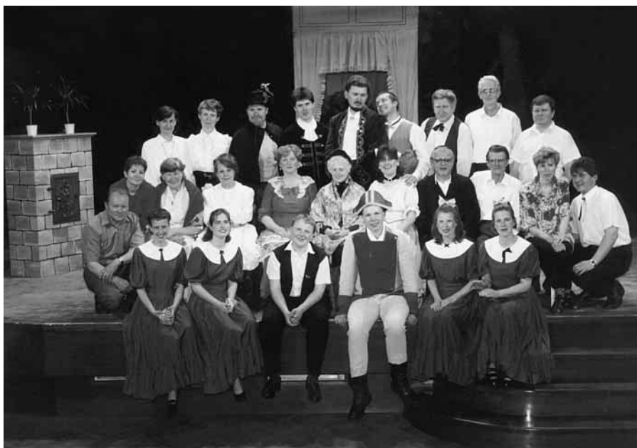
Divadelní soubor Pod věží v operetě „Perly panny Serafinky“

A co říci na závěr? Zasvěcený čtenář určitě ví, že na Štramberku pracují tři divadelní soubory. Dětský divadelní soubor „Troubeníček“, Divadlo Pod věží a divadelní spolek Kotouč. Soubory dospělých se liší svým dramatickým zaměřením. Divadlo Pod věží inklinuje spíše ke klasickým hrám, doplněným hudbou a tancem, soubor Kotouč k inscenacím konverzačního typu. Oba soubory si navzájem vypomáhají — formou „zápůjček“ herců, kostýmů, či rekvizit — podle zaměření jednotlivých her.