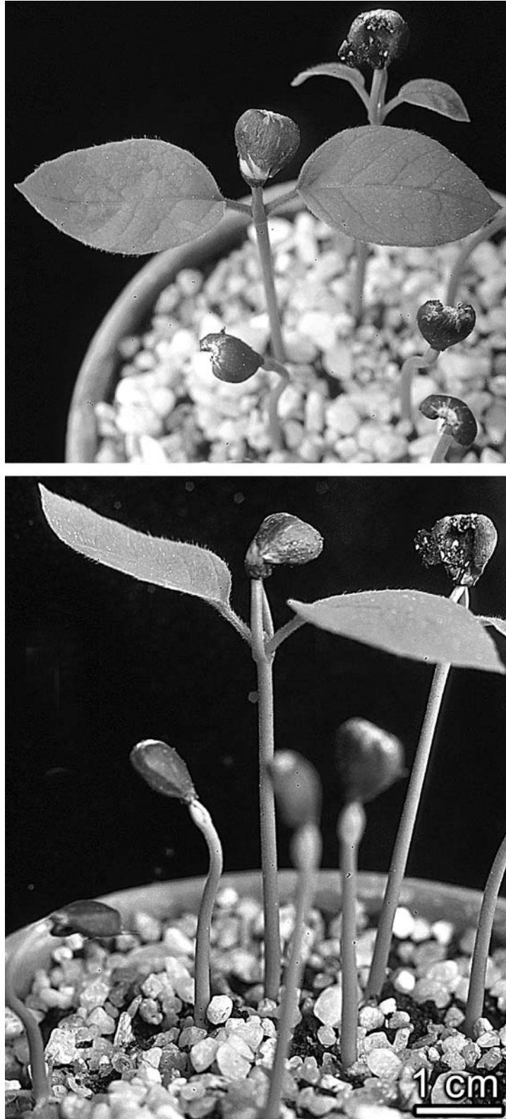
Abb. 1. Aristolochia arborea , ca. 15 Tage alter Sämling mit langen Keimblattstielen, in der Samenschale eingeschlossenen Cotyledonarspreiten und den Primärblättern.