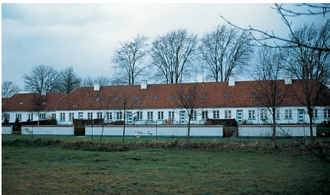
Arbejder- og håndværkerboliger