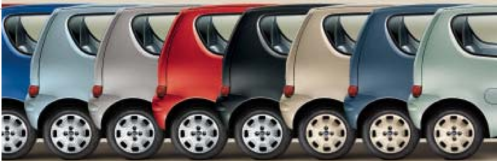
737 Azzurro Acqua Cheta Metallizzato 647 Grigio Cattivo Carattere Metallizzato 199 Rosso Faccia da Schiaffi Extraserie 601 Nero Cattivo Extraserie 129 Avorio Acqua e Sapone Extraserie 454 Blu Testa tra le Nuvole Extraserie 333 Verde Spirito Libero Extraserie

(Coppe ruota color avorio solo su 600 50 th Anniversary)