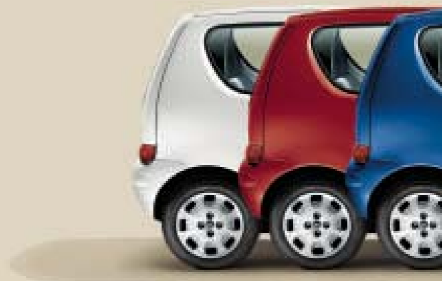
249 Bianco Santerellina Pastello