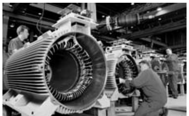
ABB AS kuulub rahvusvahelisse tehnoloogiagruppi ABB, mis teenindab infrastruktuuri- ja tööstusettevõtteid energeetika-ja automaatika valdkonnas. ABB grupi ettevõtetes ligikaudu 100 riigis töötab 107 000 inimest. ABB alustas Eestis tegevust 1992.a, tänaseks töötab ettevõtte erinevates üksustes üle Eesti 730 inimest.