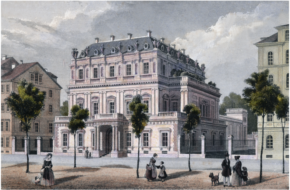
Das Ständehaus in Kassel

Stahlstich von A. Wenderoth und J. Poppel, um 1850.