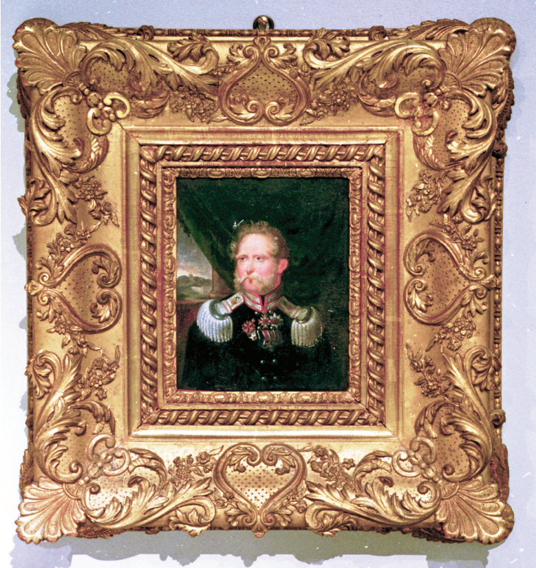
Portrait von Kurfürst Wilhelm II., 1840 - 1845