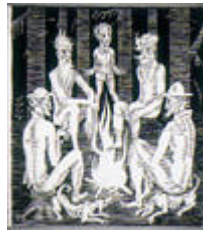
Eduard Viiralt (Wiiralt). Illustratsioon J.Jaiki "Võrumaa juttudele".