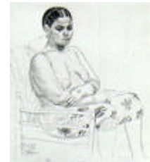
Eduard Viiralt (Wiiralt). Berberi naine.