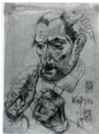
Eduard Viiralt (Wiiralt). Kiviraiuja.