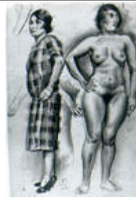
Eduard Viiralt (Wiiralt). Kaks modelli.