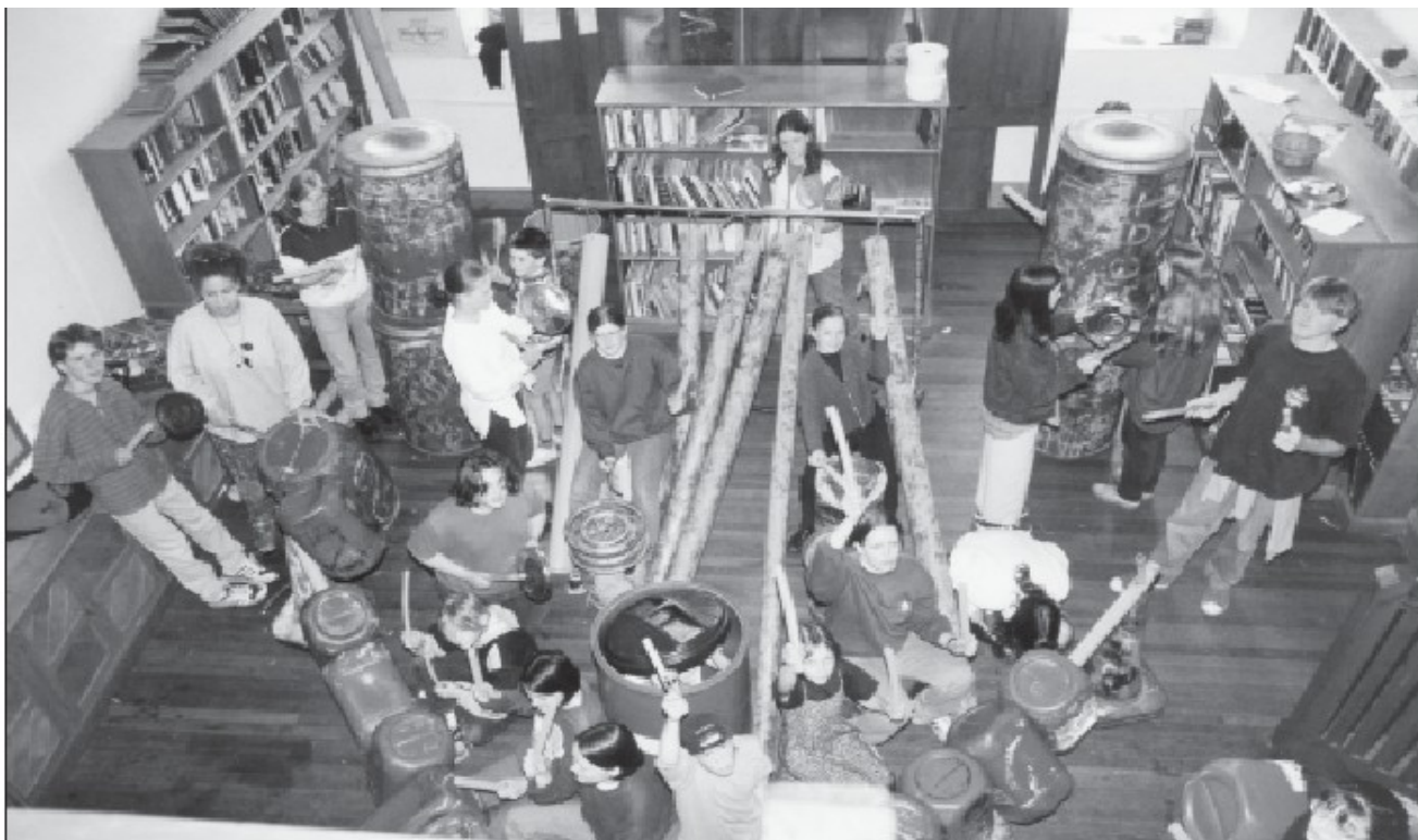
Evento popular durante la semana de la Música que consiste en tocar instrumentos hechos con desechos de equipo agrícola.