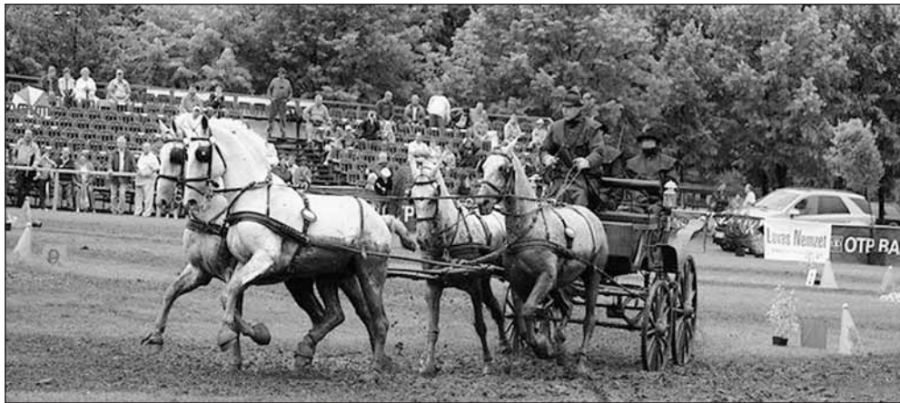
A június 30. és július 2. között megrendezett fogathajtó világkupán betven nemzet lovasai vettek részt

Június 30. és július 2. között Kecskemét ismét bizonyította, hogy méltán „Magyarország Lovas Fővárosa”. A Szabadidőközpontban lévő akadálypályán ugyanis fogathajtó világkupát rendeztek.