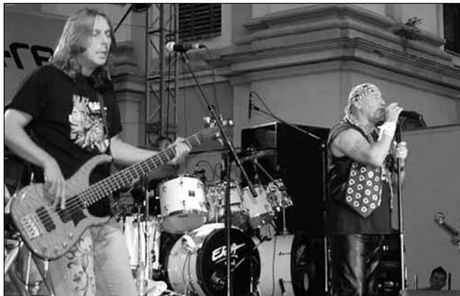
Az Edda is nagy közönség előtt adott koncertet

Az Időgép esti koncertjére megtelt a főtér, ezrek énekel-