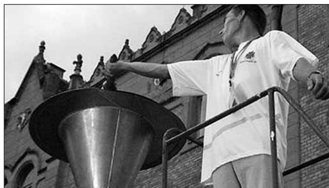
Es felgyulladt a láng Kecskeméten...

Június 22. és 26. között Kecskeméten rendezték meg a Nemzeti Játékokat, mely válogató versenyként is szolgált a közelgő Pekingi Speciális Olimpia előtt.