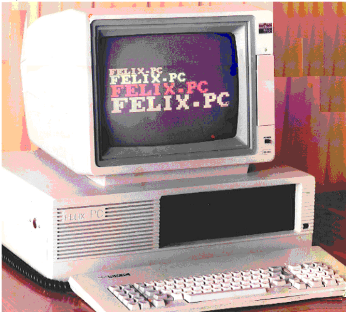
Fig.1. Microcalculatorul Felix-PC.

Felix-PC a fost proiectat si adus in faza de model de laborator, avandu-se in vedere compatibilitatea cu produsul IBM-PC, la Institutul Politehnic Bucuresti, Catedra Calculatoare, intre anii 1983-1984, fiind apoi preluat de catre Intreprinderea de Calculatoare Electronice Felix S.A., pentru tehnologizare si introducere in fabricatia de serie, intre anii 1985-1990.