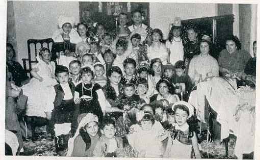
Este simpático grupo infantil —orgullo legítimo de mamás y papás— corresponde a uno de los bailes de niños que se celebraron durante las pasadas fiestas en el Centro Gallego de Madrid.

Catro estampas sociais da época: unha selección de “Guapas de La Coruña”, mostra dos últimos deseños téxtiles para mulleres, Presentacións en Sociedade e “Disfraces del Antruejo”.