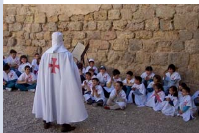
L'activitat "L'enigma dels templers"