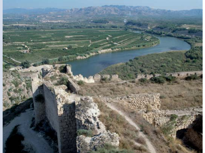
El castell de Miravet i el seu entorn.