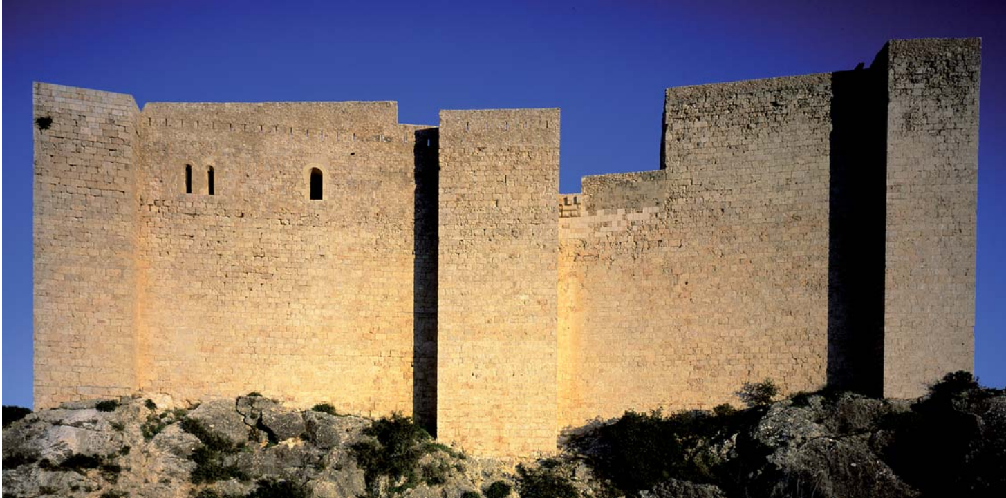
El castell templer de Miravet.