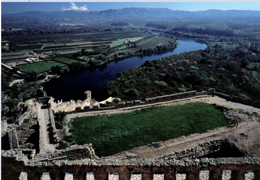
El castell de Miravet sobre el riu Ebre.

El Castell de Miravet és una fortificació que es troba a una altura d'uns 100 metres sobre el riu Ebre, al meandre del Tamarigar i molt propera a l'estret de Barrufemes o congost de Miravet. L'excepcionalitat d'aquest emplaçament rau en la possibilitat de controlar tot l'entorn així com un tram molt concret del riu Ebre. Aquest riu, com tots, és una via de comunicació natural que en aquest cas uneix dos punts importantíssims: el mar Mediterrani, on desemboca, amb l'interior de la península Ibèrica. Dominar, doncs, aquest enclavament de Miravet suposa tenir el control d'una via d'accés a l'interior de la Península i de tots aquells que la utilitzen.