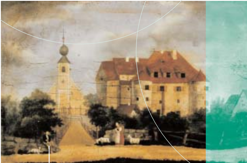
Pyrbaumer Schloss, vernichtet durch Brandstiftung am 17. August 1853

ältesten Chorgestühle Süddeutschlands befindet. Im Umfeld der Kirche zeugen das ehemalige Klostergebäude, die früheren Wirtschaftsgebäude und der stattliche Torturm von der ruhmreichen Vergangenheit.