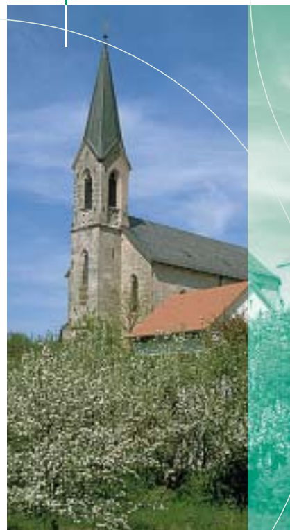
Katholische Kirche Mater Dolorosa, Pyrbaum

1997 Pyrbaum erhält im Wettbewerb „Unser Dorf soll schöner werden – unser Dorf hat Zukunft“ eine Goldmedaille auf Bezirksebene.