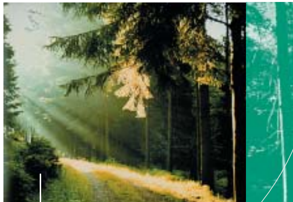
Zahlreiche Rad- und Wanderwege laden ein zur Erholung in einer der waldreichsten Gemeinden der Oberpfalz.

Daneben stößt man vor allem in Oberhembach auf zahlreiche, liebevoll renovierte Fachwerkhäuser, weshalb nicht zuletzt dieser Ortsteil im Jahr 2002 beim Wettbewerb „Unser Dorf soll schöner werden“ mit der Goldmedaille ausgezeichnet wurde. Auch der Hauptort Pyrbaum konnte hierbei bereits fünfmal die Silbermedaille erringen und wurde im Jahr 1997 als das schönste Dorf der Oberpfalz prämiert.