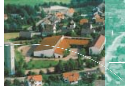
Schule mit Mehrzweckhalle, Pyrbaum

möglichkeiten zwei Kindergärten, eine Bücherei, eine Apotheke sowie Allgemein-, Zahn- und Tierärzte zu finden. In Seligenporten befindet sich neben einem Kindergarten eine weitere Grundschule, ebenso je ein Allgemein-, Zahn- und Tierarzt.