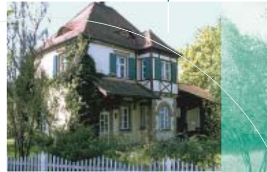
Ehemaliger Bahnhof Pyrbaum