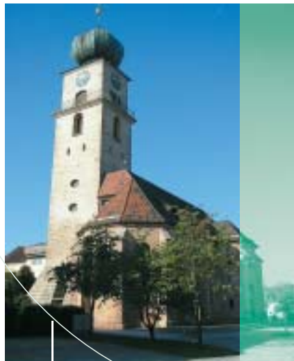
Evangelische Kirche St. Georg, Pyrbaum

1500 Das Kloster Seligenporten zählt jetzt 350 Anwesen mit 650 Untertanen in über 20 Orten als Abgabepflichtige