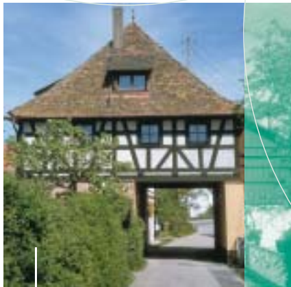
„Neumarkter Tor“ in Pyrbaum

Wolfstein beherrscht wurde, dem später auch die Orte Oberhembach und Pruppach zufließen, erfuhren die übrigen Orte eine andere Entwicklung.