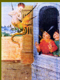
Meluzína s pláčem odlétá z hradu Lusignan, ilustrace k legendě ze 16. století

zvrátil její osud, víla se proměnila v obrovského hada, vylétla oknem, se srdceryvným nářkem zakroužila nad jednou z věží hradu Lusignan a zmizela. Jen v noci občas přicházela ke kolébce nejmenších dětí a plakala nad krutostí osudu, který jí nedovolil žít jako normální ženě. Raimondin