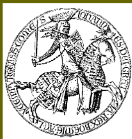
Pečeť Jana Lucemburského s Meluzínou na klenotu koně, 14. století

U Lucemburků je klenot s drakem poprvé doložen na jezdecké pečetě Jindřicha VII. z roku 1297. Jeho syn Jan přejal po nástupu na český trůn tradiční klenot českých králů,