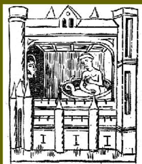
Meluzína v koupeli, ve dveřích nahlíží její manžel Raimondin, kresba z 15. století

Meluzína a Raimondin si žili šťastně, jejich doména neuvěřitelně vzkvétala, víla byla milující manželkou, něžnou matkou, laskavou paní poddaných.