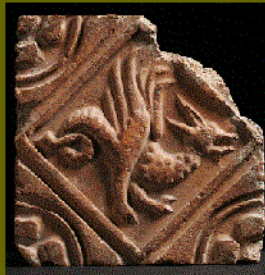
Dlaždice s motivem Meluzíny, Starý královský palác, 14. století

Iluminátoři nejstarších rukopisů z 15. století a do jisté míry i ilustrátoři prvotisků zobrazovali Meluzínu v zásadě v souladu s popisem textů: jako krásnou dívku, hybridní bytost s hadím ocasem i jako letícího hada, resp. okřídleného draka. Z 15. století