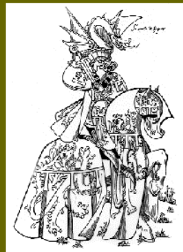
Rytíř na koni s Meluzínou na koruně přilbice, 15. století

U v klenotů jsme přirozeně konfrontováni s problémem adekvátního popisu. Moderní francouzští heraldikové popisují tento nezvyklý klenot vedlejších větví Lucemburků jako „ dragon ailé placé dans un cuvier “ nebo „ dragon issant d'une cuve “. Termín „ cuve “ se objevuje již v popisech z 15. století a lze jej v této souvislosti přeložit jako kád', štoudev nebo džber. Jedná se tedy o okřídleného draka umístěného v kádi, štoudví či džberu, případně o draka z kádě, štoudve nebo džberu vystupujícího (heraldicky myšleno vyskakujícího). Sám Jan z Arrasu