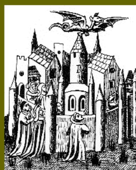
Meluzína nad Lusignanem

Víla coby ochranný duch se později zjevila tři dny před smrtí manžela na hradě Lusignan: „...had se ukázal na hradbách, kde ho mohli všichni spatřit. Třikrát hrad obkroužil a pak se usadil na Poitouské věži, a tam začal vyrážet tak úpěnlivé vzdechy a tak naříkat, že se všem zdálo, že slyší ženský hlas...“