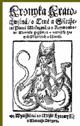
Titulní list kroniky o Meluzíně z roku 1644

Hledat projevy lucemburské pověsti o víle-zakladatelce a ochránkyni Meluzíně v ikonografických námětech českých, moravských a slezských pramenů 14. a 15. století není činností předem odsouzenou k nezdaru. Na základě výše zmíněných faktů by se dala dobová reflexe meluzínské pověsti