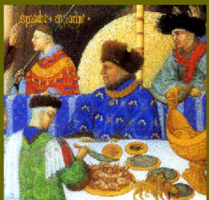
Vévoda z Berry na dobové ilustraci rukopisu (uprostřed), konec 14. století

Víle Meluzíně bylo určeno, aby se každou sobotu proměňovala od pasu dolů v hada. Dosáhne vysvobození jen tehdy, když si ji nějaký muž vezme