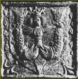
Kachel s Meluzínou, 16. století

kých zemích by se koneckonců nemuselo jednat