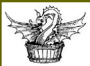
Meluzína v kádi, rytina z 15. století

Mýtus o tragickém osudu víly milující člověka vykrytalizoval z různých písemných a ústních vyprávění do rozsáhlého textu v roce 1393, kdy pařížský