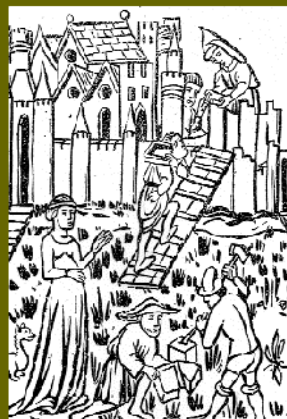
Stavba hradu Lusignan, rytina z 15. století

hvězd, podle níž nějaký vazal usmrtí svého pána a založí přeslavný rod. Tento mladík při lovu na zázračného kance zabil nešťastnou náhodou svého strýce a lenního pána, hraběte z Poitiers. Když zoufale bloudil po lese, setkal se o půlnoci u začarované studánky s krásnou dívkou, která mu nabídla svoji ruku spolu s nevyčerpatelným bohatstvím a prosperitou výměnou za slib, že ji nikdy nebude chtít vidět v sobotu. Tato půvabná dívka byla Meluzína a Raimondin její návrh ochotně přijal. Brzy