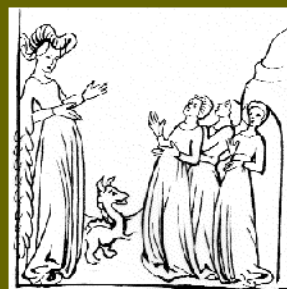
Matka Présine a tři dcery, u nohou matky symbol draka – Meluzíny ?

dokud se nenajde rytíř, který dokáže bdít u dravce po tři dny a nezatoužit při tom ani po její lásce, ani po jejím těle. Palestinu matka zavřela s otcovým pokladem do hory