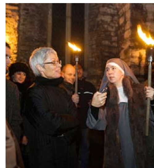
PÜHA TURG: Baltic Eventi külalised käisid Dominiiklaste kloostri turutehingutele õnnistust saamas.