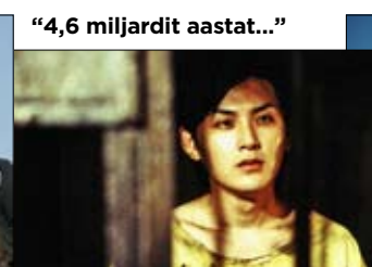
"4,6 miljardit aastat..."