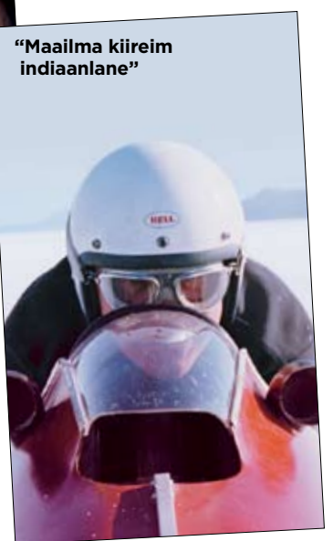
"Maailma kiireim indiaanlane"