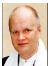
Sven Grünberg helilooja