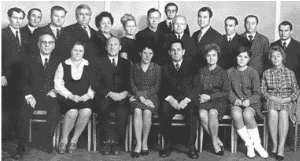
Коллектив кафедры в 70-е годы

В 1977 г. кафедра инженерной графики Харьковского института радиоэлектроники, созданного в 1966 г. на базе ХИГМАВТа, комиссией МинВуза Украины признана лучшей по организации учебной работы, методическому обеспечению и применению технических средств обучения в учебном процессе.