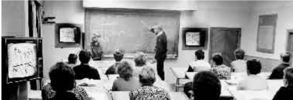
В лаборатории учебного телевидения кафедры инженерной графики

В 1977 г. кафедра инженерной графики Харьковского института радиоэлектроники, созданного в 1966 г. на базе ХИГМАВТа, комиссией МинВуза Украины признана лучшей по организации учебной работы, методическому обеспечению и применению технических средств обучения в учебном процессе.