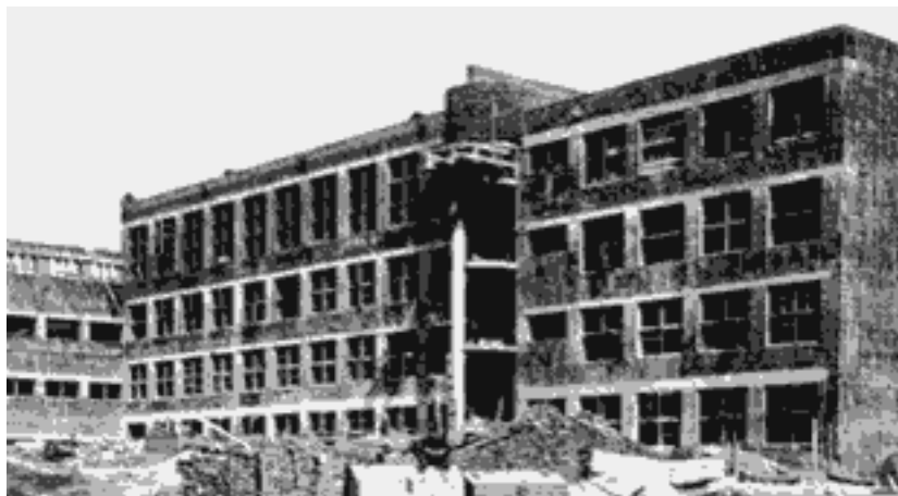
1944-й год, здание горно-индустриального института после войны (правое крыло главного корпуса)