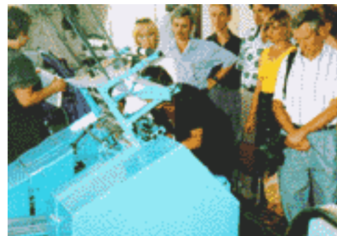
Сотрудники кафедры на филиале кафедры – полиграфическом предприятии "Серп и молот" в г. Балаклея Харьковской области.

Более подробно о специальности можно прочитать на странице "Специальность" сайта кафедры инженерной и компьютерной графики.