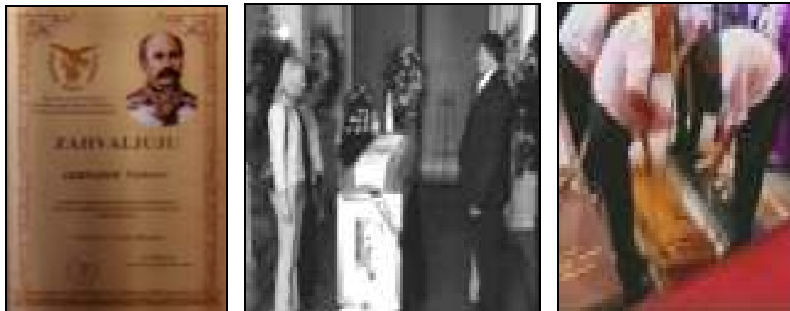
31. svibanj 2002.

Umro je u Beču 16. studenog 1896. godine gotovo zaboravljen. Krajem svibnja 2002. posmrtni ostaci bana Šokčevića preneseni su u rodni grad Vinkovce, te sahranjeni u grobnoj kapelici sv. Magdalene koju je dala sagraditi njegova majka Elizabeta.