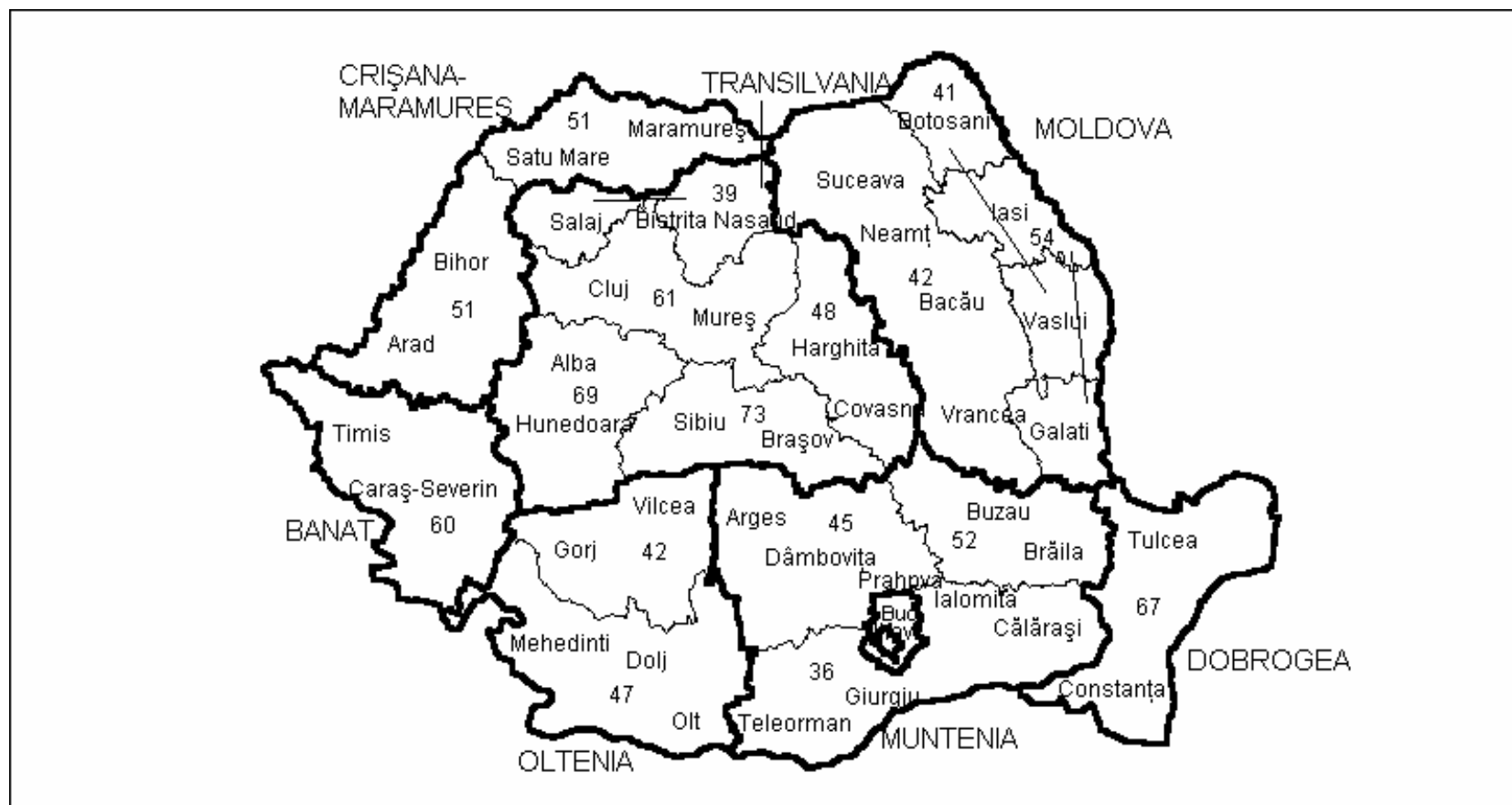
Figura 1. Ariile culturale ale României cu județele componente și regiunile istorice care le includ

Cifrele indică ponderea de populație urbană la nivelul ariei, la 1.01. 2000.