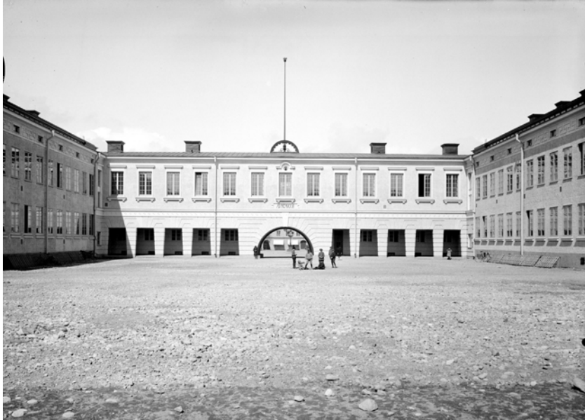
Skolgården strax efter invigningen 1927.