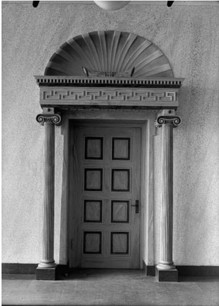
Fotografi av träportal i ett av trapphusen omkring 1927. Här ses hur färgsättning var betydligt mer genomarbetad än i dag.