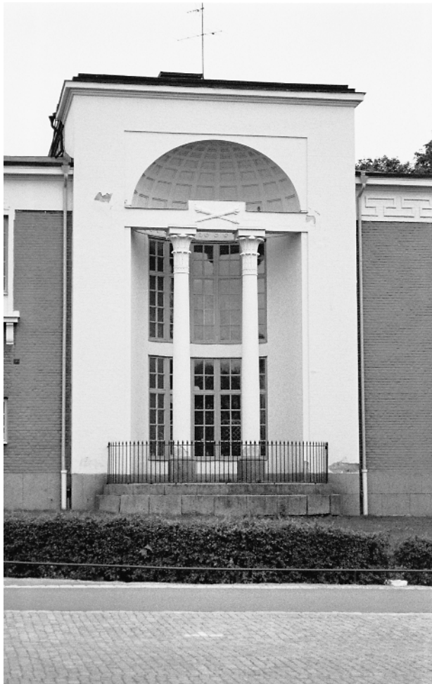
Närbild på västra sidoraliten.