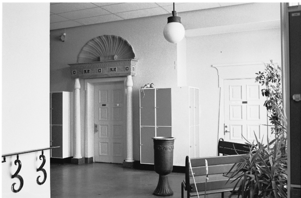
Från västra trapphuset. Ursprungliga detaljer såsom träportik, dryckesfontän och takarmatur.