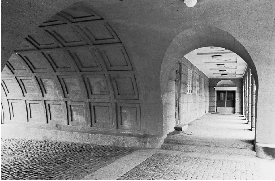
Rasthallen och portvalvet.