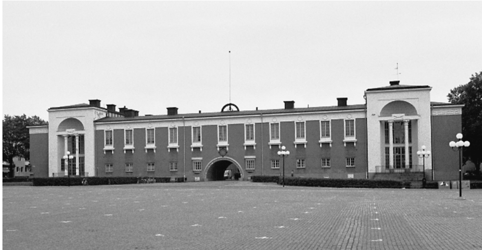
Den imponanta fasaden mot Vaksala torg.