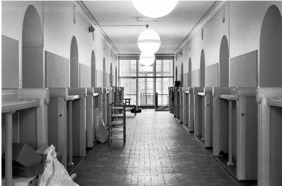
Korridorerna som de ser ut idag med brandcellsörrar och utrymningstrappor. De gamla kapphängarna är bevarade.