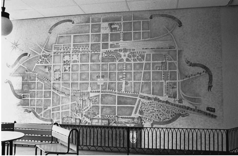
Stadsplan över Uppsala målad på vägg i östra trapphuset.