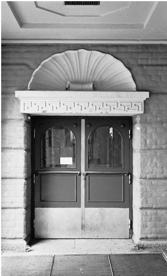
Entréparti i rasthallen.