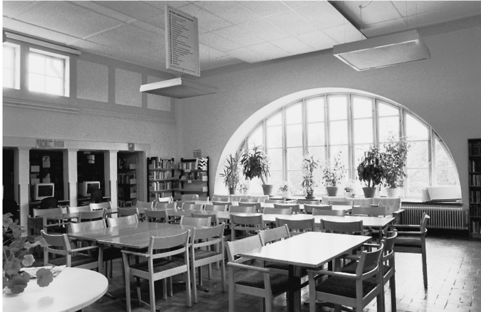
Biblioteket på vinden i västra flygeln. Fotograf: Johan Dellbeck.