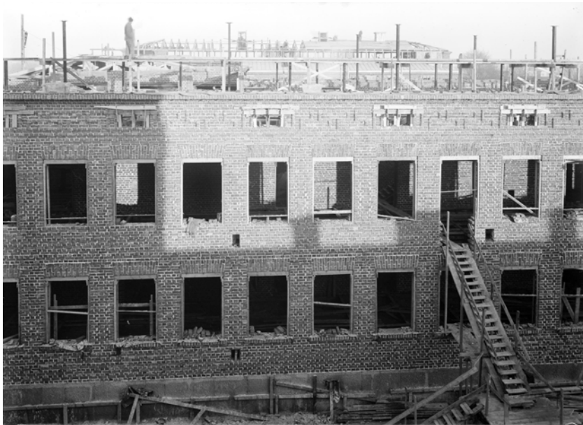
Skolan murades med traditionella tegelmurar. Här är taket under resning.  under byggnadstiden 1926.