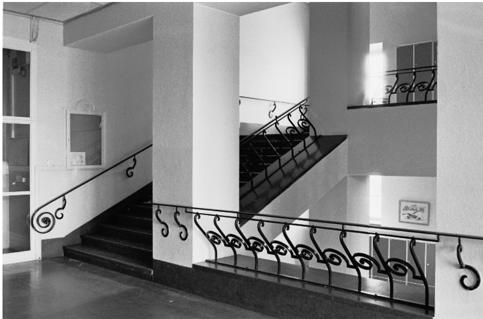
Fotografi av trapphuset med sina kraftfulla smidesräcken.