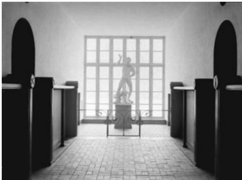
I korridorerna stod från början gipsskulpturer deponerade av universitetet.