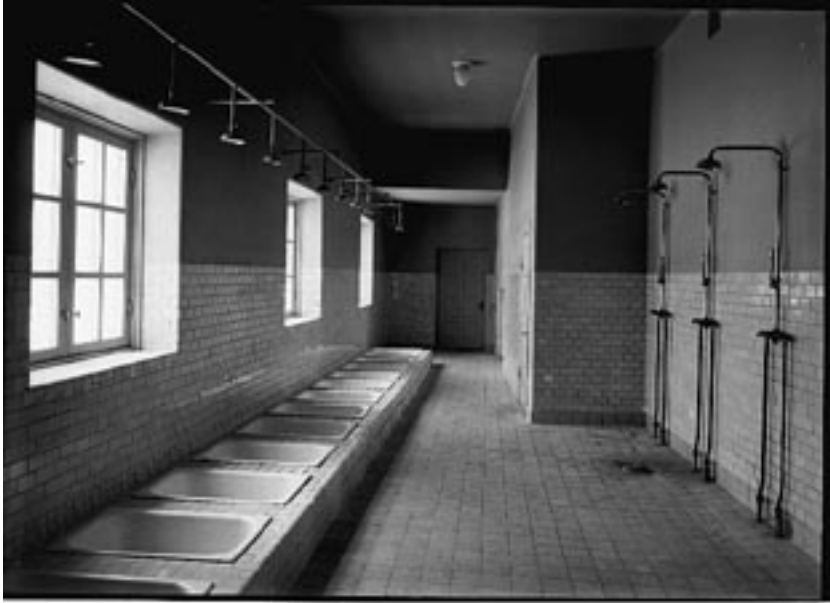
Bild från tvagningsrummet under gymnastiksalen. Rummet finns inte kvar.