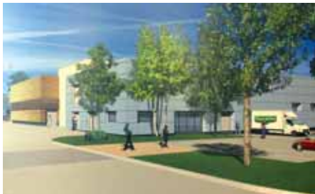
Perspective sur l'entrée de l'abattoir.