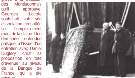
9 décembre 1945 : les cendres de Marx Dormoy sont exposées aux Montluçonnais sur le parvis de l'Hôtel de Ville drapé de noir.