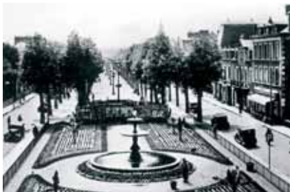
Années Trente : l'avenue sous sa forme originelle avec les toilettes en construction.