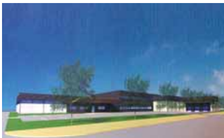
Vue du Nord-Est.