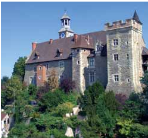
Le château des ducs de Bourbon, haut lieu du patrimoine militaire depuis la création de la ville historique, site défensif par excellence, accueillera le Mémorial.