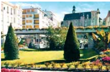
1964 : la statue cède la place à une station-service...