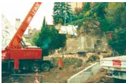
1994 : la statue est écartée pour aménager la place Piquand.

Mmn°543 du 7 juillet au 8 septembre 2005