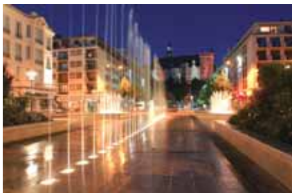
14 juillet 2004 : l'avenue retrouve ses fontaines.