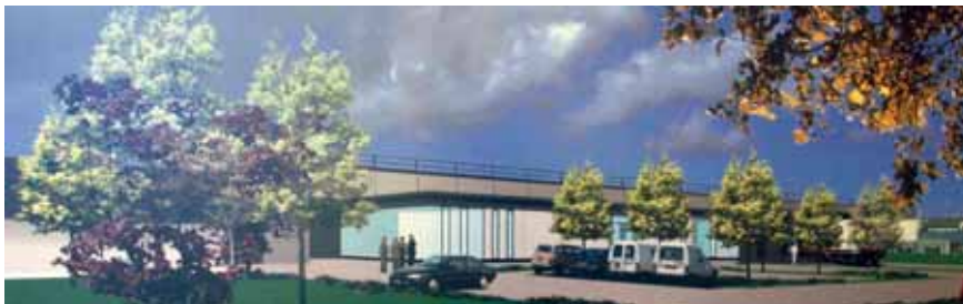
Perspective sur la façade principale.