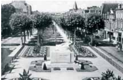
1948 : le gisant de Marx Dormoy est érigé au cœur de l'avenue.