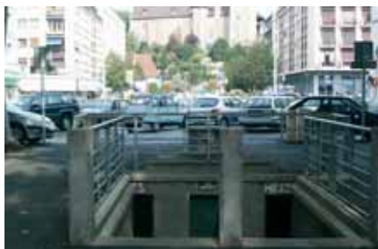
1999 - 2003 : l'emplacement libéré est colonisé par le stationnement.