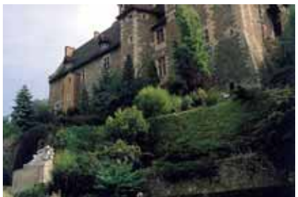
...et rejoint le pied du château, dans l'axe de l'avenue.