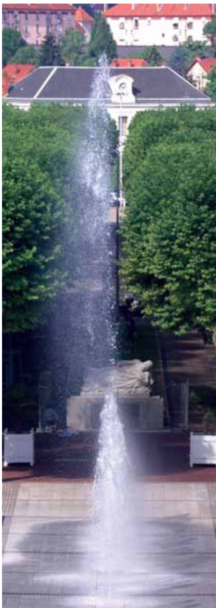
14 juillet 2005 : Marx Dormoy retrouve son avenue.