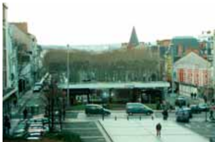
1999 : la station-service en fin de concession est détruite.