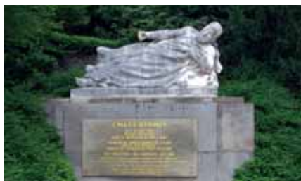
La restauration de la statue de Marx Dormoy, excentrée et malmenée par le temps et les hommes, était devenue plus qu'une nécessité : un devoir de mémoire.

Née de l'opposition irréductible de l'extrême droite activiste au stalinisme et au Front populaire soupçonné de collusion avec la révolution soviétique, la Cagoule est une nébuleuse de sociétés secrètes basées sur l'action souterraine et « une franc-maçonnerie retournée au bénéfice de la Nation », dont elle emprunte le rituel : recrutement par parrainage, serment prononcé au cours d'une cérémonie initiatique... Fondée par l'Union des comités d'action défensive, bientôt rejointe par les anciens Camelots du roi du Comité secret d'action révolutionnaire, elle s'organise en bureaux sur le modèle militaire (commandement, renseignement, opérations, recrutement et matériel). Maîtrisant l'art du coup d'état grâce à ses groupes de combat clandestins et aux conseils d'officiers sympathisants, la