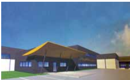
Entrée des bureaux.