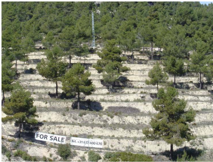
Foto 6. "For sale": la inmersión lingüística en los entornos turísticos.

Junto al mundo laboral y el recurso a los informes externos, otra de las dimensiones culturales que mejor informan de la presencia simbólica del turismo como una gramática que construye sentidos ordenando elementos conforme a nuevas reglas sintácticas y semánticas es la estética. El turismo en general, y el rural en particular, supone un goce para los sentidos y en la Bonaigua ese hedonismo radica, inicialmente, en el disfrute de la naturaleza, el silencio y la tranquilidad.