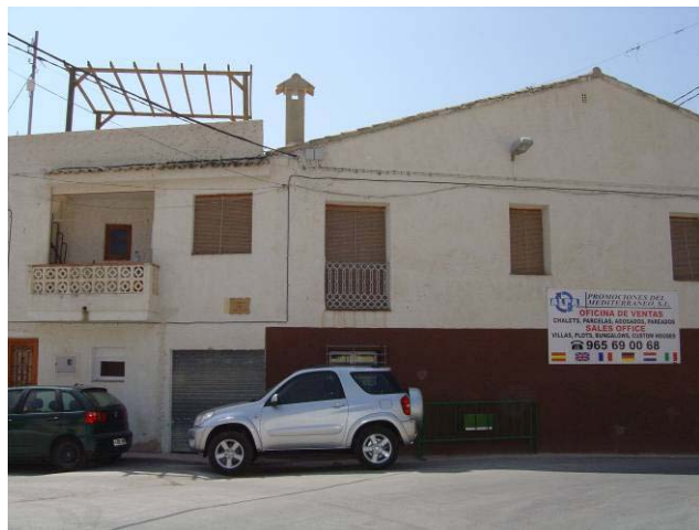
Foto 2. Neocolonización del espacio de calidad: 4 x 4 e inmobiliarias.

luta; por ello, aunque estratégicamente no abandonemos del todo el turismo como forma de desarrollo, la apuesta se encuentra en el sector industrial y en la construcción del nuevo polígono”. La construcción, formada por pequeñas empresas dedicadas a la albañilería de pequeña escala (reformas y rehabilitaciones), es una realidad que tiene su manifestación simbólica en la creciente presencia de nuevos usos urbanos, inmobiliarias y promociones de viviendas como se recoge en las siguientes ilustraciones.