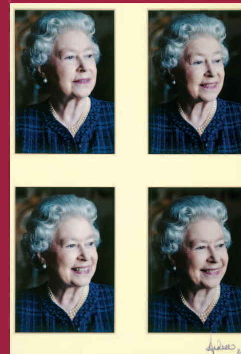
Neli portreed Tema Majesteedist kuningannast Elizabeth II, mille autor on poeg prints Andrew. A set of four portraits of Her Majesty Queen Elizabeth II taken by her son HRH Prince Andrew.