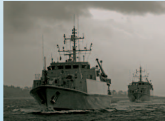
Sandown-klassi miinitõrjelaevad Sandown-class minehunters