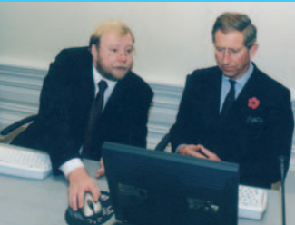
Peaminister Mart Laar tutvustab Walesi prints Charles'le Eesti E-valitsust. November 2001. Estonian Prime Minister Mart Laar introduces the finer points of Estonia's e-government to Prince Charles, the Prince of Wales. November 2001.