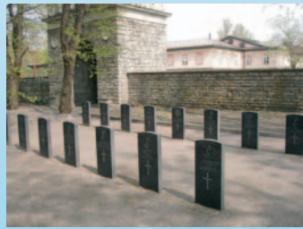
Briti meremeeste haudad Tallinna Sõjaväekalmistul. The graves of British seamen at Tallinn Military Cemetery