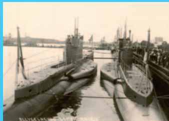
Allveelaevad „Kalev” ja „Lembit” Pärnu sadamas. August 1937. The submarines Kalev and Lembit at the port of Pärnu. August 1937.