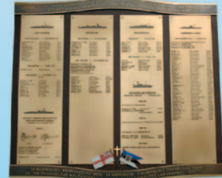
Mälestustabel Püha Vaimu kirikus Eesti Vabadussõjas hukkenud Briti meremeestele. A memorial plaque the Holy Spirit Church honours British seamen who fell in the Estonian War of Independence.