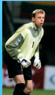
Eesti esiväravaht Mart Poom kaitseb alates 2005. aastast Londoni Arsenalis väravat. Estonia's first-string goaltender Mart Poom from 2005 plays for London's Arsenal.