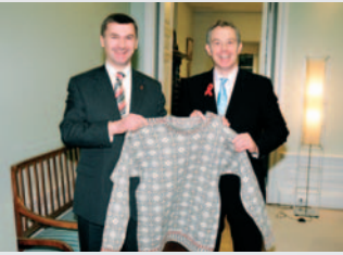
Suurbritannia peaminister Tony Blair ja Eesti peaminister Andrus Ansip Tallinnas. 1. detsember 2005. British Prime Minister Tony Blair and Estonian Prime Minister Andrus Ansip in Tallinn. 1 December 2005.