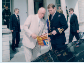
"Kas ka teil on kolm lõvi?" Yorki hertsog prints Andrew ja President Lennart Meri. Mai 1998. "So you also have three lions?" Prince Andrew, Duke of York, and Estonian President Lennart Meri. May 1998.