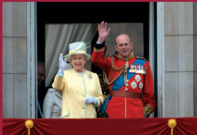
Tema Majesteet kuninganna Elizabeth II ja Tema Kuninglik Kõrgus prints Philip Buckinghami palee rõdul. Her Majesty Queen Elizabeth II and Duke of Edinburgh on Buckingham Palace balcony.