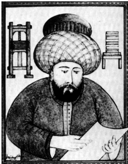
Ibrahim Müteferrika, a magyar-török nyomdász

Müteferrika papi pályára készült, emellett tanult könyvnyomtatást is. 18 évesen török fogságba esett. Rabszíjon Isztambulba hurcolták, és eladták. 23 évi rabszolgasága idején kiválóan megtanult törökül. 1711-ben tanulmányt írt a török szokásokról és törvényekről. Ebben közli életrajzi adatait, neve nélkül – talán szégyellte, hogy elhagyta protestáns hitét, talán a családját féltette. Tanulmánya nyomán felfedezte tehetségét Nevszehirli Damat Ibrahim pasa, a felvilágosodott tudós nagyvezír, aki a továbbiakban mindenben támogatta. A mohamedán hitre tért székely férfi