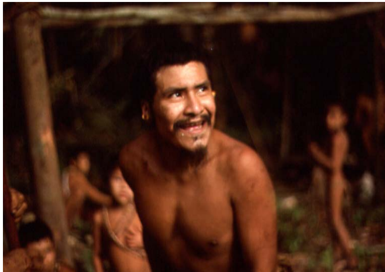
Anciano Hoti (Caño Iguana, 1976)

En décadas recientes, aparece un tercer pueblo indígena que igualmente utiliza los recursos naturales en el alto Caura. Estos son los Hoti, un pueblo cazador y recolector con una agricultura incipiente. Unos 800 miembros de esta etnia ocupan el sector occidental de la cuenca del Caura en los afluentes medios del Río Cuchivero en el Distrito Cedeño del Estado Bolívar y los afluentes septentrionales del Ventuari medio en el Estado Amazonas. Desde mediados de la década de 1980, los Hoti, llamados "wadu wadu" por los Ye'kwana, quienes han tenido una larga trayectoria de contacto con estos pueblos en el Amazonas, comenzaron a establecer campamentos temporales de caza y posteriormente, pequeños asentamientos y sembradíos (conucos) hacia el este de la Sierra de Maigualida en el medio Caura.