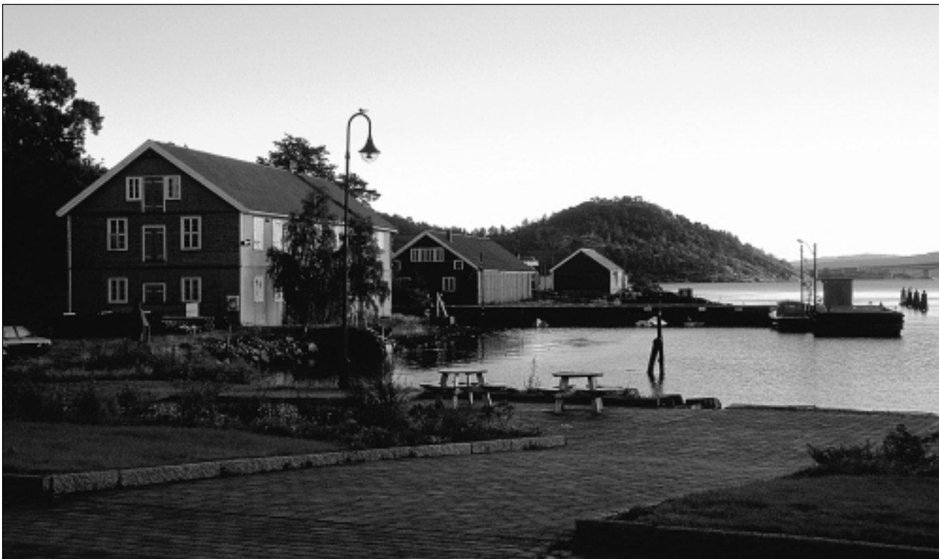
Varegodslageret og senere magasin «Gamla», inv.nr. 0039 fra 1898. I bakkant til høyre skimtes Varodden.