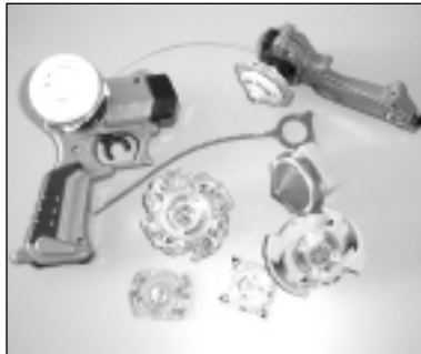
Les Bayblade, l'evolució més moderna de les tradicionals baldufes.

Les màquines recreatives eren enormes aparells, coneguts també com arcades, que podíem trobar en bars i salons especialitzats. No és estrany que aquestes màquines fossin la primera aproximació del públic adolescent cap als bars tradicionals (i no tradicionals) de la vila. Llocs com el Quim's o la Sala Saturn reunien desenes d'adoles-