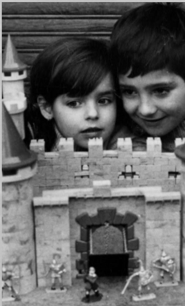
Joc i joguina a Cassà (1920-2000) Per GREC (Grup de Recerca d'Estudis Cassanencs)